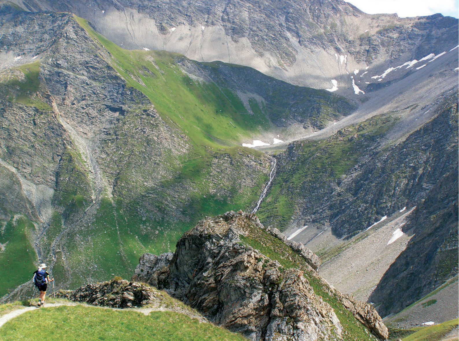
Bajando hacia el Pas Entre Deux Sauts

pero luego sale el sol y queda un día estupendo. En el Truc nos encontramos a los tres sordomudos. De allá para ir a La Balme hay varias rutas posibles; escogemos la intermedia, casi todo el tiempo por bosque, que serpenteando a media altura sube hasta el refugio de Tré-la-Tête (1970 m), con Les Contamines a los pies. De allí, siempre por bosque, baja hasta el de Nant Borrant (1489 m), donde enlaza con el camino "oficial" que sube de Les Contamines.