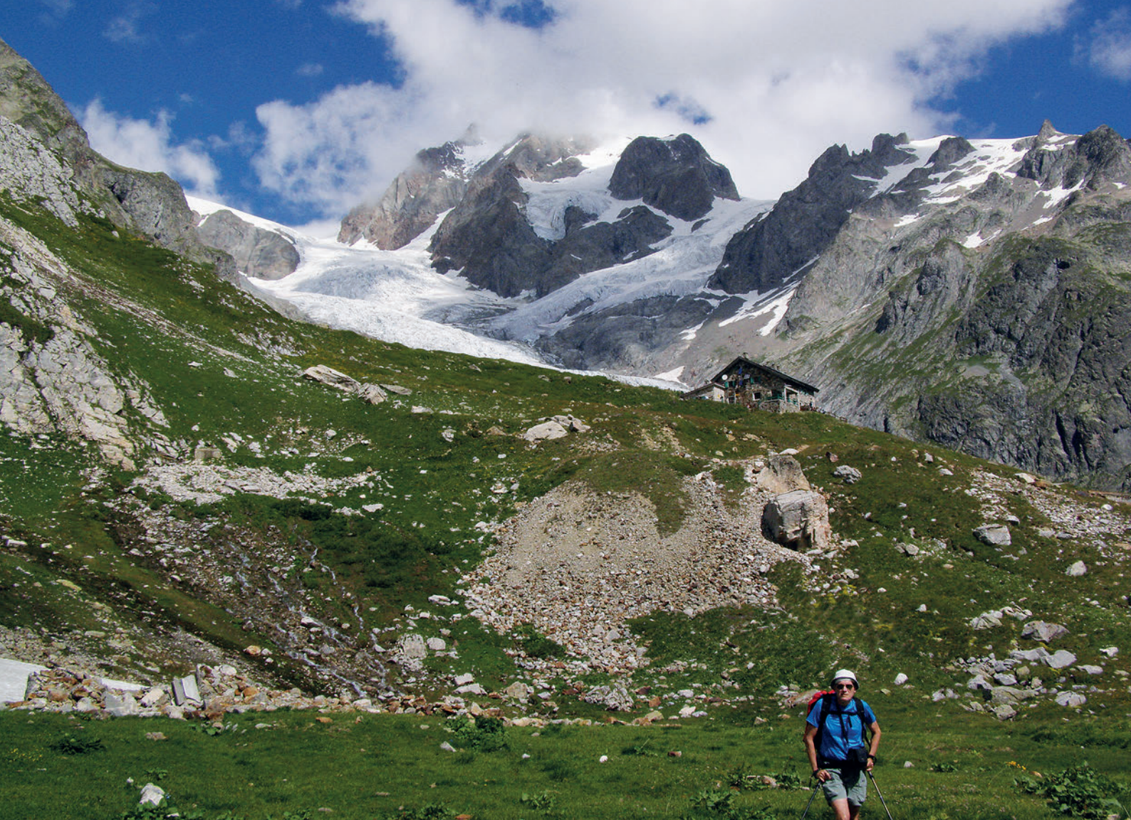
Refugio Elisabetta y Glaciar de la Lex Blanche

de madera o metálicos. Se va nublando el cielo. Cerca vemos unos sarríos. Empieza a llover y tenemos tiempo justo de divisar la Flégère antes de que lo tape la niebla.