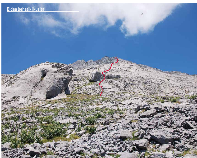
Bidea behetik ikusita

Bestetik, mendia guztiona dela adierazi nahi dugu eta edozeinek egin dezakeela bere neurriko ekarpena, beti ere bere gaitasunen arabera. Gogoak urtean ere egin dezake bidea. Kasu honetan eskalada erraza da, baina eredu tradizionalari jarraitzen diona: eskalada askea, ia hornitu gabe utzitakoa. Etxean egin dako iltze bat baino ez duzue topatuko. Bidea zabaldu dugunok ere gure mugak dauzkagu: gutako bat aitona da, erretiroa hartu duena, minbiziak jota dagoena. Besteak (neronek), aita izanik, ez dauka eskalatzeko astirik eta eskuineko eskua erabat mazpilduta dauka istripu baten ondorioz, hatzamar bat eta eskuturra mugitu ezinik; horregatik hain zuzen ere ezin izan nuen iltzea atera. Bizitzaren estekek bihurtzeko gaituzte etengabe, baina bihurtzeari aurre egiteko moduak badaude. Kasu honetan, Anbotoko malda bihurria zuzenean gaintuz eskalada garbi eta askean. Soin zaharrak, bide berriak.