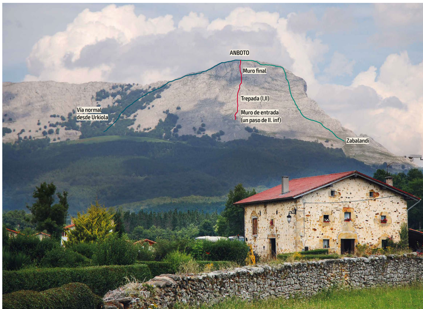
Anbotu Oletatik. Hegoaldeko horma, bide zuzena

Bidea, eskaladaz harago, erreibindikapena ere bada. Bide berriak zabaltzeko aukera egon badagoela aldarrikatu nahi dugu, non eta hemen, urrutira joan gabe, etxean bertan. Anbotu mendi ezagunenetakoa omen da, hainbat artikulu idatzi dira bere gainean eta liburu askotan agertzen da, baina oraindik orain hamaika aukera eskaintzen ditu.