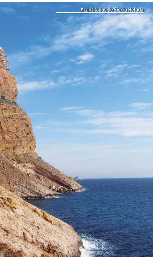
Acantilados de Sierra Helada