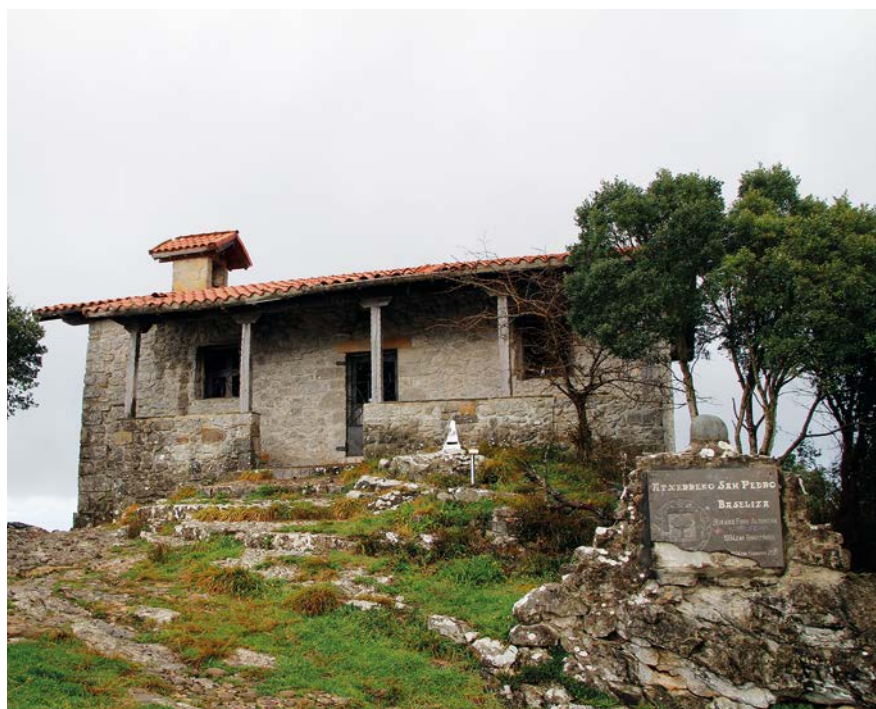
Ermita de San Pedro de Atxarre, en la cima del monte Atxarre

Abandonamos el área recreativa de San Bartolomé por un camino carretil que en dirección noreste nos lleva al barrio de Olabe en Bedarona, habiendo dejado a mano derecha el caserío Olabe. Recorridos 500 metros, llegamos a este, y nos encontramos con la carretera BI-3481 entre Ea e Ispaster y el caserío Elorria. En este punto debemos de prestar