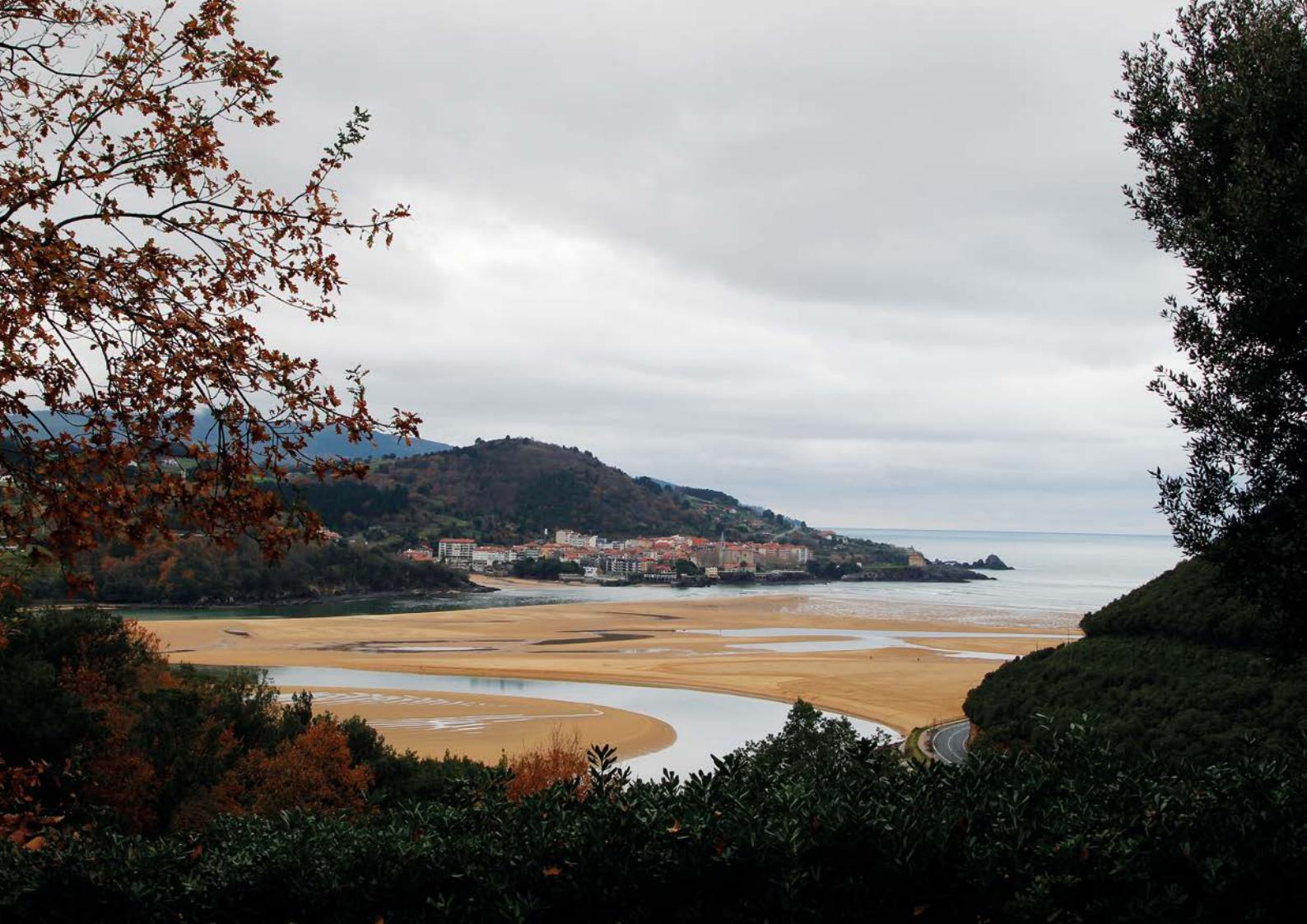
El pueblo de Mundaka desde la bahía de Arketa

de arena en el siglo XVII. Seguidamente pasaremos un puente de madera para encontrarnos a escasos metros con el inicio del Vía Crucis. Durante el recorrido del mismo, con una longitud desde la ermita hasta el puerto de 500 metros, existen 5 cruces dispuestas en los laterales del camino, teniendo así la oportunidad de seguir los antiguos pasos de las letanías hasta el magnífico mirador de la atalaya y su ermita.