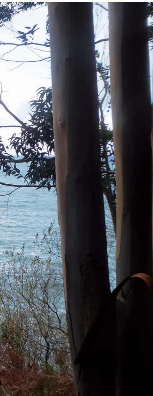
El mar Cantábrico desde la ermita de Talako Ama

Tomamos dirección noroeste y nos dirigimos hacia el interior del barrio, para encontramos a 160 metros una derivación del sendero que en 2,3 km nos permite llegar a la playa de Laga. Continuamos la marcha, pasando junto a la iglesia de Santa María Engracia, una pequeña y preciosa iglesia con torre y campanario levantada en el siglo XVI. Seguimos de frente y en 130 metros encontramos un camino a la izquierda el cual obviamos continuando la marcha hasta al-