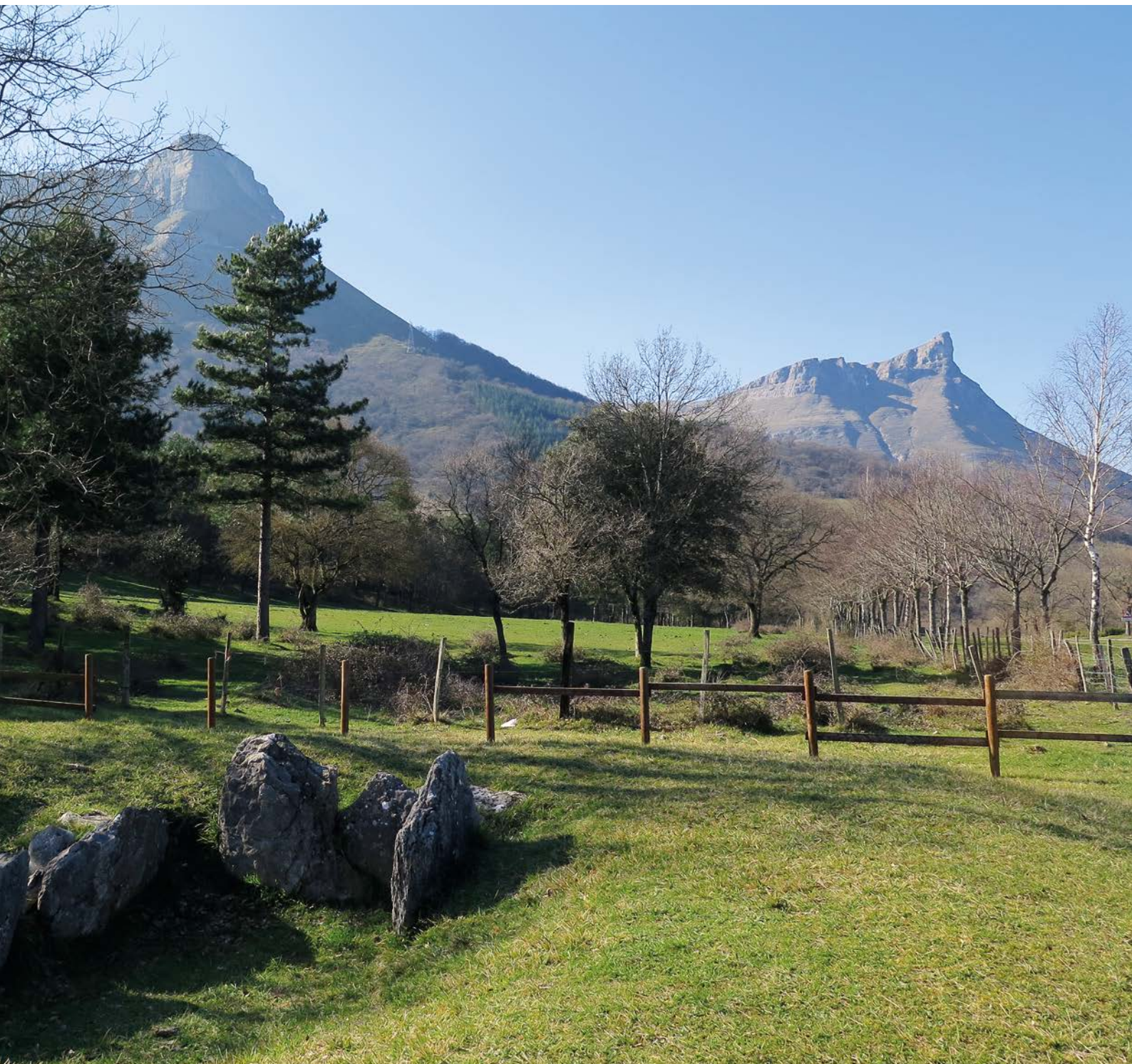
Txosna atsedenekuan aurkitzen den Goiko Landetako trikuharria, Iturrigorri atzean