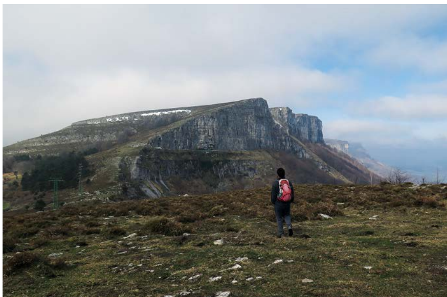
Goldetxoko lepora bidean

Txosna (La Choza) basabidearekin batu gara azken ur-jauzian eta aurrera jarraitu dugu Txosna iturri (Fuente La Choza) atsedeneku-rra iritsi arte. Ez erratu puntu hau aparkalekua eta trikuharria duen puntuarekin, hori aurrera-txoago aurkituko baitugu. Txosna edo La Choza atsedeneku eta aparkalekutik Iturri gorriko ikuspegi ederra dago. Bertan, iturria eta Goiko Landetako trikuharria aurkitu ditugu. Puntu honetatik aurrera basabideak albo batera utzi eta bide bazterretik bueltatu gara Urduñako Antiguako santutegira, Lateta atsedenekuaren ondotik igaroz. Abiapuntura iristean, 14 kilometro oinetan, 829 metroko desnibela hanketan eta irribarre zabala ahoan. Hurren arte Gorobel!