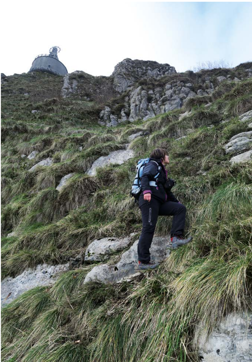
Bigarren irtengunera bidean