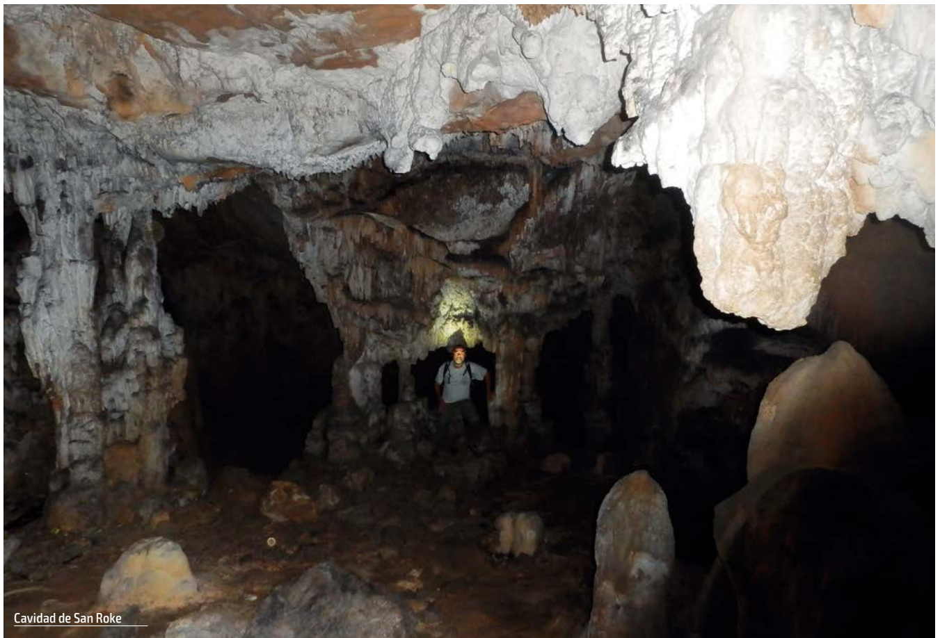
Cavidad de San Roke