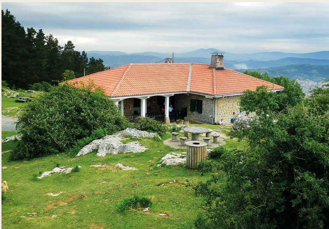
Refugio del Paga

Le gusta la montaña pero sin complicarse la vida. Es de tachar, sin marear la perdiz, es decir, llegar por el sitio más corto, si es posible. No le motivan las caminatas si no hay, al menos, una cima que subir; aunque le da exactamente igual la popularidad de la montaña en sí.