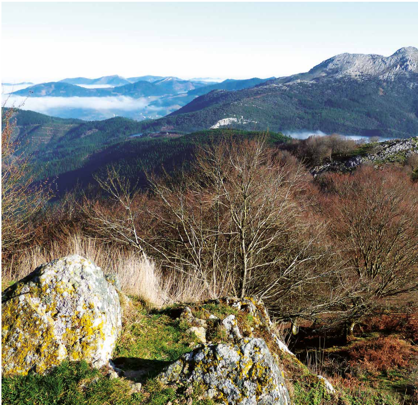
Lurgorri eta Besaide Tellamenditik

Bikotekidea aurkitzekoa gerorako lagata, errepide aldera jaitsiko gara. Hoteletako zonatik bidea gurutzatu eta gora egingo dugu aldapa malkartsu batetik. Eskuin-ezker eginda, aldats luzea jarraituko dugu, Untzillatx mendia ikusgai dugula. Saibin izango gara segituan, azken kaskoa baino ez zaigu falta. Gurutzerako bidean, han eta hemen, gerra garaiko lubakiz mukurua beteko malda zapalduko dugu. Hemen izandako borroak oso latzak eta bortitzak izan ziren; erasoak, gainera, amaigabeak. Eskutik eskura pasatu zen mendi honen kontrola lauzpabost aldiz egun gutxitan. Odolaren mendia batailatu zuten Gerra Zibilean, eta horrela da ezaguna gaur egun. Goian gaudela, jakitun izango gara zer zela eta izan zuen horren-