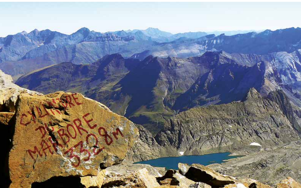
Etapa 4: Cima del Marboré

da que otra, hasta llegar a la llamada "Ciudad de Piedra", un poco más arriba está el desvío que nos introduce, a la izquierda, en la Faja Roya. Ésta rodea el Cilindro de Marboré, con hitos y spray naranja, por una sucesión de plataformas hasta alcanzar la base del Marboré.