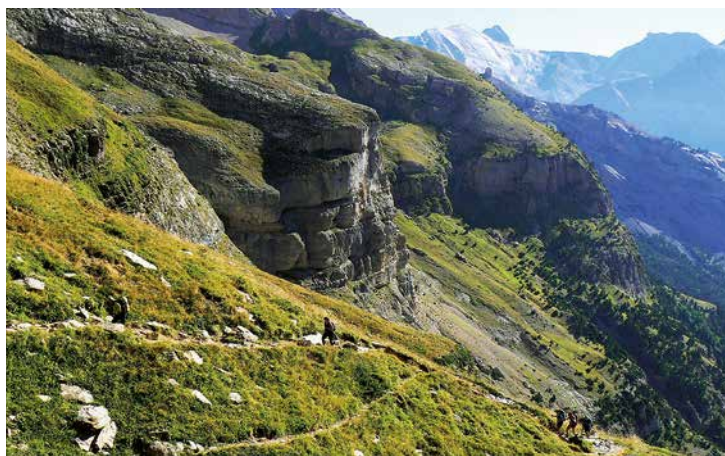
Etapa 1: Subida al Balcón de Pineta

Las cimas que ascendimos fueron: Tuca de Pineta (2859 m), Pi-