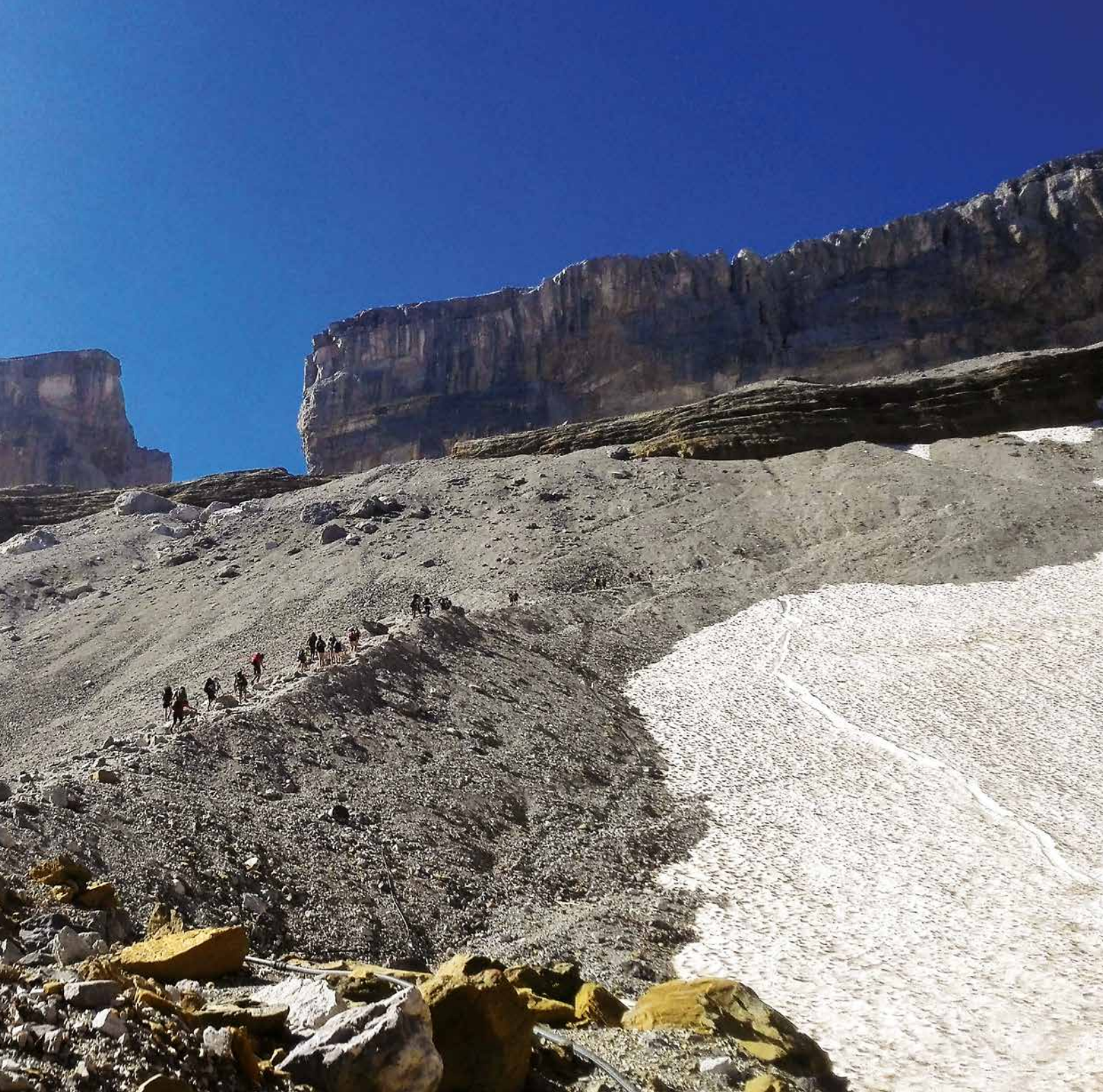
Etapa 2: Brecha de Rolando

Descendiendo al collado y caminando para bajar por la cara opuesta, hacia los Llanos de Salarons, se alcanza en poco tiempo el collado del mismo nombre. Se sigue por los Llanos de Millaris hasta alcanzar el siguiente collado, el del Descargador. Desde aquí y en menos de 15' se puede alcanzar la cima del Pico del Descargador (2627 m). Seguidamente se va hacia el desolado Cuello de Millaris para continuar (sur) hacia la cumbre del Tobacor. Son 4 km de ida y vuelta, caminando por la fácil y marcada loma somital. Un buen sen-