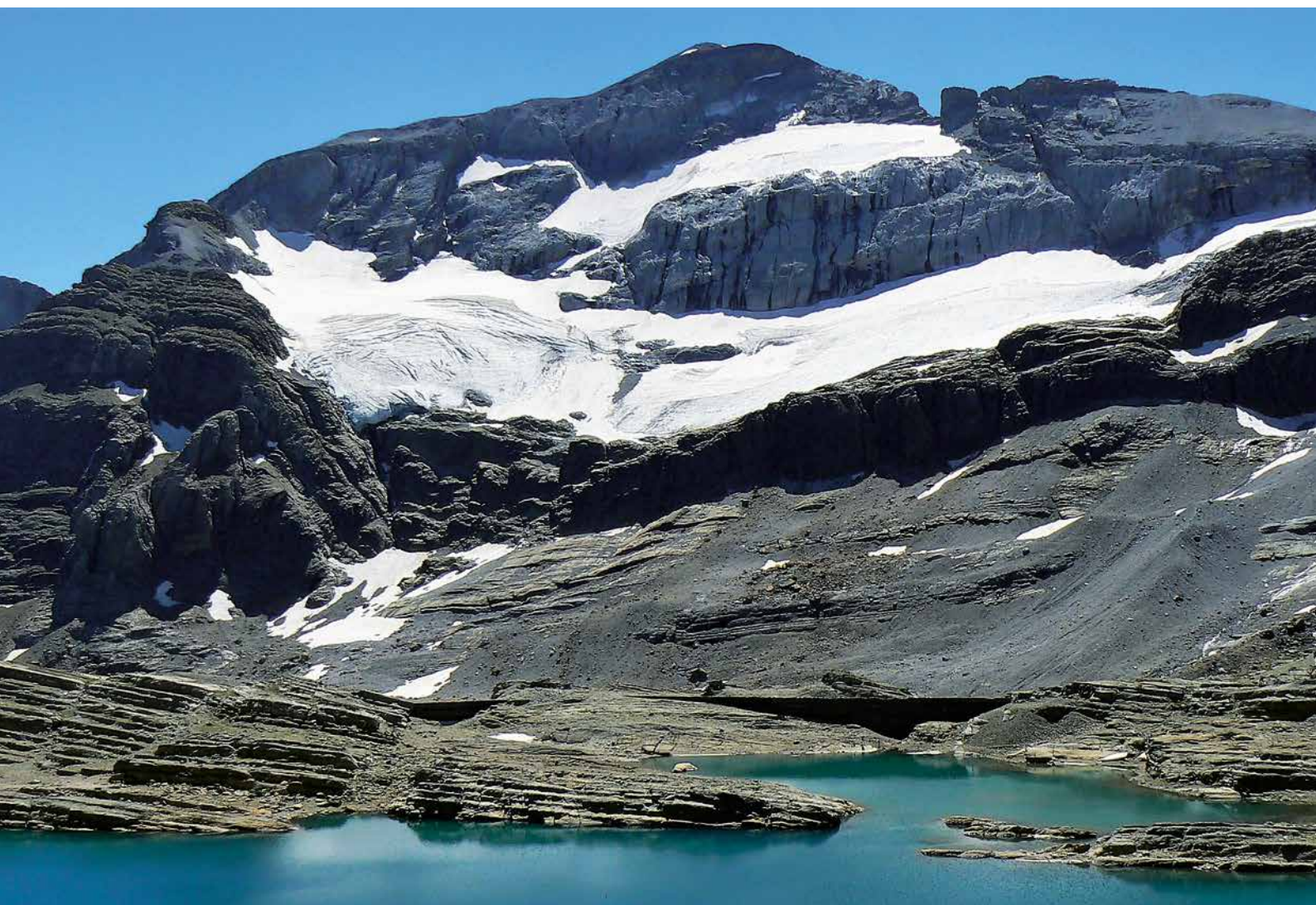
Etapa 1: Norte del Perdido

mener/Pimener (2801 m), Tallón (3144 m), El Casco (3011 m), Cabietos/Gabietos (3035 y 3031 m), Mondarruego (2845 m), Tobacor (2779 m), Punta de Treserols/Monte Perdido (3348 m), Cilindro de Marboré (3325 m), Marboré (3251 m), Punta de las Olas/Punta deras Solas (3022 m), Pico d'Añisclo/Soum de Raymond (3257 m) y Zucón (2802 m).