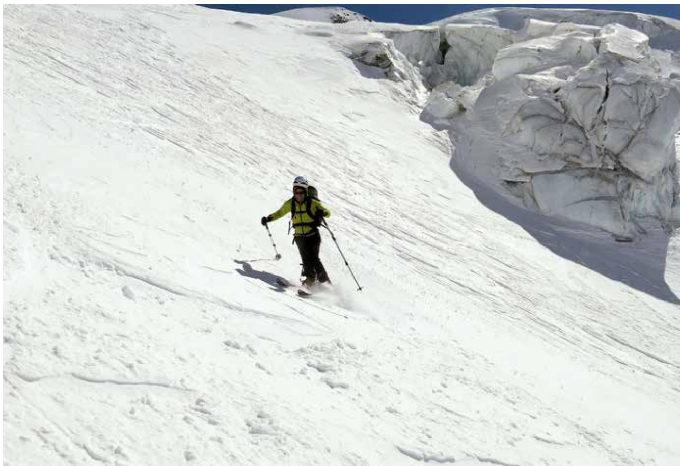
lxiar eskiatzen, hori da hori estiloa!

gabe, harik eta Forniko glaziarraren mingainera atera arte. Glaziarraren hondo-hondotik hegoalderantz segituz, erdiko morrena eta segidan plateau edo ordeka zabalean barrena jarraitu dugu igoera samurrean. Ikaragarria da aurrez aurre duguna: tontor garai menderaezinen koroa, begi-bistaren zabalera osoarekin biltzen gaituen glaziar ia amaigabea, izotz-jauziak eta gu erdi-erdian, txingurri nimiñoak mundu izoztu honen handitasunean. Izan ere, egun eguzkitsua, ederra! Zoritzen ari gara dakusagun paisajeaz: Punta San Matteo parean jakina!, Pizzo Trezero eta abar luzea. Atzean pixkanaka Gran Zebrú edo Konigspitze menditzarra azaltzen hasi da.