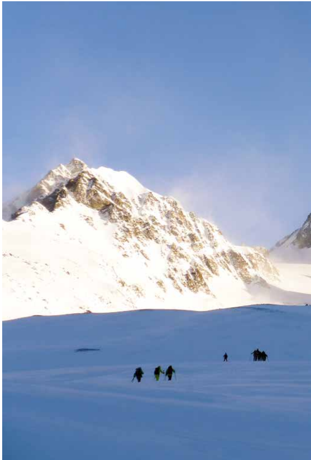
Gran Zebrú/König-spitze (3851 m) erraldoia, gure zaindaria bailitzan ala guri erronka bota nahian?

ra. Ordezko gisa, Pico Pasquale aldera abiatu gara 7:40tan. Mendebalderantz mendi eder elurtuak ikusi ditugu goizeko eguzki printzeekin. Elur hormatu zeharo gogortuan gorantz jo dugu. Laster IE-rantz jarraitu dugu Val di Rosole haraneko aldapa samurretan gora. Eguraldia ordea, txartzen ari da, lainotzen. Ikuspegi hauxe daukagu: batetik, eskuinean Palon de la Mare menditzarraren malkar tenteak eta glaziar eskegia; bestetik, ezkerrean Cima Branca hiru milako xumea eta lainoak ezkutututako Cima Pasquale. Laino artean geroz eta itsuago gabiltza, argi dago buelta eman eta egindako bidea desegin behar dugula. Eguraldiak planak aldarazi dizkigu. Hala, gaur guztiak hartu motxilan eta aterpez aldatu gara. 10:10 aldera Cesare Brancatik atera eta ordu laurden baten buruan, haranez aldatzeko bidegurutzean gaude. Hortik segidan Valle di Cedec haranean malda lasaietan igo gara Pizzini aterperaino (2706 m). Pizzini-Frattola aterpea oso toki estrategikoan kokatua dago Cedec-en haranaren buruan: bertatik sona