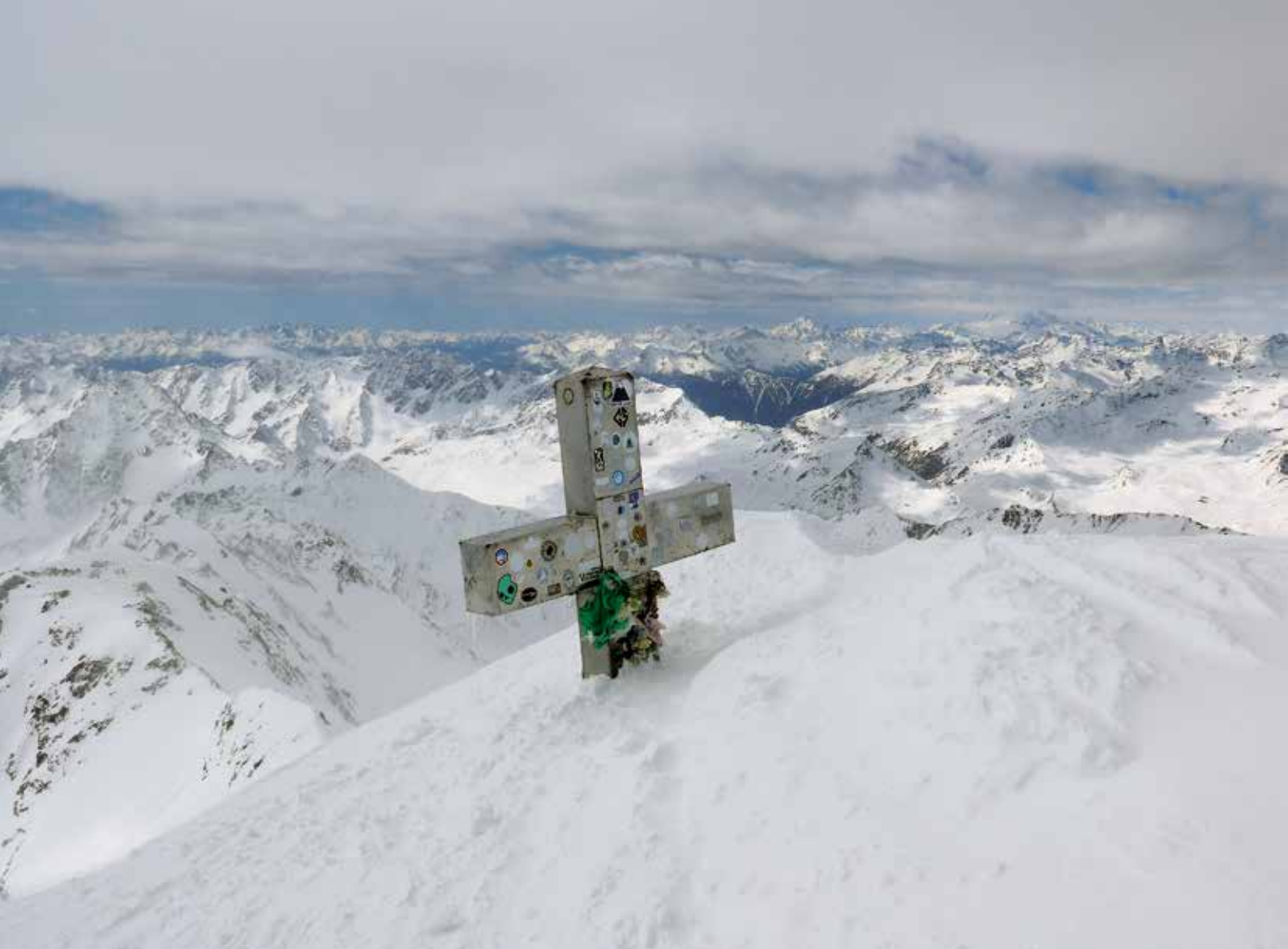
Punta San Matteo gailurreko metalezko gurutzeta, hamaikatxo ekaitz jasandakoa

nahian. Ba ez, ez diogu erronkari helduko, bere azken aldapa tentea aurreko egunetan elurrez kargatu egin da eta. Ordu erdiz EIE-ko noranzkoan ibili ondoren, HE-rantz aldatu dugu, alegia, Vedretta di Cedec glaziarrean gora egiteko. Goi-goian ikusi dugu gaurko gailurra. Gure aurretik dabilzan beste bizpahiru taldeek arrasto ona utzi digute, beraz, grazie mille! Glaziarraren izotz-jauzia ezkerretik saihestu dugu sigi-sagaka malda pikoagotan. Geroxeago, berriz ere aldapa samurragoetan ibili gara eta eguzkiaren argi-printzek gaurkoz lehenengo aldiz aurpegiak laztandu dizkigute. Hamaiketako gisa barratxo bat jan eta aurrera!