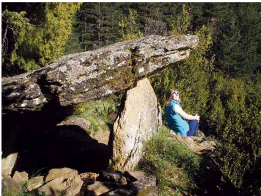
Mil campanas trikuharria