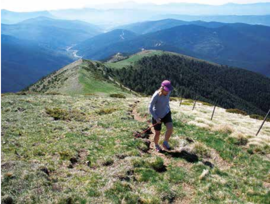
La Lera tontorrera heltzen

Igotako bidetik lepora itzuli eta aurrez aurre agertzen den aldapari eutsiz, San Salvador tontorreraino igotzen da. Bertan dagoen ermitan Erdi Aroko margo bat dago, baina kopia da, originala gordeta baitago. Hiru tontor daude eta hirurak egitea oso erraza da. Ermitak, iparraldera begira eserleku bat du eta hegoaldera begira beste bat. Atsedena hartu eta bi isurialdeek erakusten duten ikuspegi desberdinez gozatzeko aukera ezin hobea.