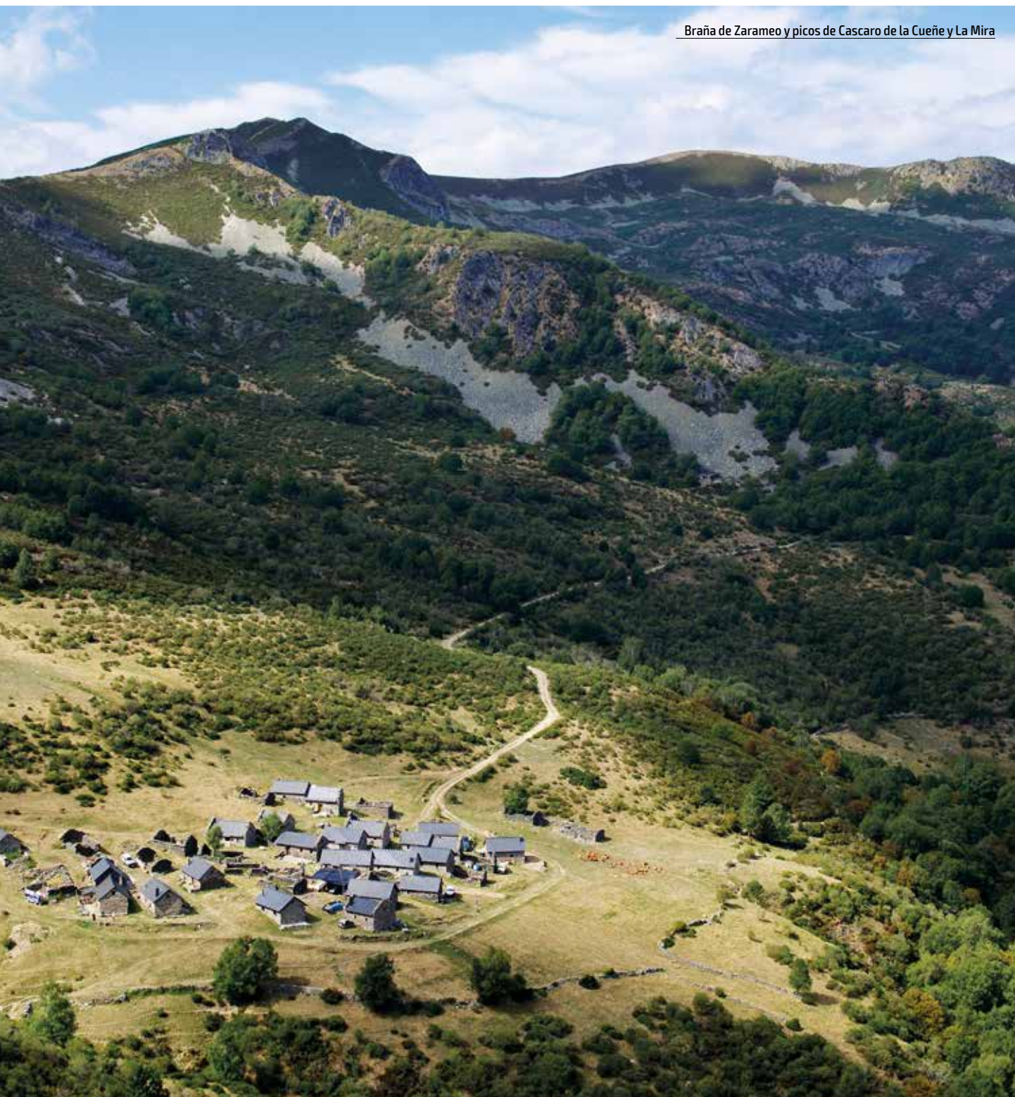
Braña de Zarameo y picos de Cascaro de la Cueña y La Mira