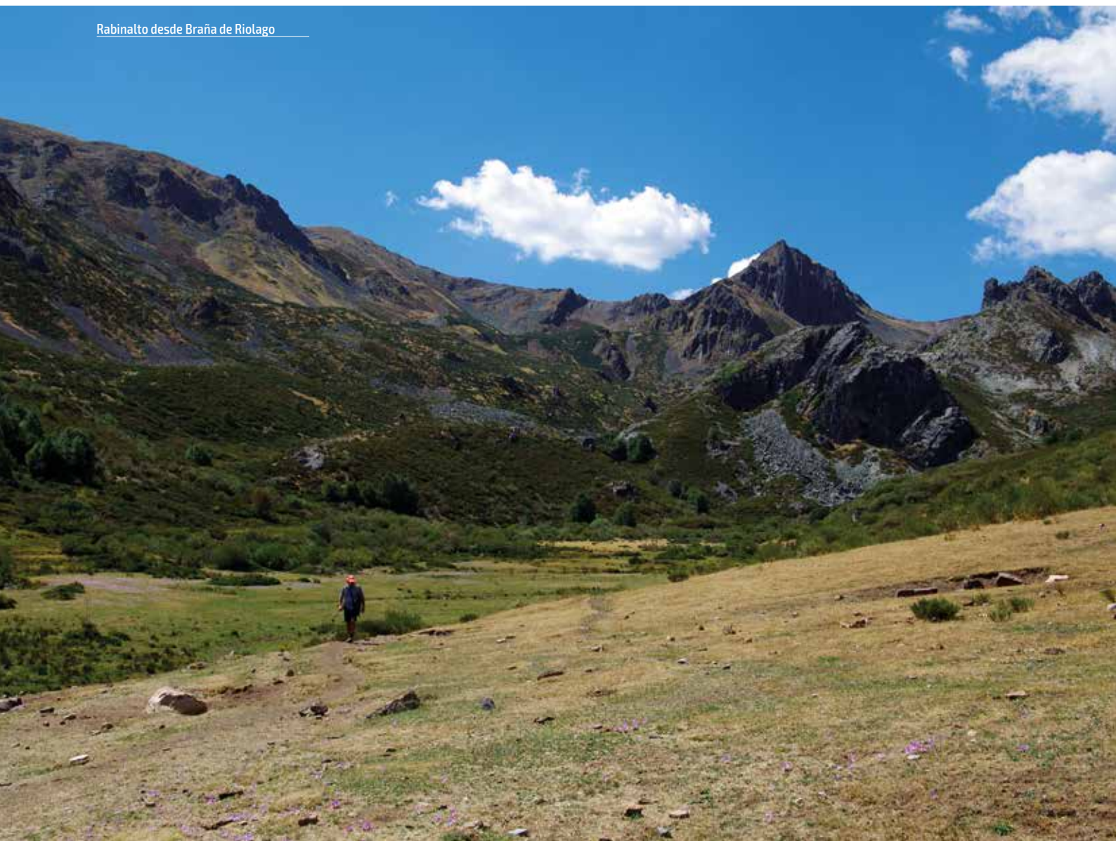
Rabinalto desde Braña de Riolago

Hoy nos dirigimos al "techo" de Omaña, el Alto de la Cañada, que forma parte de la sierra de Villabandín. Desde Murias por Senra y Lazado enseguida llegamos a la cercana aldea de Villabandín situada en el valle Chico. La aldea está dividida en dos barrios; desde el Barrio de Abajo abandonamos el asfalto para tomar