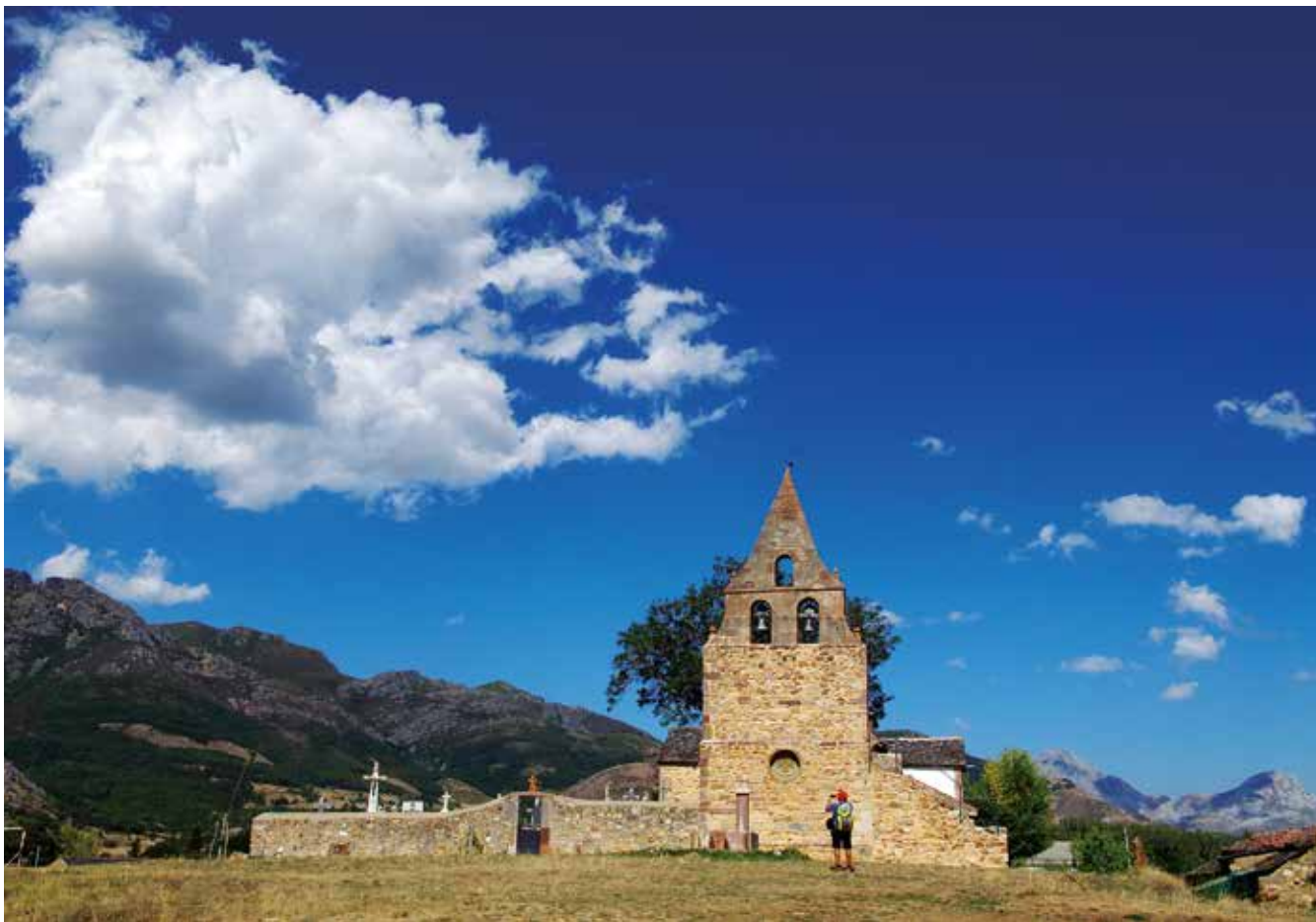
Huergas de Babia

8:00 am. Dejamos el coche en la aldea y tomamos la pista apta para 4x4 que nos conduce en suave subida hasta el Collado de Campo. Desde este punto contemplamos el extenso valle de Campo de Santiago y el pico de la Cernella por el que pasaremos. Rápidamente bajamos por la pista hasta la Ermita de Santiago donde confluyamos con el camino que viene de Colinas del Campo... hasta aquí hemos tardado cerca de dos horas.