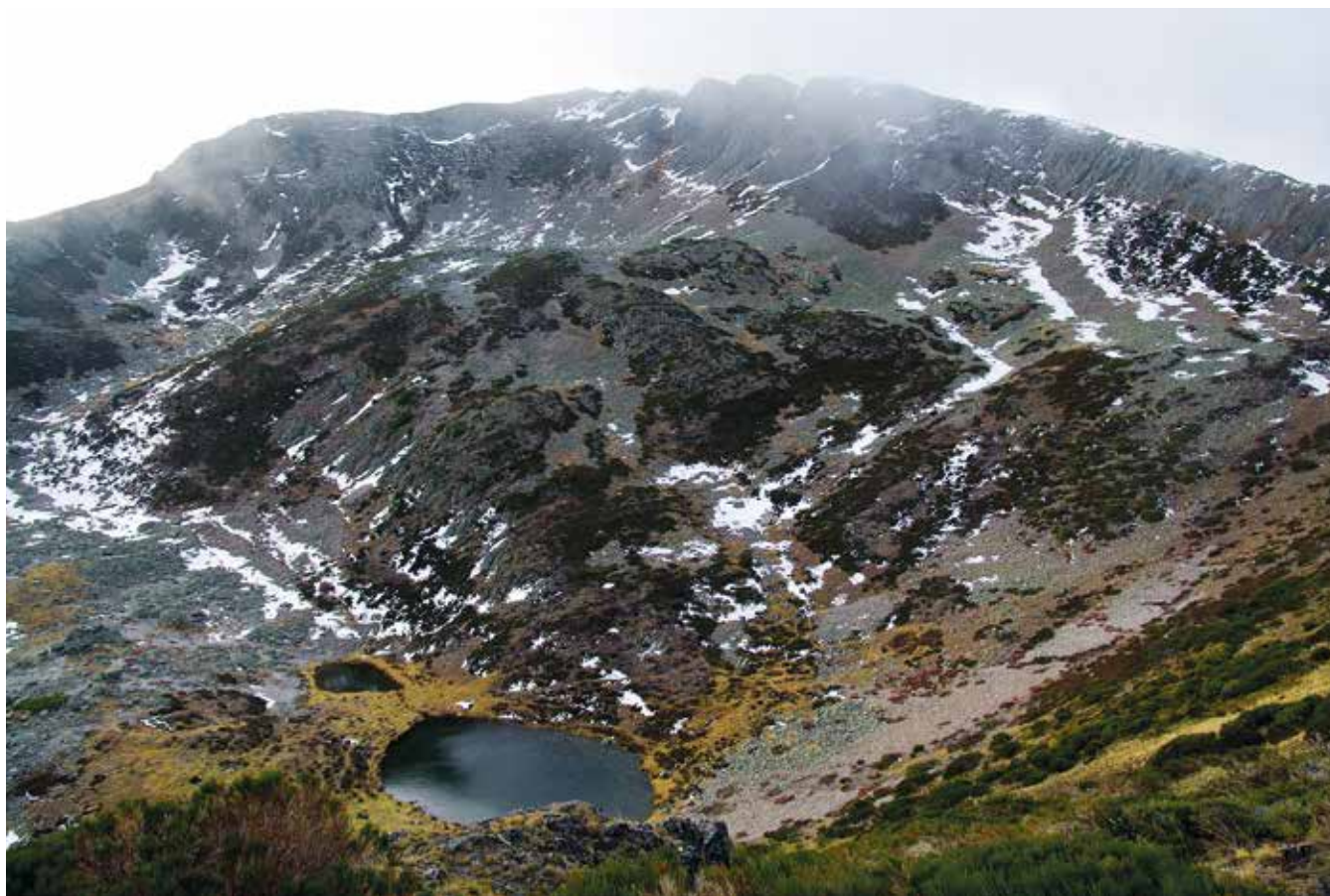
Pico de la Cernella

una pista que sale a nuestra izquierda. Son las 09:00 am, hace una mañana radiante que augura otra jornada de sol y calor. Dirigidos por Riesco remontamos la pista que asciende por el espinazo de un contrafuerte dejando a los lados los barrancos de Estiliello, a la izquierda, y Cervienza a la derecha. Vamos subiendo entre robles con la vista puesta sobre la altiva cima sur de Peña de la Arena (2116 m). La pista va perdiendo pendiente mientras va girando hacia el oeste y cruza la cabecera del Arrollo Estiliello para llegar al Alto Carralba. Desde aquí vamos perdiendo altura en suave pendiente a medida que la pista va acercándose al barranco Entrepiedras. En poco tiempo la pista nos deposita en la hoya glaciar de Braña Llampá; a su izquierda se encuentra la Braña Fisdemoros con una cabaña. Esta última braña pasa desapercibida ya que ambas se encuentran separadas por una elevada morrena cubierta de vegetación. Este auténtico circo está enmarcado de izquierda a derecha por las cumbres de Peña de la Arena (2116 m), Rabinalto (2117 m), Alto de la Cañada (2157 m), peñas las Cucharas (2048 m), y La Bidulina (2023 m). Para continuar debemos atravesar la braña y, siguiendo unas rodadas hacia la derecha, en-