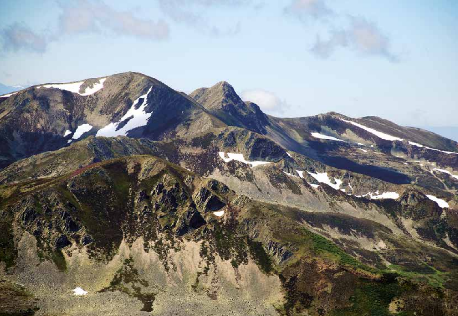
Pico de la Cernella (2117 m) y Catoute (2112 m)

dero paralelo al cordal; vamos girando hacia la izquierda y cruzamos el arroyo de pico Vendimia para alcanzar la cara sursuroeste del pico por donde ascenderemos entre campas hasta la amplia cumbre nevada del pico Nevadín .