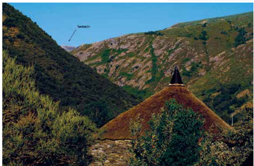
Tambarón desde Murias

Son las 09:00 am, el cielo está despejado pero el sol tardará un rato en alcanzarnos. Según avanzamos por la pista sin apenas