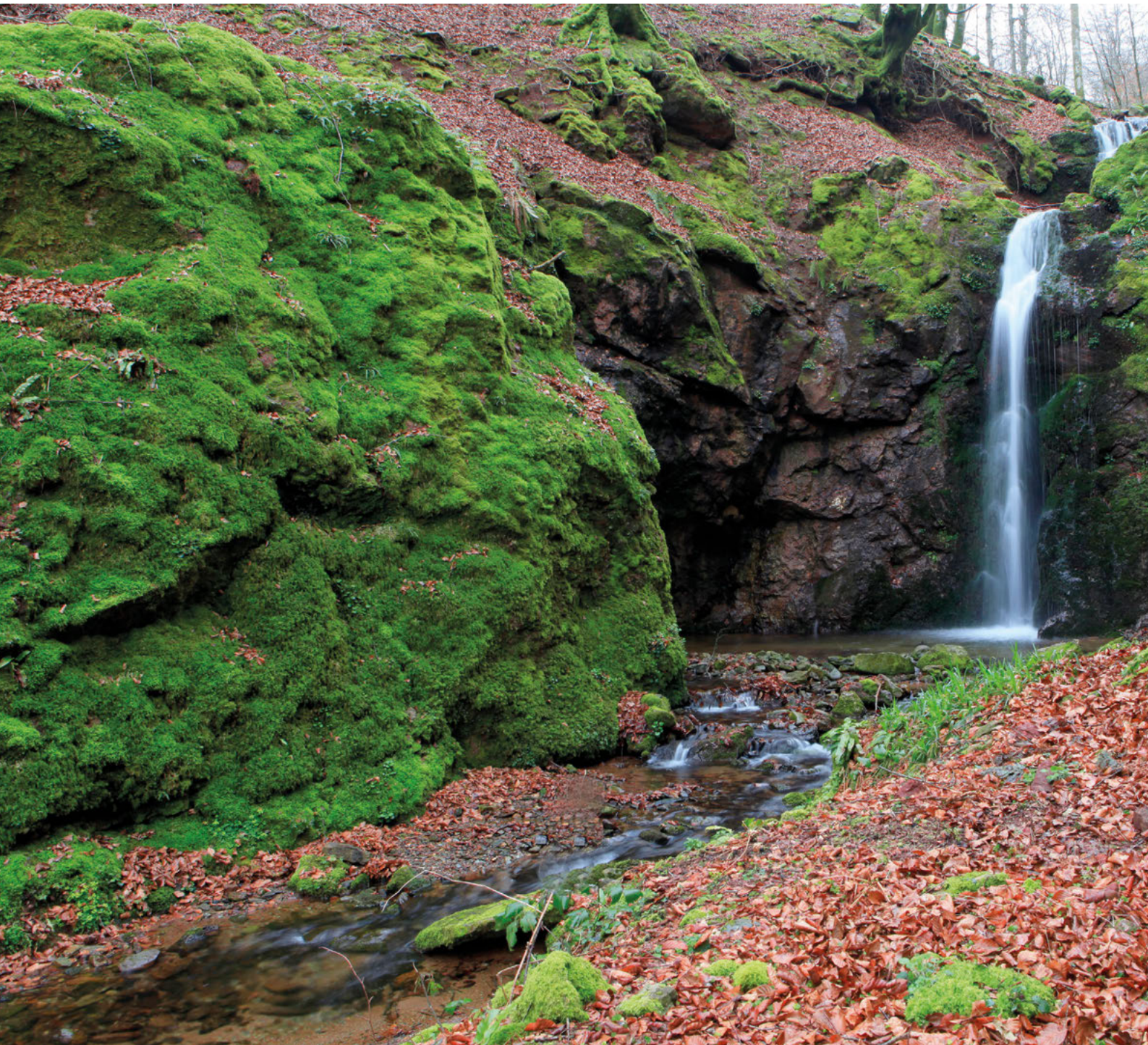
Minetako zokoa (Iñarbegi, Erratzu).

tzuriz borda ondoko lepora jaitsi, eta Soalar ezker aldean utziz, alantzearen hesiarekin topo egin dugu, baita gainera pasatu ere, gisa honetan lur komunalean sartu garelarik (Baztango luraren %84 komunala da). Ahal bezain asots gutien egiten saiatu gara, hantxe baitzebilten piriniar arrazako behi andana, marru-marru jaten. Berehala Idilepora ailegatu gara eta hegoaldera segituz, Burgako oiha-nean sartu gara, tartean izen bereko tontorra eginez (872 m, 2 or). Berriz ere lainoa lagun,