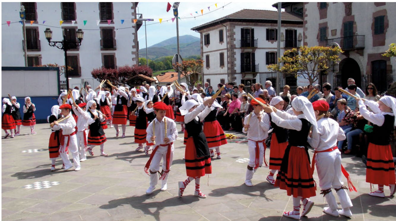
Maiatzan ospatzen diren Irurritako "Salbatore" bestak, Baztango lehenbizikoak izaten dira.

Tokiko nekazariak erraten duten bezala Hauzan bazkatu duen aziendak ez du bertze inon bazkatu nahi.