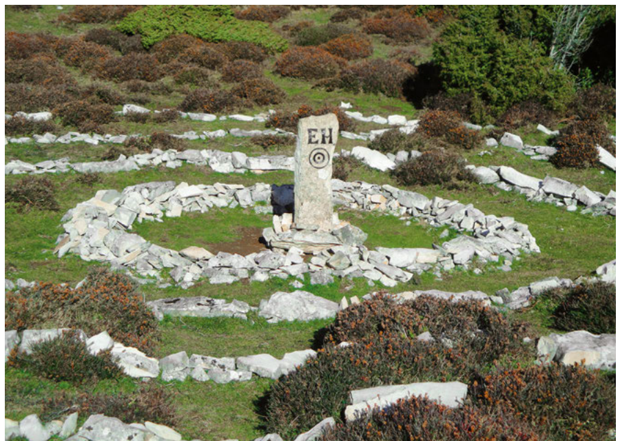
Centro de Euskal Herria.

nar. En su parte alta, tras pasar por un portillo, la senda nos ayudará a ganar altura entre boj, conducidos por mojones de piedras, hasta dar en la parte alta con la pista de Unanu-Lizarraga. Seguiremos por ella por la derecha, con la vista puesta sobre la cima de Beriaín que veremos al final, en lo más alto. A la altura de la doble cima de Lezizagoa, situada en la cresta de