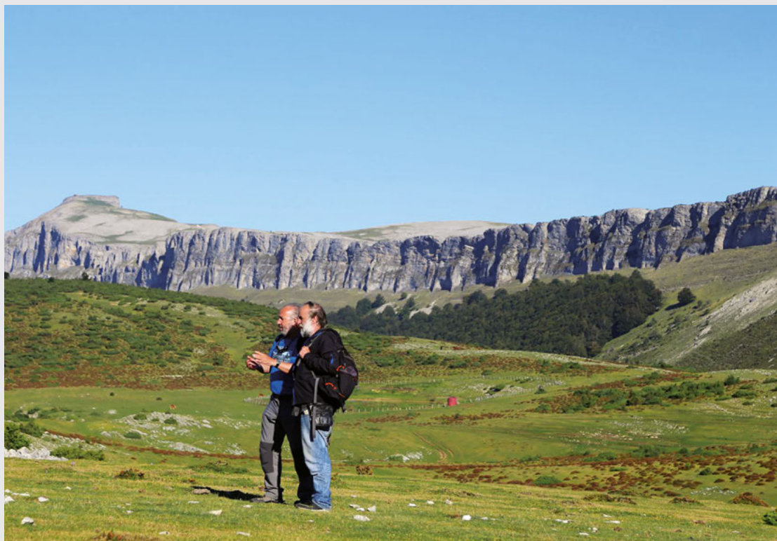
Unión de los caminos de Unanu y del puerto de Lizarraga.

Se inicia en el montañismo a los doce años: escalador, espeleólogo, esquí nórdico desde principios de los sesenta. Miembro de la ENAM, GAME, ARSIP, ERA... Presidente dos veces de la FNME, director de senderismo de la FEDME, vicepresidente de la Federación Internacional de Senderismo, divulgador del montañismo desde 1963 en prensa, radio, revistas... y autor de 37 libros.