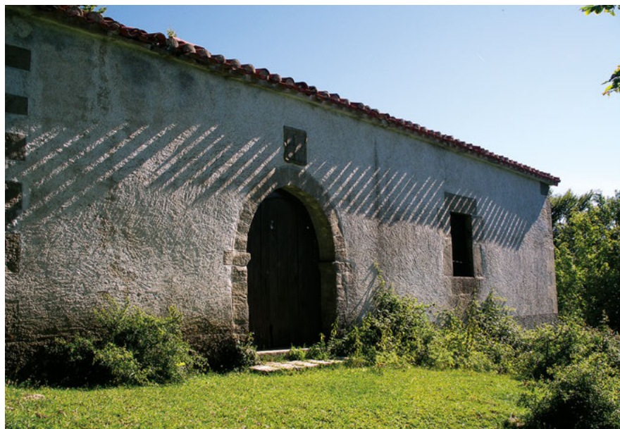
Ermita de San Miguel de Goñi.

6 UNANU » Salir de este pueblo escalonado en las faldas del puntal de Beriainpunta por una pista que nos llevará por el depósito de agua del pueblo y la fuente de Iturtxiki, donde arranca la senda de Beriain, que hemos de ignorar. Más arriba en el primer desdoblamiento de la pista continuar por la izquierda, ganando altura por los flancos de la