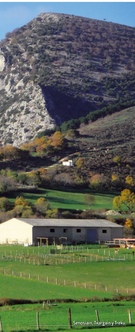
Senosiain, Txargain y Treku.

llevará a la citada borda por una zona tapiada de prados. A la altura de una granja, giraremos a la derecha para continuar por una pista de grava, con la vista puesta en la sierra. Una vez entrados bajo un magnífico bosque con paneles de información, bancos y mesas, estaremos en Basakoetxea, donde se inicia por pista el sendero SL NA-136 "Ruta de los Robles Monumentales". Ignorando los desvíos que sugieren itinerarios circulares, seguiremos ganando suavemente altura hasta que la pista se difumina en un rellano. Pronto saldremos del hayedo, momento que iniciaremos definitivamente la subida, ahora por fuerte pendiente. En este