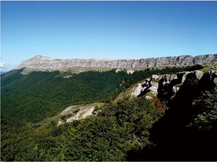
Altos de Pagomotxeta.

sierra, bajo el dosel de un magnífico hayedo, que apenas permite contemplar los airosos farallones rocosos de Lezizagoa. Sin dejar de ganar altura, saldremos del bosque, dando vista al cordal cimero del Alto de las Bordas Viejas que encierra la cabecera del barranco de Leziza. Una vez pasado un portillo, la pista de Unanu nos dará paso a la proveniente del alto del puerto de Lizarraga, donde giraremos a la izquierda. Tras subir entre una zona de karst se sumarán por la derecha las sendas de Goñi poco después de Senosiain, donde el paisaje se abre especialmente hacia los Pirineos.