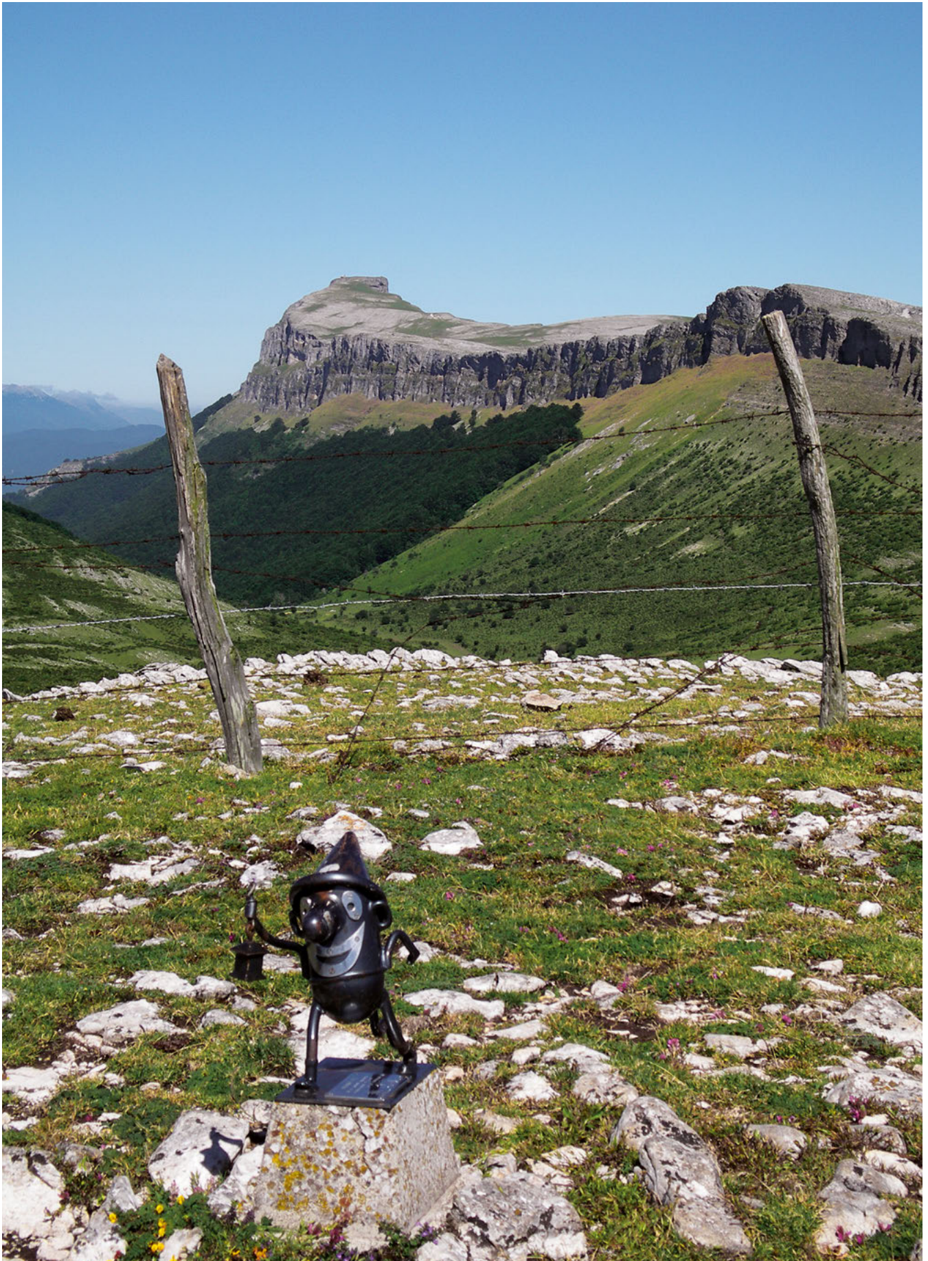
Cumbre del Alto de las Bordas Viejas, farallones de la sierra de Andia.