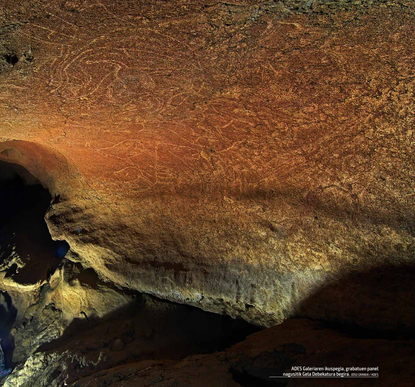
ADES Galeriaren ikuspegia, grabatuen panel nagusitik Gela Debekatura begira.