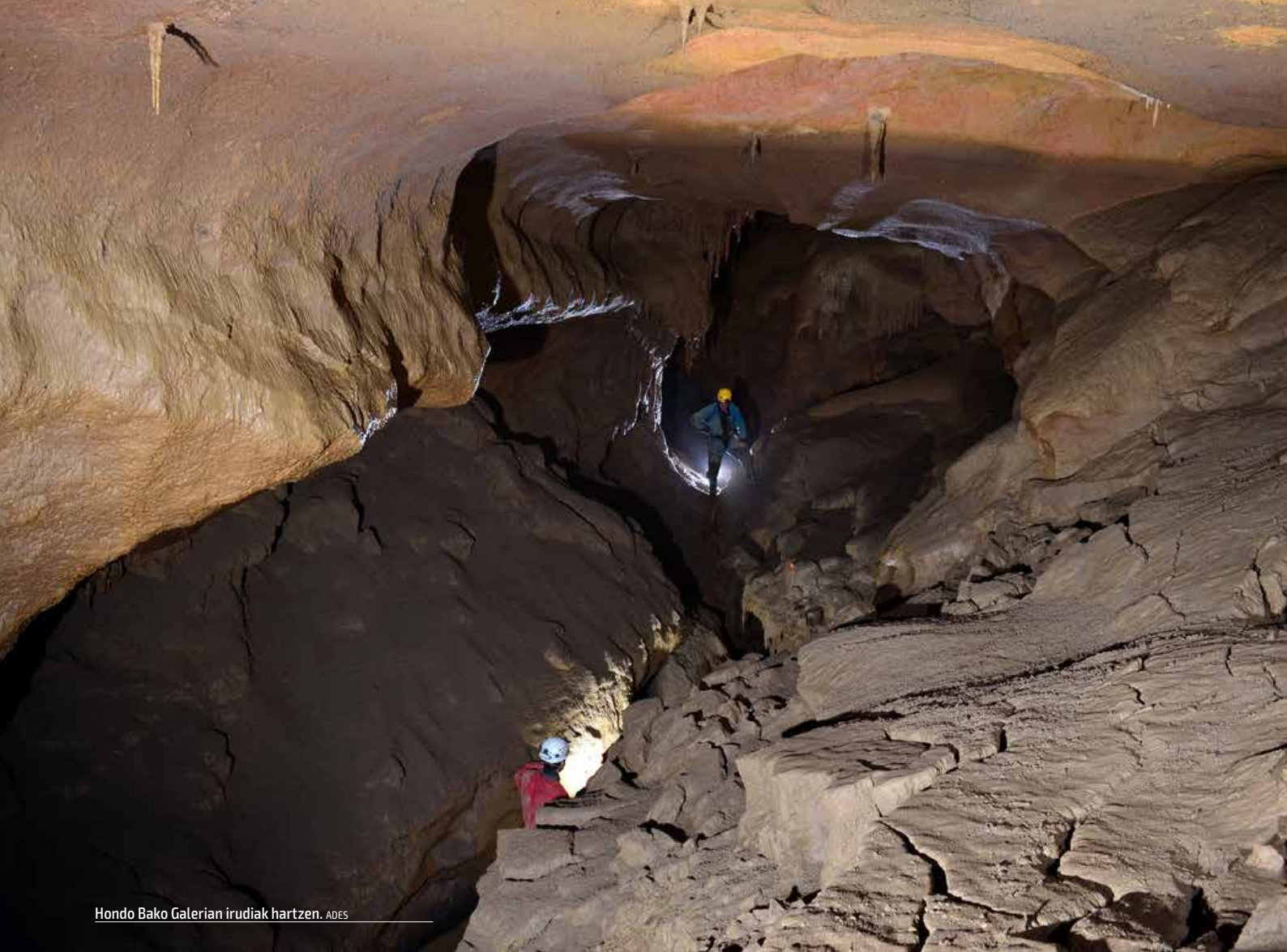
Hondo Bako Galerian irudiak hartzen. ADES

dorioz: kobazulo batean lan arkeologikoak hastea, bertako faunari kalte izugarria eginda edo labar-arte panel bat azken belaunaldiko eskanerrarekin jasotzea, lurzoruko aztarnategia zapalduz eta desitxuraturaz. Profesional izateak, berez, ez baitu lana ondo egitea bermatzen.