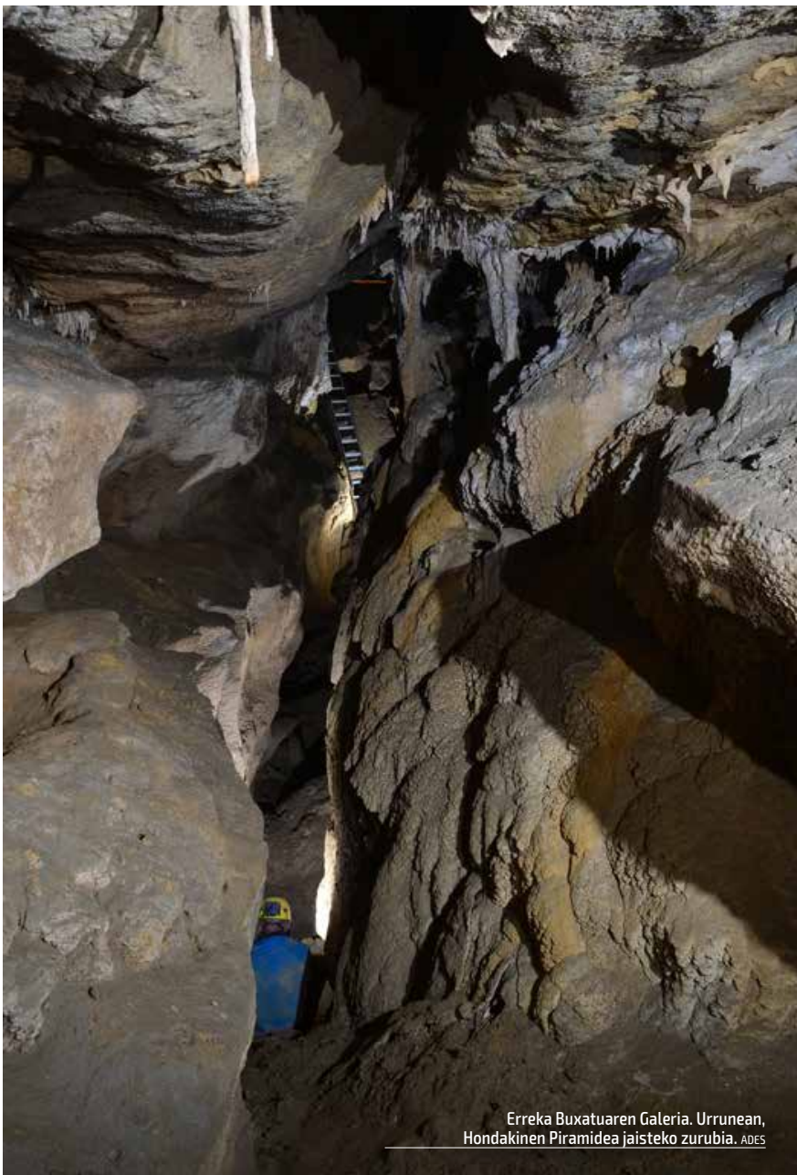
Erreka Buxatuaren Galeria. Urrunean, Hondakinaren Piramideja jaisteko zurubia. ADES

Azken esplorazio saioa irailean egin genuen eta artikulua idazteko unean lanak etenda daude, instituzioekin izandako tirabira batzuek tarteko. Arazoaren funtsean afizionatu eta profesional kontzeptuen gaizki ulertua dago, horrelako aurkikuntzen aurrean, espeleologoon papera gutxiesteko joera dago, gure profesionaltasun faltaren aitzakia. Baina kontuan har dezagun karstaren diziplina guztiak biltzen dituen profesionalik ez dagoela. Espezialistek, definizioz, arlo bakarra menperatu ohi dute, karsta ikertzen duten beste diziplinetan ez dira oso trebeak izaten. Egoera tamalgarriak ere ezagutu ditugu honen on-