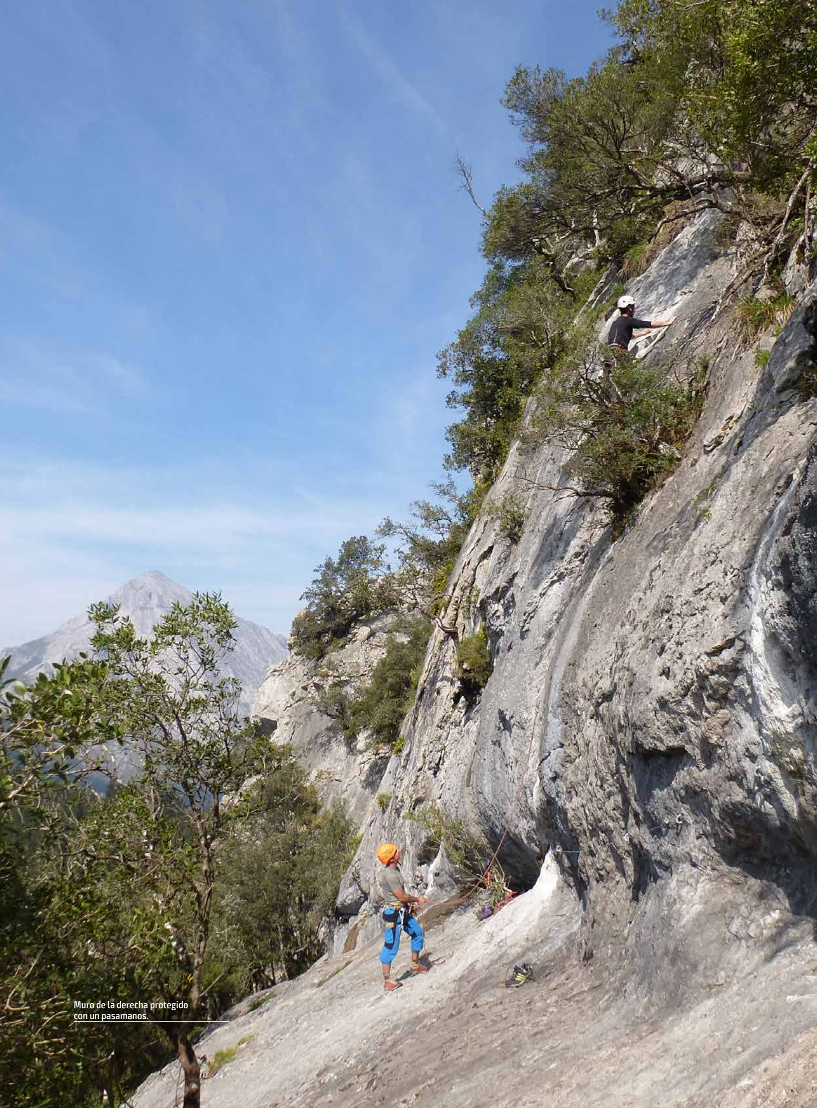
Muro de la derecha protegido con un pasamanos.