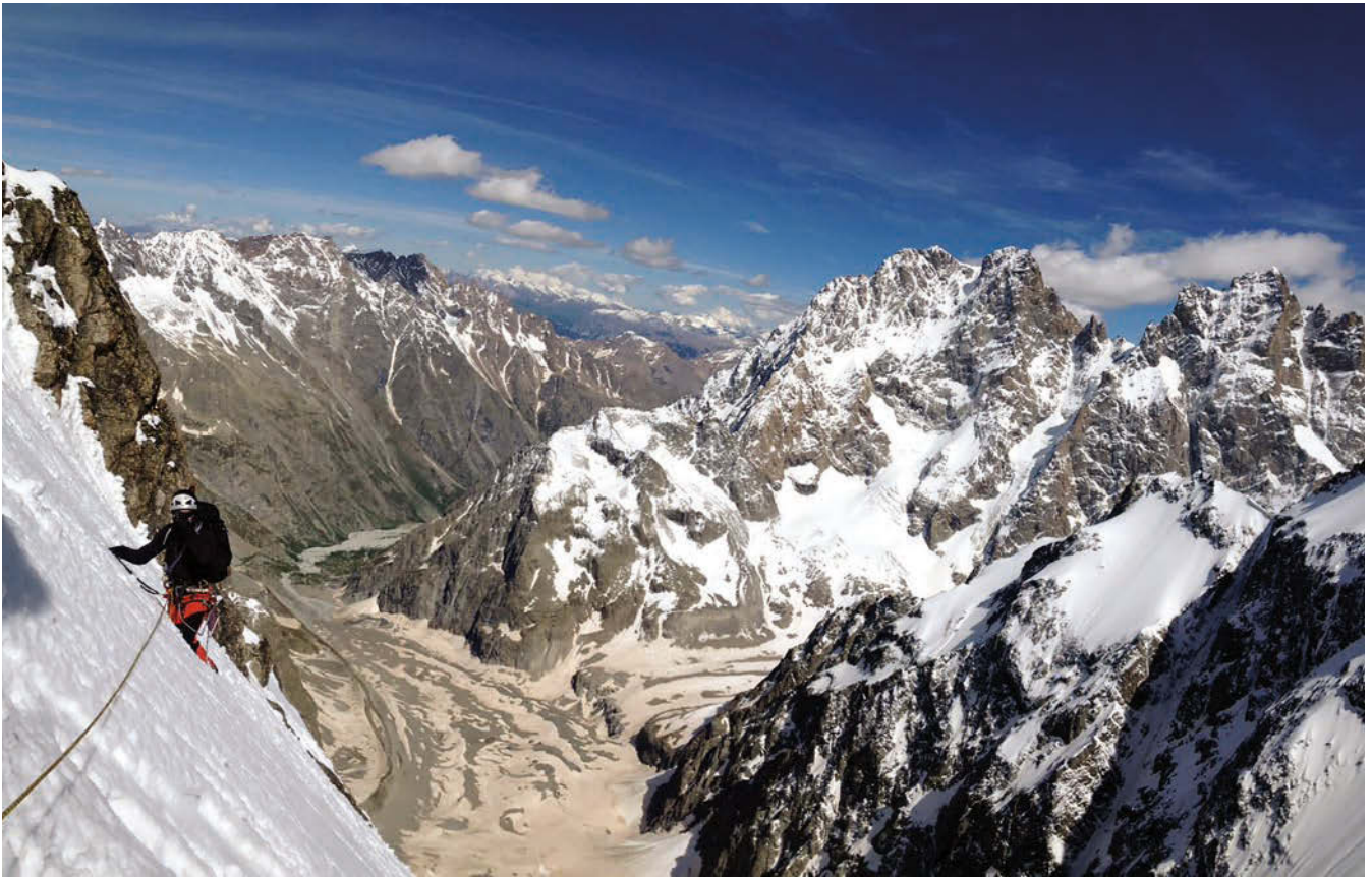
Barre des Ecrins mendiko hegoaldeko hormak gure trebetasunak neurtzen.

Maiatzean zehar partehartzailiek beraien proiektuak burutzen dituzte eta ekainaren 19an Alpeetara abiatuko gara. Aurrekontu justu samar batek baldintzatuta, ikusmira Ecrin seko parke naturalean jarri dugu, gure oinarrizko kanpalekua camping batean izango dugu eta hainbat gau mendizale guztioi ezaguna egiten zaigun izar gehien dituen logelan: bibaka.