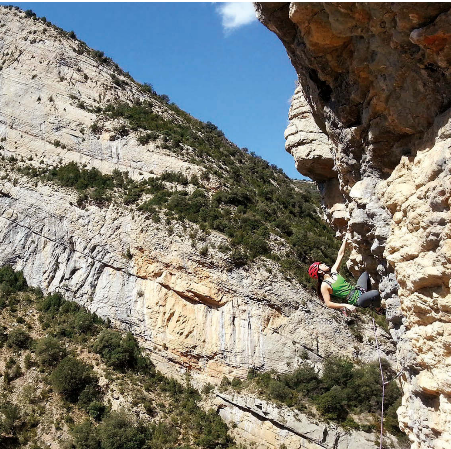
Kirol eskalada, eremu teknikoetan aritzeko ezinbesteko osagaia.

arrakastatsuak sortzea, horregatik baita ere arreta ipintzen dugu taldekideek harreman positiboak sortzeko duten erraztasunean, eta esan beharra dago talde hau bikain moldatu dela.