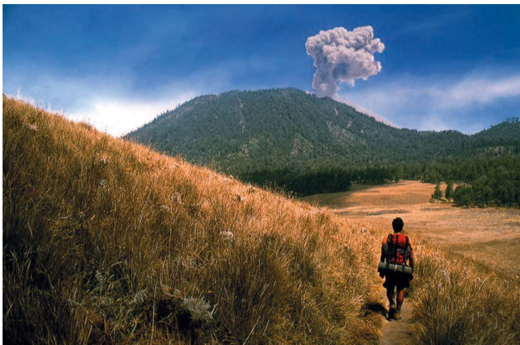
Semeru erraldoia eta batez ere bere 20 minuturo kanporatzen duen ke zutabea ikusgai da ibilbide osoa, Oro – Oro Ombo izeneko leku honetan bezala.

Gailurretik ikuspegia egundokoa da. Itsasoa eta urrutiagoko beste hainbat sumendiren silueta begi-sare umeletan ditugula, hiru egun hauetan egindako ibilbide osoa dakusagu, urrutiko Penanjakanetik hasita. Argi-distira anitz ikus daitezke haren gailurrean, gaur ere milaka turista bildu baitira egunsentiak eskaintzen duen ametszko paisaiatz liluratzera; gaurko turistak horiek ere ez dakite flasha erabiltzea alferrik dela!