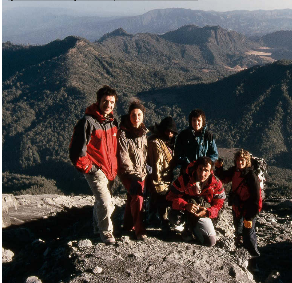
Semeruren Gailurretik ikuspegia egundokoa da. Hiru egun hauetan egindako ibilbide osoa dakusagu, urrutiko Penanjakanetik hasita.

Gailurraren eta egunsentiaren estasia pasatu ondoren, sumendiaren handitasunaz ohartzten hasi gara. Gailurra lautada handi bat da. Gu beronen iparraldeko ertzean gaudete eta kraterra 200 metrora dago hegoalde-