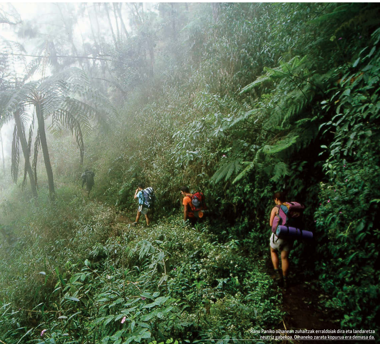
Ranu Paniko oihanean zuhaitzak erraldoiak dira eta landareta neurritz gabekoa. Oihaneko zarata kopurua era demasa da.

265 eskailera eraiki dira kraterraren ertzearaino. Hori da egin ohi duten ahalegin osoa, kraterraren oinarriaraino jeep-ez edo zaldiz etortzen baitira. Galdara zaharraren errautsak eta hondarra zapaltzen dituzten bakarrak gu gara. Benetan astronautak ematen dugu.