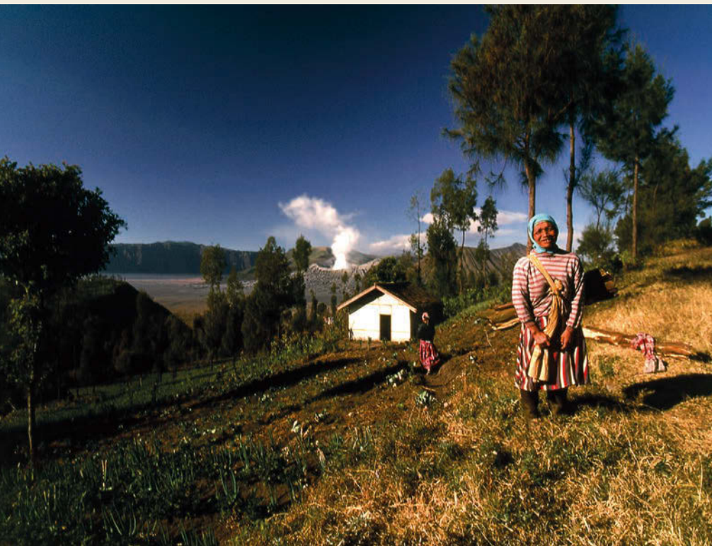
Tengger biztanleak hinduistak dira eta gehienak nekazariak, lur bolkanikoa oso emankorra baita.

XV. mendean Islama Javaren ekialderantz zabaldu zenean, uharteko apaiz, errege eta aristokrata hinduistek Balira ihes egin zuten, bere kultura, sinesmen eta erlijioarekin batera. Aldiz, nekazari eta jende xumeak Java uhartearen ekialdeko Tengger mendietako Gunung Semeru eta Gunung Bromo sumendien orroan eta erupzioetan aurkitu zuen babesa. Islamiarren eta indar geologikoen presioa izan arren, tenggertarrek beren hizkera, ohitura eta sinesmenei eusten diete oraindik, Buda Mahayana izeneko hinduismo-animismo nahaste berezia praktikatuz eta lur bolkaniko emankorrak landuz. Tenggertarren lurralde menditsuak Bromo-Tengger-Semeru Parke Nazionala osatzen du gaur egun, bertako hiru sumendi nagusien ohoretan. Paisaia paregabea, munduan bakana: Bromo sumendiari (2329 m) 16 km-ko galdara erraldoi eta antzuaren baitan, kea dario etengabe. Semeru (3676 m) Javako sumendirik garaiena eta aktiboenetakoa da. Penanjakan (2770 m) sumendi ohiaren gailurretik paisaia bolkaniko honen ikuspegi miresgarriaz goza daiteke.