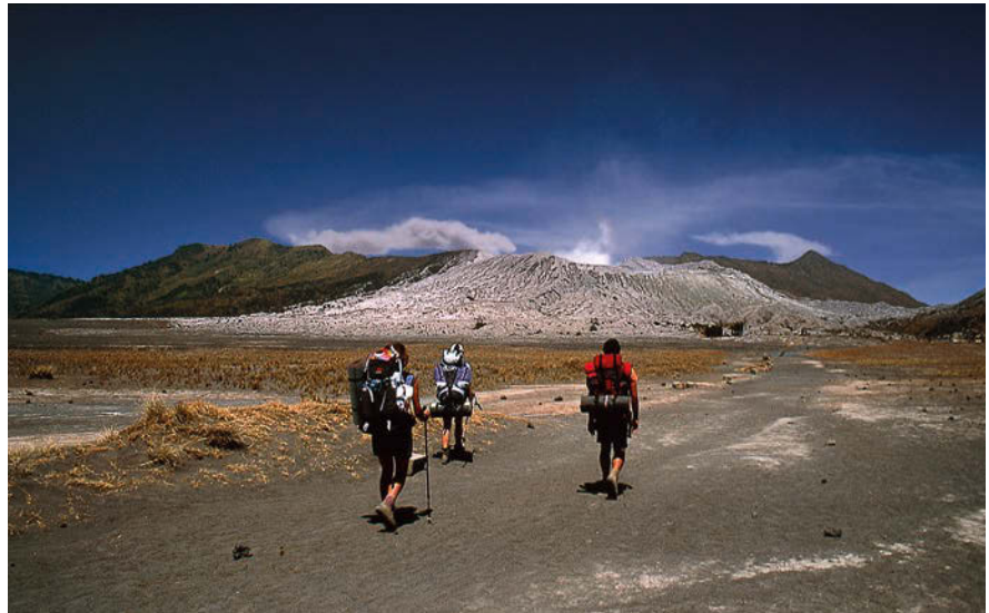
16 km-ko erradioa duen Tengger galdara zeharkatu behar da Bromora heltzeko. Ingurunea zeharo hunkigarria da, batez ere kraterraren itxura antzuagatik.

gai direlarik. Patata, aza eta tipulak dira barazki arruntak. Baina gaur egun turismoak gero eta indar gehiago du, beraien lurraldearen edertasuna lau-haizetara zabaldu baita.