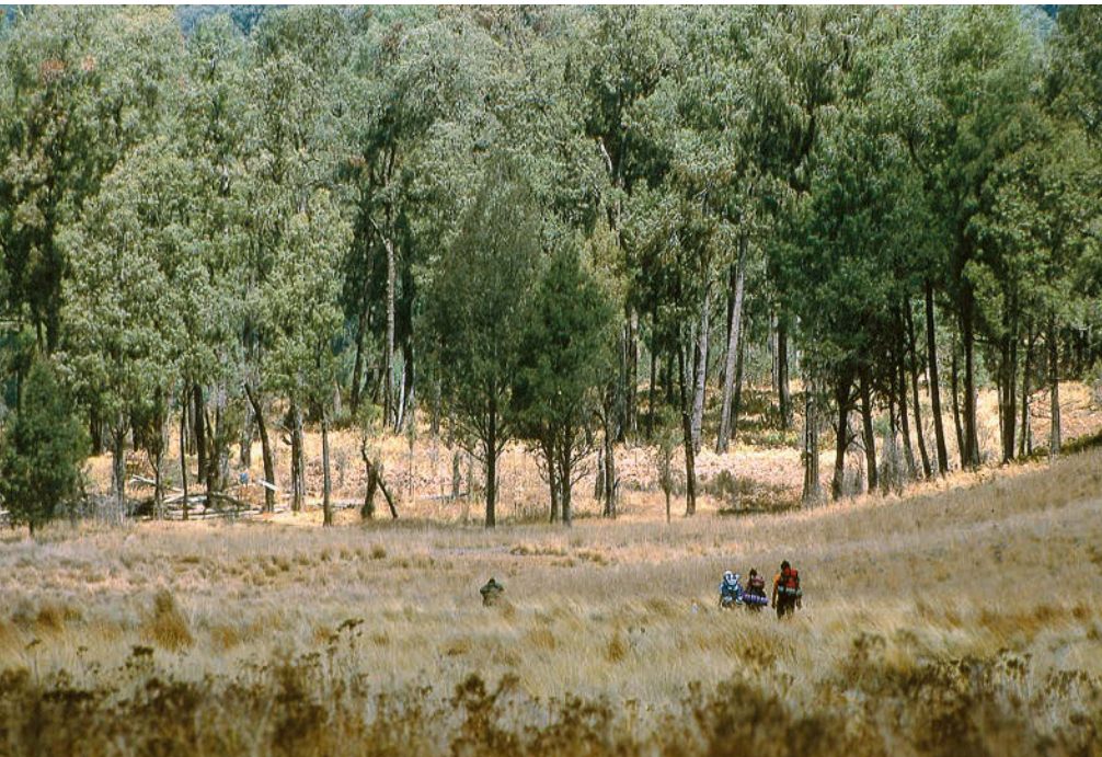
Cemoro Kandang izeneko baso honetan, pinurik ez dago, casuarina izeneko bertako zuhaitz koniferoa baizik.

bolkanikora jaitsi behar dugu (2000 m) eta ondoren, haren kraterraren hegoaldeko ertzera igo (2450 m). Baina ez dakigu nondik jaitsi, bidezidorrik ez baitugu aurkitzen. Belenek aurrea hartu du eta landaretza erraldoi eta arantza artean bere atzetik joan gara besteok kexaka. Bertan dagoela dirudi, baina ia ordubete pa-