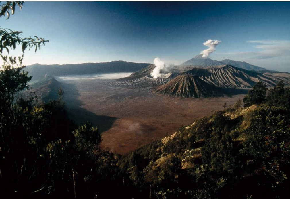
Tengger galdararen barruko sumendien eta baita Semeruren ikuspegia Penanjakan gailurretik.