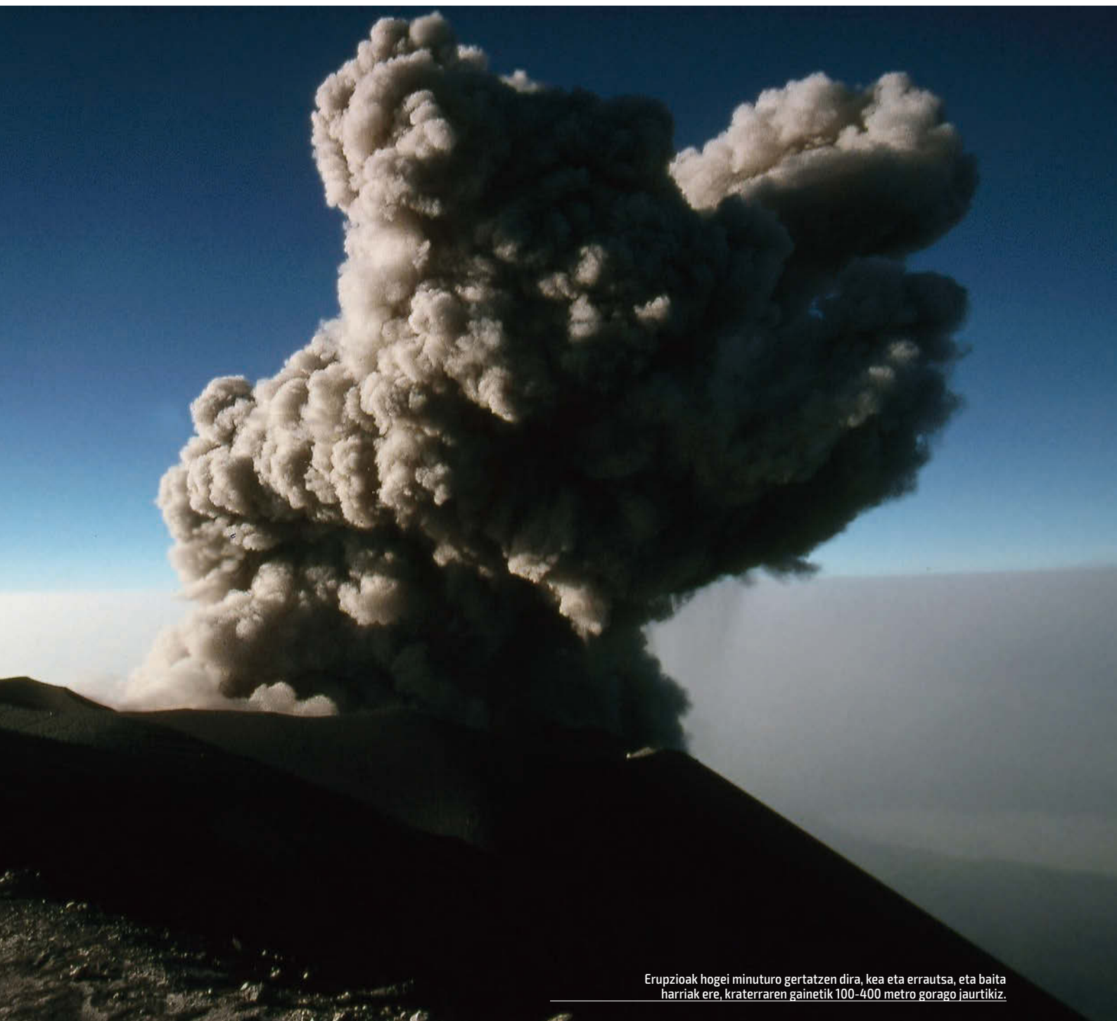
Erupzioak hogeit hamar minuturo gertatzen dira, kea eta errautsa, eta baita harriak ere, kraterraren gainetik 100-400 metro gorago jaurtikiz.

Egun argiz hasi dugun arren (8:30), behe-lainoak herri osoa estaltzen du. Lakuaren ondotik pasatu eta Lumajang herrira jaisten den errepidean egin dugu lehendabiziko kilometroa baratzean ondotik, parke nazionalaren kontrol guneraino. Semeru igotzeagatik zerga ordaindu behar izan dugu bertan (15$ - 2015); pasaportearen fotokopia ere eskatu digute; osasun agiria ere erakutsi behar omen da, aldiz, ez digute horrelakorik eskatu; eskerrak. Errepi-