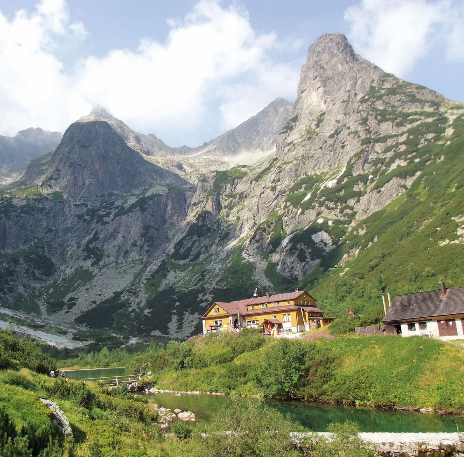
Refugio del lago Zelenom.

de madera, que dada la escasez de agua, a veces parecen innecesarias. Pronto empieza a complicarse un poco más el camino y nos topamos con una escalera metálica junto a una pequeña cascada. Vamos avanzando con ayuda de cadenas y elementos de madera o metálicos. A medida que las escaleras van siendo más altas también aumenta la concentración de personas en espera de su turno para subir. Mientras aguardamos seguimos sorprendiéndonos al encontrar familias con niños pequeños en pasos algo delicados.