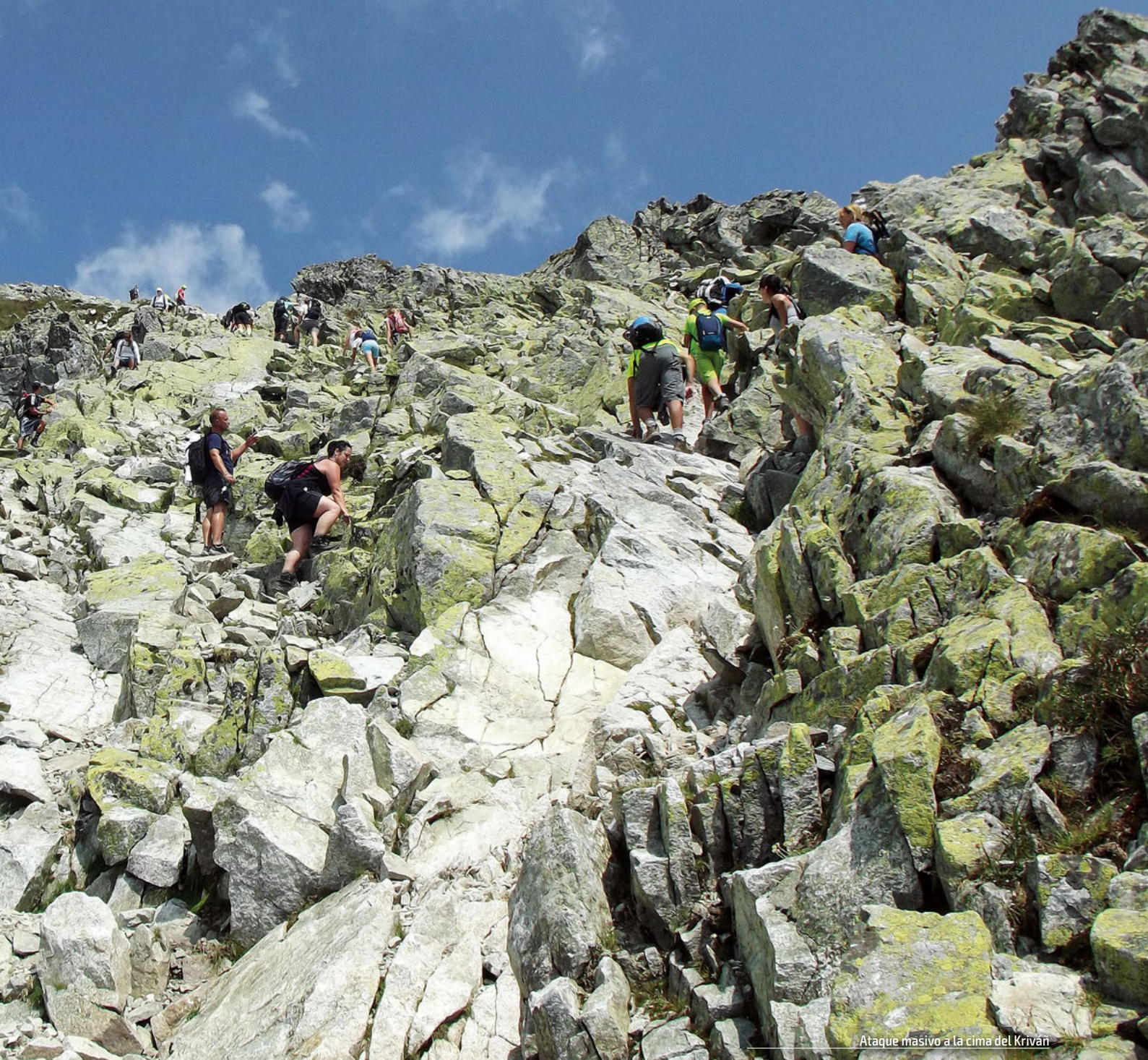
Ataque masivo a la cima del Kriván

un poste de señalización que indica la cercanía del Lago Jamske, al que hacemos una visita antes de empezar la ascensión. A la derecha del poste parte el camino que cruza el valle Vazecka y serpentea por la arista sur del macizo del Kriván. A partir de este punto, ya es una continua subida por bosque y zonas de matorral bajo.