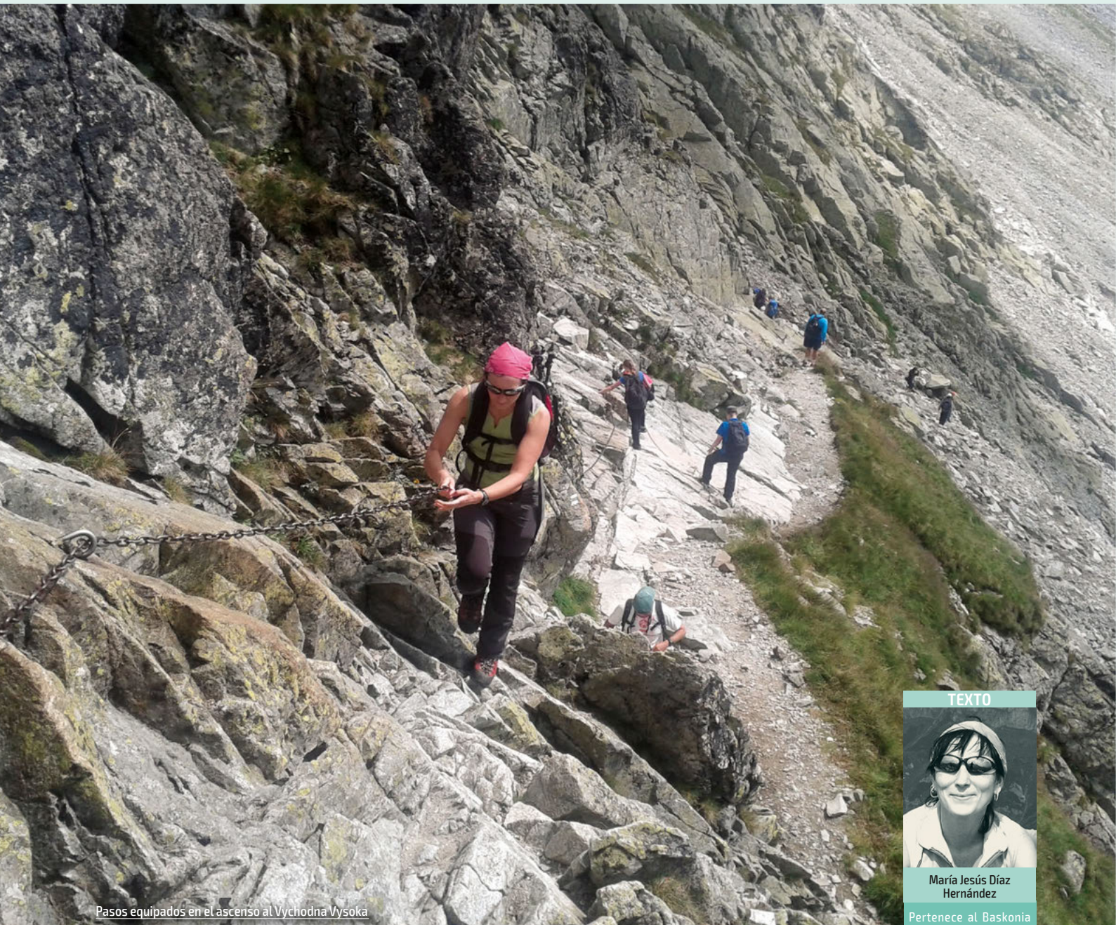
Pasos equipados en el ascenso al Vychodna Vysoka

Los montes Tatras conforman la parte más alta y occidental de la cordillera de los Cárpatos y ocupan una superficie de alrededor de 800 m 2 , de los cuales el 70% pertenece a Eslovaquia y el restante 30% a Polonia. El mayor atractivo turístico es la concentración de grandes bellezas naturales en una pequeña área, así como la mayor atracción montañera es la gran cantidad de picos asequibles, entre los que destacan unos 30 de más de 2500 m y gran número de cimas de menor altitud pero no por ello de inferior atractivo.