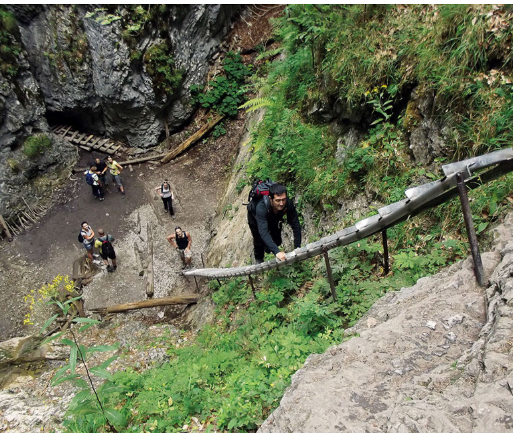
Esperando turno en Slovenský Raj

Alcanzamos el parking de la entrada al valle Biela Voda, ubicado a unos 4 km al este de Tatranska Lomnica, donde los autobuses de línea descargan su pasaje de montañeros. A este popular paraje acceden muchas personas desde la parte polaca ya que se encuentra a unos 40 minutos de la frontera. Desde el parking se sigue una pista amplia y cómoda a través de un bosque que discurre paralelo a un riachuelo y desemboca en Chata pri Zelenom plese (1551 m), un refugio de montaña situado en un circo muy similar al de Gavarnie pero que cuenta con un lago que le imprime una belleza particular.