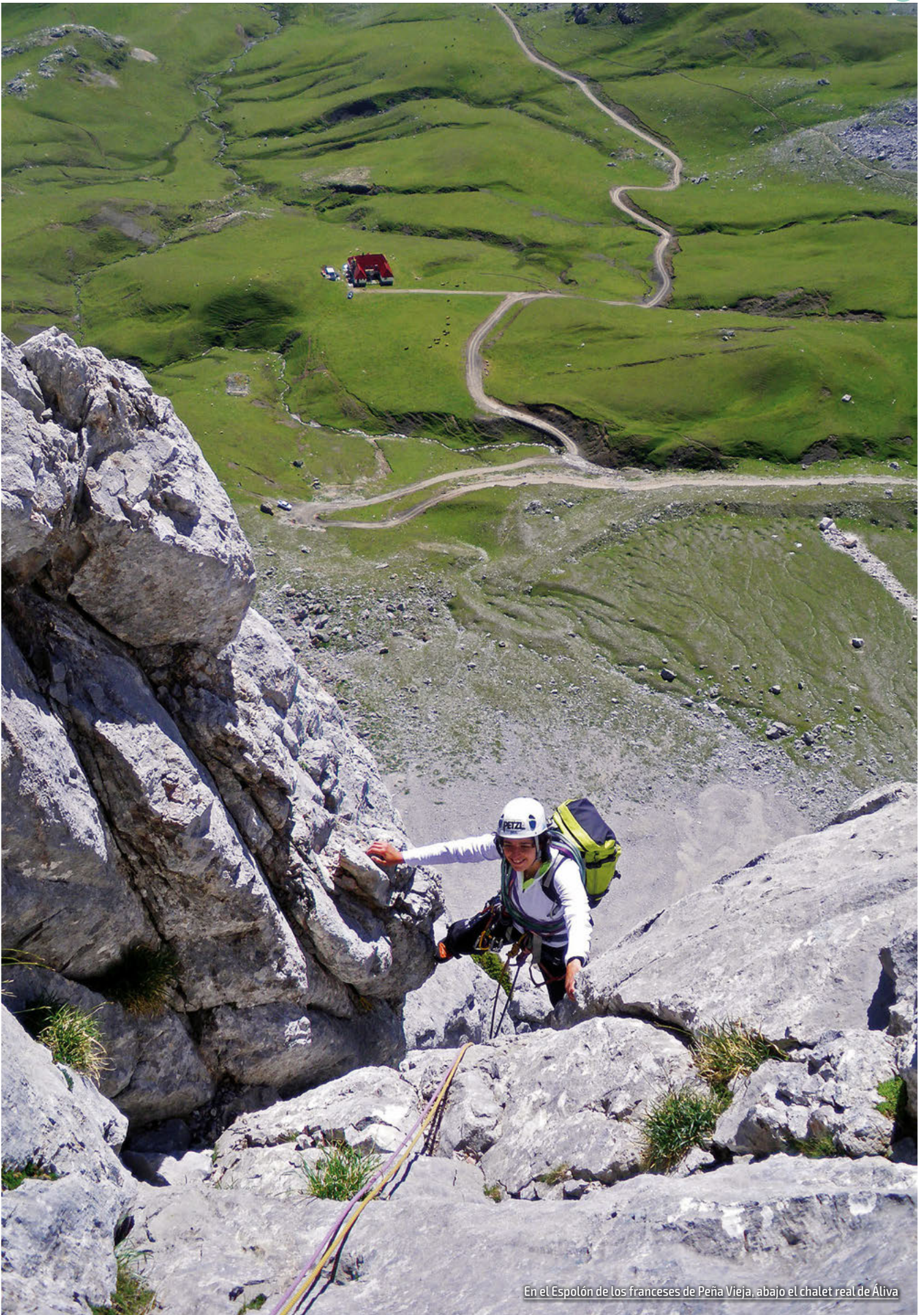
En el Espolón de los franceses de Peña Vieja, abajo el chalet real de Áliva