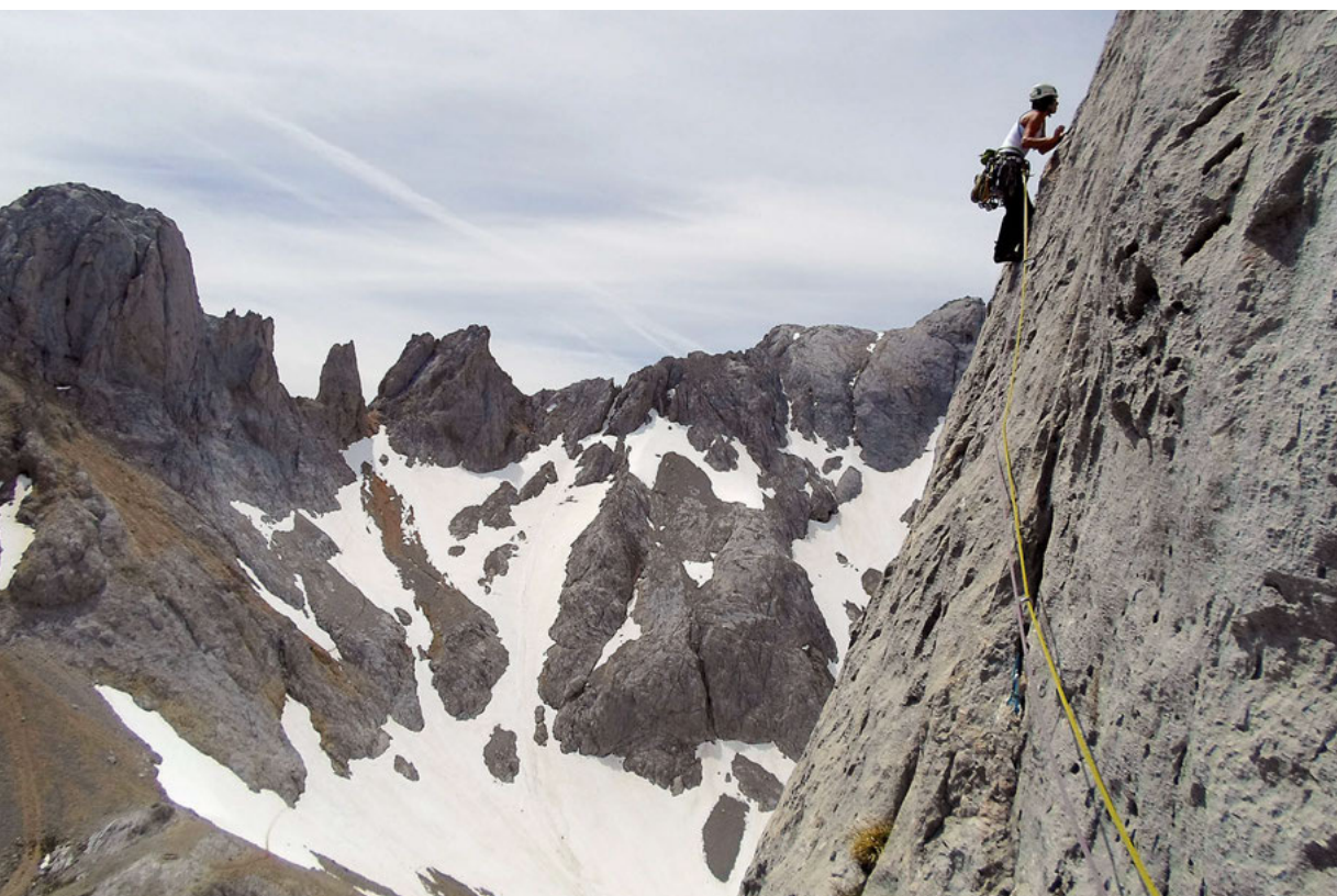
En la travesía del quinto largo de la Martínez-Somoano.

El accidentado y escarpado relieve de Picos da lugar a que las rutas sean austeras y de fuertes desniveles, pero para los escaladores este es el paraíso de la roca caliza y según te adentras en el macizo no puedes dejar de admirar la cantidad de paredes que tienes a tu alrededor. Os propongo cinco vías de escalada: cuatro en el Macizo Central o de los Urrieles y una en el Macizo Oriental o de Ándara; se trata de vías en las que apenas hay equipamiento instalado.