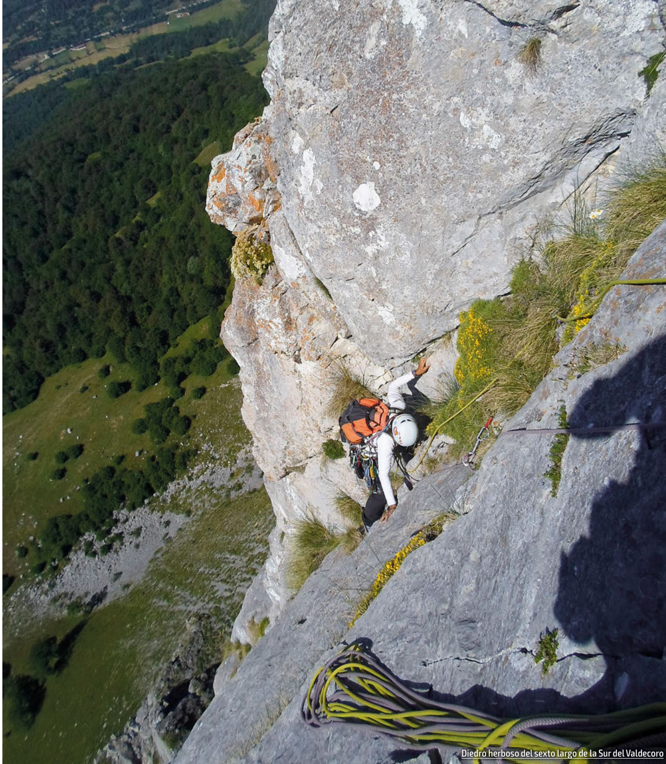
Diedro herboso del sexto largo de la Sur del Valdecoro