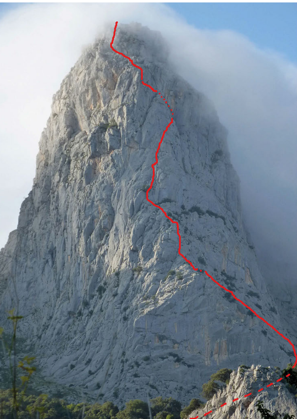
Cueto Agero. Vía del Espolón Sur.

QUINTO LARGO. Salimos escalando por una bavaresa de V, hacia la derecha, desequipada pero fácil de proteger, hasta encontramos con un muro y un clavo. Un poco más arriba del clavo encontramos otro que protege un pequeño desplome de 6a/6a+, roca algo pulida en ese paso. Montamos la reunión en una repisa con un clavo, un puente de roca y un friend .