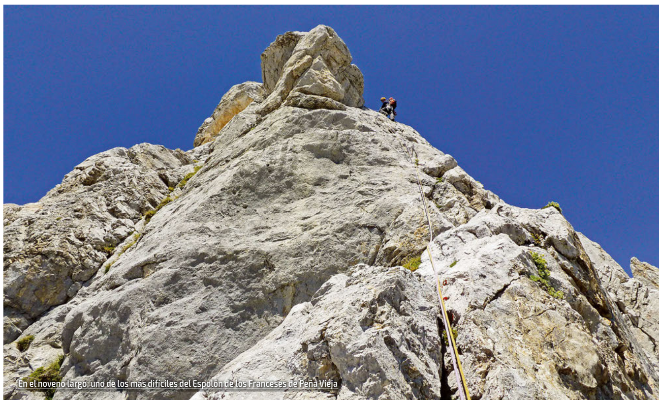
En el noveno largo, uno de los más difíciles del Espolón de los Franceses de Peña Vieja

En la repisa que forma el dado encontramos un clavo, reunión a reforzar