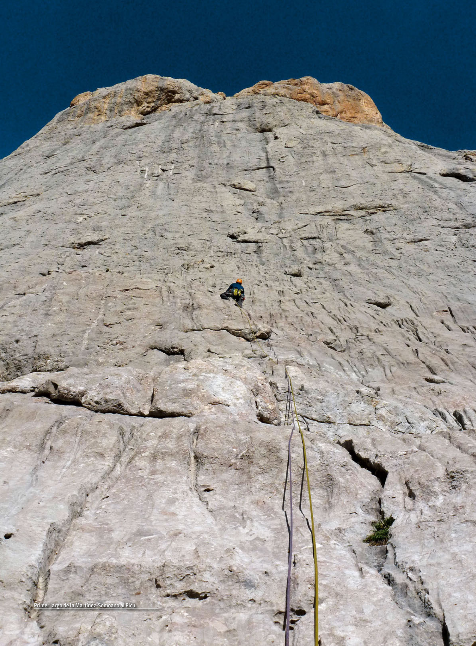
Primer largo de la Martínez-Somoano al Picu.