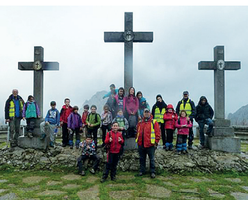
Eskola Kirola. Ollargan

Próximos a terminar la campaña de montaña 2015-2016 de Deporte Escolar, damos las gracias a los más de 1000 escolares de los 25 centros que han tomado parte en ella. Así mismo, nuestro más sincero agradecimiento a los padres por la confianza depositada y a los monitores de los clubes Iturribero Mendi Taldea de Vitoria-Gasteiz, Goikogane de Laudio y Mendiko Lagunak de Amurrio, por el trabajo desarrollado para sacar adelante las 43 salidas y los tres cursillos. Nos vemos en septiembre.