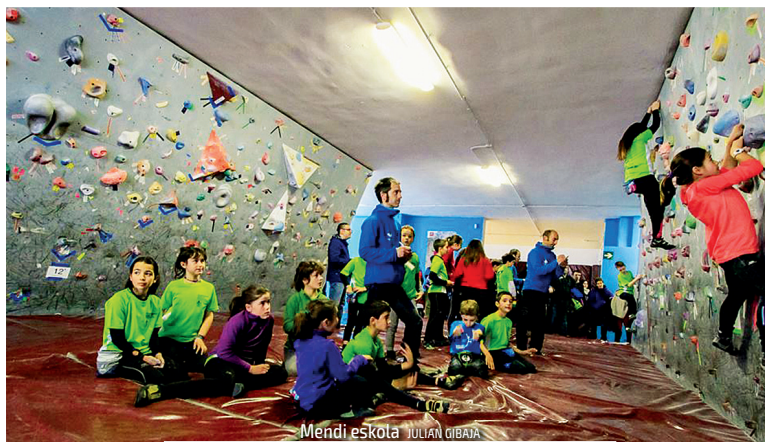
Mendi eskola JULIAN GIBAIA

El pasado 17 de marzo se celebró la asamblea ordinaria con la participación inicial de 26 clubes, 4 deportistas y un técnico. Tras la aprobación del acta anterior, tuvo lugar la presentación y votación favorable unánime del cierre contable del 2015 y del presupuesto del 2016 así como de las actividades para el 2016. De igual manera se aprobó el Reglamento de altas y bajas de clubes. Finalmente se informó sobre la Eskola, el próximo proceso electoral y se dio paso a ruegos y preguntas.