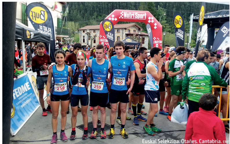
Euskal Selektzioa. Otañes. Cantabria. EMF

Aurtengo Euskal Kopak gogoz hasi dira, baina momentuz, bakarrik lehenengo proba ospatu da Muskizen, Mello Saria hain zuzen ere. Beraz, oraindik ospatzeko dauden lasterketak hauek dira: