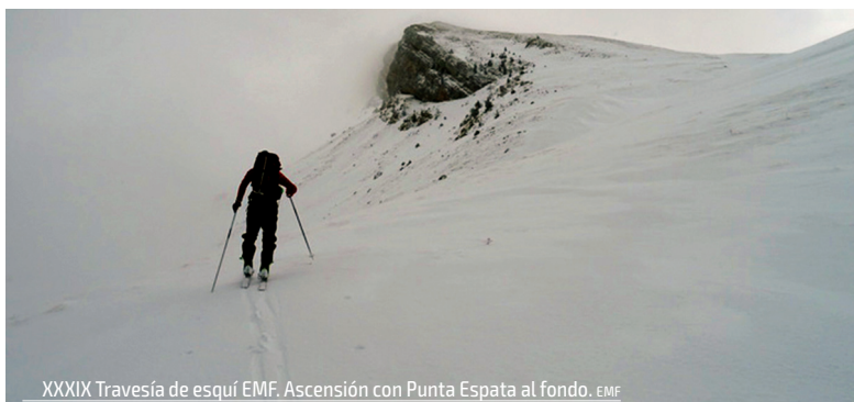
XXXIX Travesía de esquí EMF. Ascensión con Punta Espata al fondo. EMF