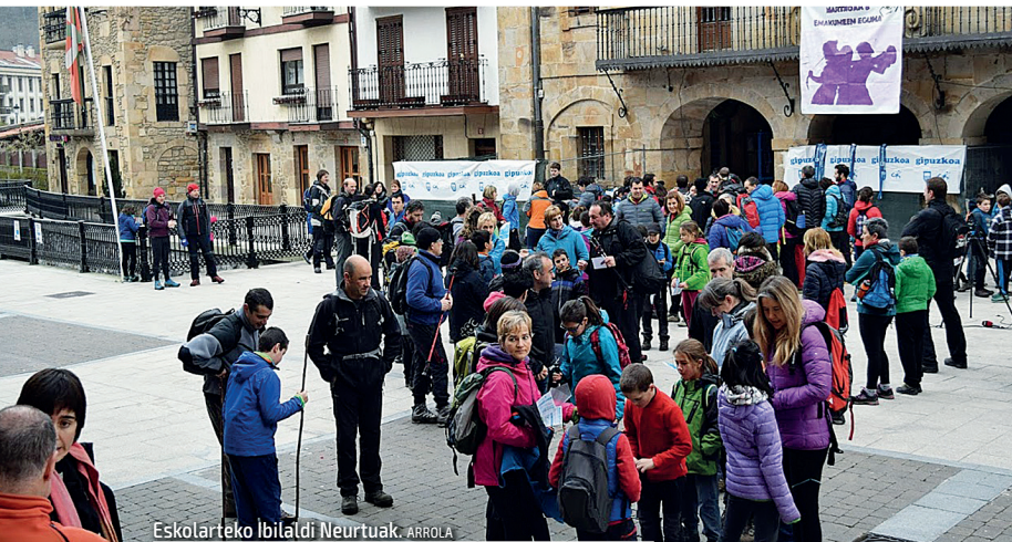
Eskolarteko Ibilaldi Neurtuak. ARROLA

INFORMAZIO OSOA Gipuzkoako Mendizale Federazioaren web gunean dago edonoren esku: www.gmf-fgm.org