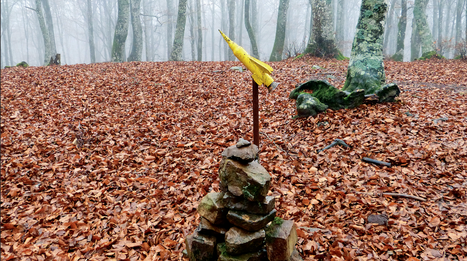
Mendebaldeko Burbonaren postontzia.

albo batera utzi eta berehala helduko gara Gorbeia Parketxera. Aparkalekua ia erabat gurutzaturik, hego-muturrean gaudela, xenda estu bat sumatuko dugu, erreka aldera doana, eta burdinazko zubi urdinera eramango gaitu. Errekaz bestalde gaudela, ekarritako norabideari eutsiko diogu, Senda Vital izeneko bidean. Kilometro pare bat egin, eta Zubi Zuriaren ondoko aparkalekura iritsiko gara, Sarrian.