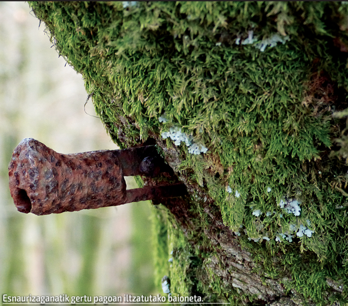
Esnaurizaganatik gertu pagoa iltzatutako baloneta.

Eta horiei guztiei lagundu zietenak, erreserbakoak: UGTko miliziano eskuzabalak, MAOCeko Larrañagako gerlari latzak, Sacco eta Vanzettiko anarkista gorriak, Gordexola eta Padurako gudari finak eta Rosa Luxemburgoko komunistak gogorak.