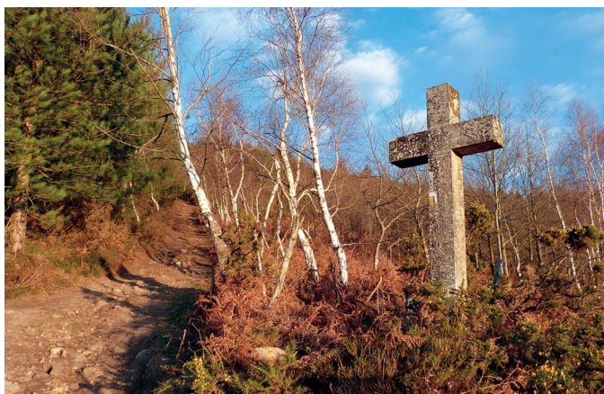
Suskitzako Via crucisa.