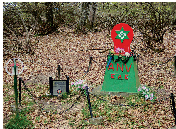
Albertiako ANVko monumentua.

horrela ustiatzen. Siskiñu gainera igo, eta, lubakiez gain, beste talaia pribilegiatu bat aurkituko dugu. Gertuko zulo batean harri zizelatua dago, gerra-garaien lekuko, Batallón Disciplinario-k sinatutako harria. Bide nagusitik atera, eta, ezkerretara, Harri-kurutzera hurbilduko gara. Joan-etorri laburra izango da, sar-