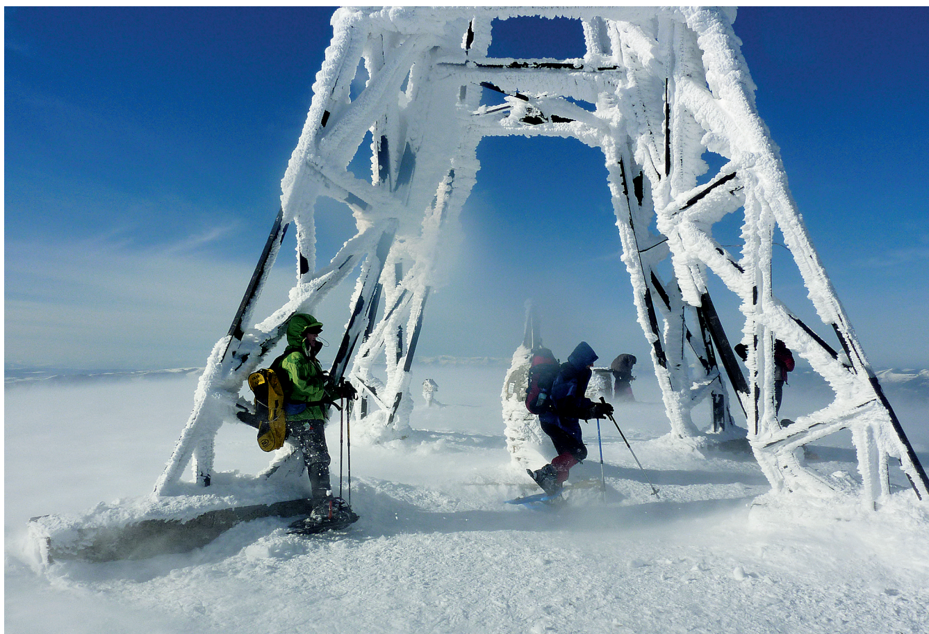
La Cruz, azotada por el viento.

En 1,5 km (27 min) llegaremos a la cueva y surgencia de Artzegi. Aquí merece la pena pararse a disfrutar del sonido del agua, de las piedras tapizadas de musgo y de la curiosa brecha abierta en la roca.