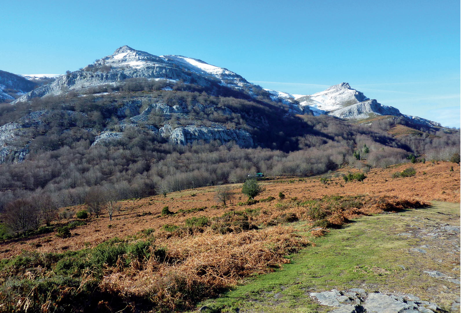
Espolón de Iginiger, al fondo Aldamin.