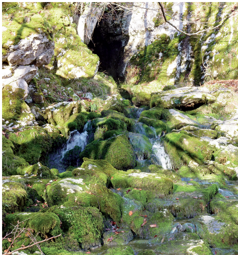
Surgencia de Artzegi.

● Partimos del centro de interpretación que se encuentra a 2 km al norte de Sarria, donde hay un amplio parking. Siguiendo la indicación "Senda Altube Lekandai", tomamos dirección oeste y nos internamos en el bosque por una marcada senda. Tras caminar 600 metros, cogemos el ramal de la derecha señalado con hitos (N). Después la senda gira de nuevo a oeste y, a los 25 minutos, llegamos a una bifurcación y tomamos el camino de la derecha (N). Enseguida llegaremos a un nuevo cruce en el que un poste indicador señala "el sendero de Altube". Estamos en el collado de Ledankai, muy cerca del Txintxularra que nos vigila desde el sur, pero nosotros vamos en dirección contraria. Abandonamos la pista momentáneamente para ganar la cumbre del Kamurazabal (844 m), señalizada con un hito, que dista de nosotros apenas 200 metros.