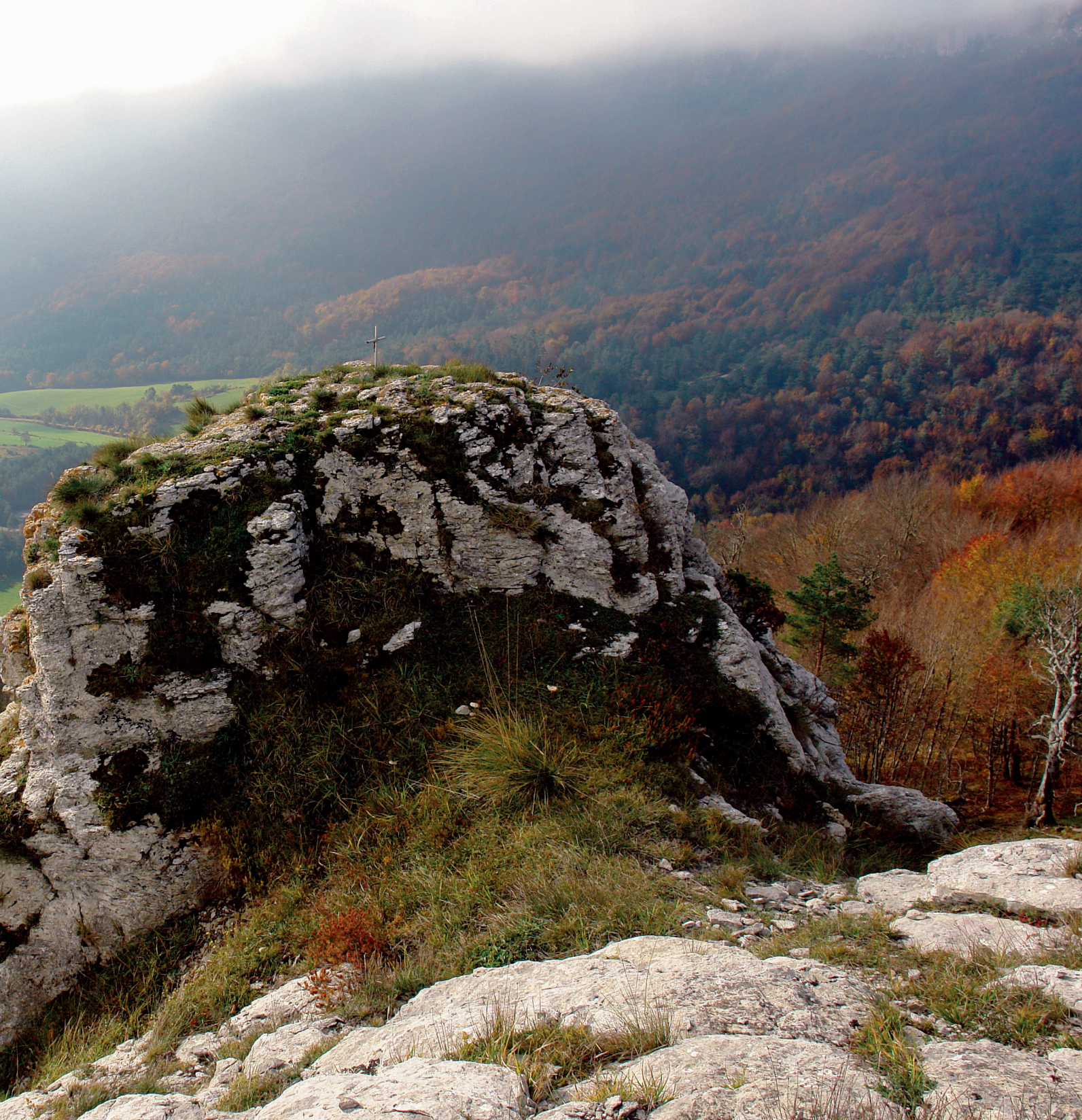
Cruz en Punta Oriental de Peñas Coloradas

za la pista. Pasamos bajo la línea del tendido eléctrico, que se extiende de norte a sur, y caminamos otros 370 metros, manteniendo el apreciable desnivel, antes de llegar a un cruce ( 8 h 25 min, 718 m, UTM: 30T 496191 E 4747339 N ).