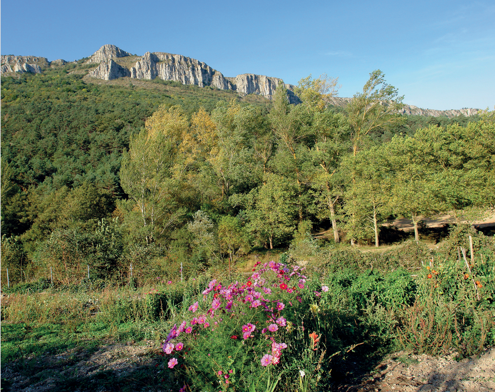
Los Picotes y Alto de la Cruz desde Aprikano

Al otro lado del cañón, la sierra brava de Badaia muestra un formidable aspecto, con sus verticales farallones emergiendo de un Baias sosegado y apacible, pariente obligado de ferrocarriles, autopistas y aerogeneradores. Proseguimos por el angosto sendero, que a los trescientos metros conecta con una amplia trocha de reciente construcción.