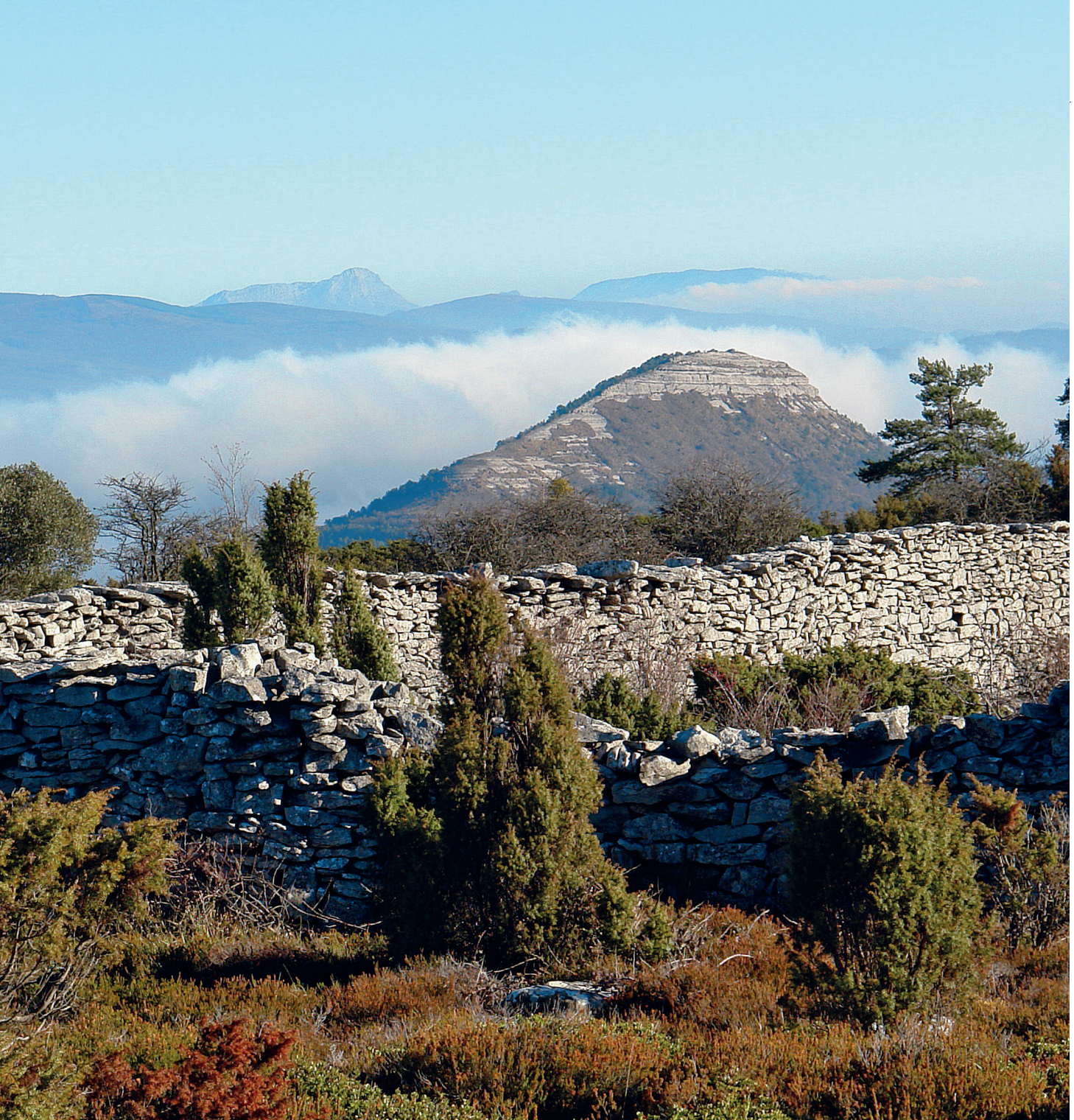
Tras la lobera de Barrón apreciamos Marinda, Gorbea y Anbotu

ce geodésico. Para continuar la ruta vamos a retroceder sobre nuestros pasos. Pero llegado el punto en el que tendríamos que girar a izquierda para ir hacia el cortado por el que hemos venido, iniciaremos el descenso de frente por un marcado camino que lleva en 280 metros a una balsa circular conocida como Pozo Nuevo. Pasamos junto al pozo y a su inmediato pilón, siguiendo el marcado camino, que llega en 470 metros a un cruce.