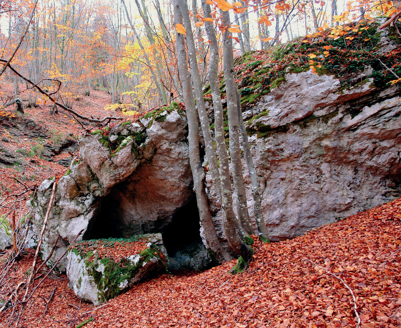
Barranco de Melaria

Con la intención de visitar la curiosa oquedad de Bujero Orau u Ojo de Ruciribai, abandonaremos el camino unos metros antes del pilón para dirigirnos a la derecha hacia el cortado sobre la localidad de Arriano. Llegados al borde, no tardaremos en dar con el citado enclave ( 4 h 47 min, 1133 m, UTM: 30T 499963 E 4748263 N ). Se trata de una oquedad que se abre al vacío, similar a otras en Álava como las de Soila, Ungino o Legunbe, que por su peculiaridad hacen atractiva la visita. Pasada esta, llegamos a la no menos curiosa fisura que separa un gran bloque hasta el punto de poner en duda su estabilidad. Algo más adelante alcanzamos el pico de Asperla (1119 m).