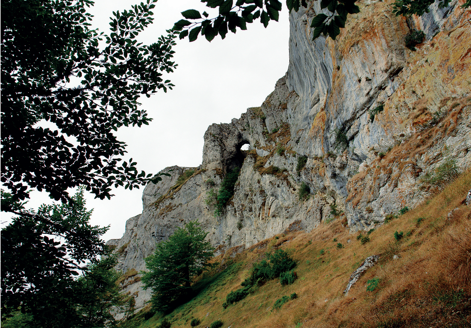
Ojo de Ruciribai o Bujero Orau

Alcanzamos el mojón en cuya placa figura: "M-6 Paraje El Espino Comunidad de Sierra de Arkamo Ormijana" (1 h 34 min, 1006 m, UTM: 30T 506689 E 4744514 N). Iremos siguiendo la línea de cresta, jalonada por los mojones M-5 (Paraje El Espino M.U.P. 8), M-4 (Paraje Los Erinos M.U.P. 9), M-3 (Paraje Los Erinos M.U.P. 642-10). A los cien metros de este último conectamos con el camino que entra en las praderas de Otxate que venimos dejando a nuestra derecha y en donde se encuentra el pozo Edia. Siguiéndolo hacia la izquierda (de frente), llegamos al mojón M-2 (Paraje Los Erinos M.U.P. 642-11). Sin abandonar el rumbo ni el marcado camino, 250 metros más adelante, nos topamos con un murete de piedras que se alarga de norte a sur de la sierra. Allí la pista gira a la izquierda en descenso hacia Ormijana y se encuentra el mojón M-1 (M.U.P. 643-642-10).