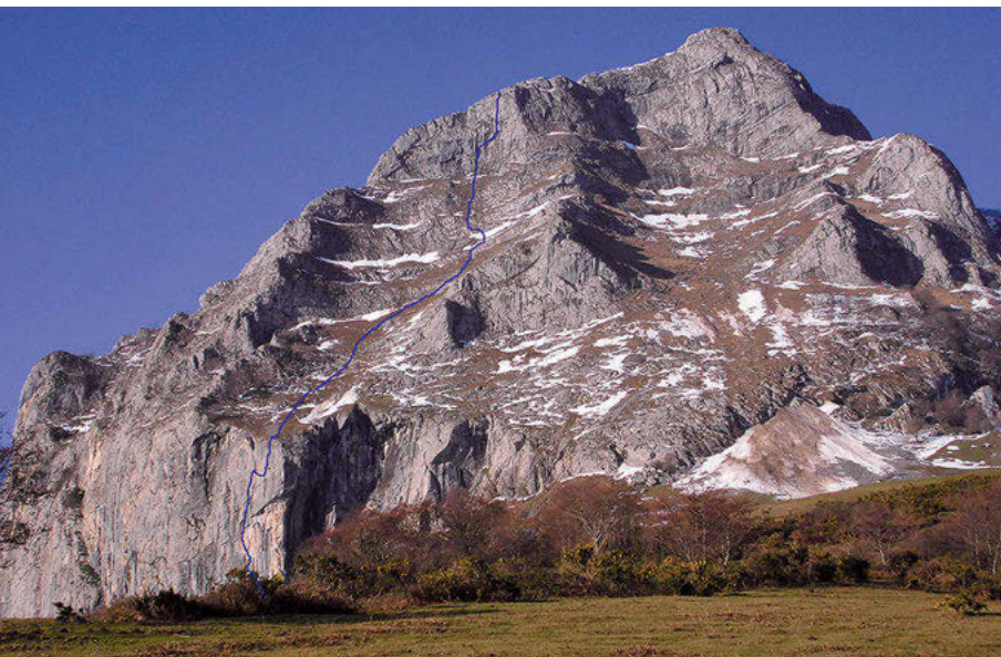
La vía "Txantxangorri" abierta en Balerdi.

Por segundo año consecutivo, el año pasado no se disputó la cita competitiva oficial más importante en categoría senior. Pero, sí, en cambio, la de las diferentes categorías juveniles. La cita fue el 21 de noviembre en el rocódromo Rocópolis de la localidad navarra de Berriobeiti. A la competición organizada por la EMF acudieron 66 escaladores de diferentes txokos de Euskal Herria; 25 chicas y 41 chicos. Hubo muchos representantes de los grupos de escalada del Fortuna de Donostia, del mismo Rocópolis, de Debagoiena, de Gasteiz, de Bilbo... En esta edición fue Debagoiena el que recibió el trofeo por ser el equipo que más competidores presentó al evento.