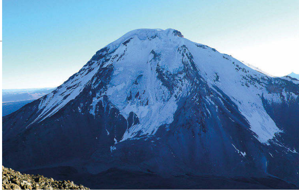
Volcán Pomerape 6.282 m.

16 y 17-07-2014 Los dos días siguientes seguiremos nuestro recorrido en 4x4 cruzando zonas desérticas por encima de los 4000 m, salpicadas por varias lagunas de gran belleza: Laguna Hedionda, Chiarcota, Honda, Colorada, Blanca y Verde. El territorio se extiende hacia el norte de Chile enmarcado por grandes volcanes que superan los 5000 metros y, sin embargo, no hay ni rastro de nieve. El Volcán Ollagüe (5865 m), con una fumarola cerca de la cumbre, o el Volcán Licancabur (5916 m) que enmarca la Laguna