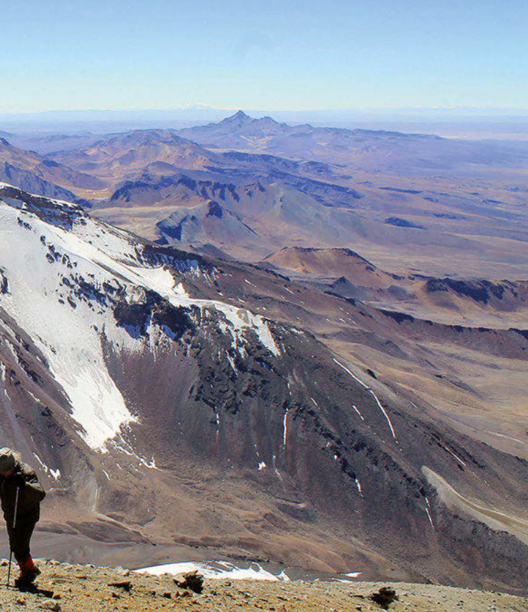
Árbol de Piedra.