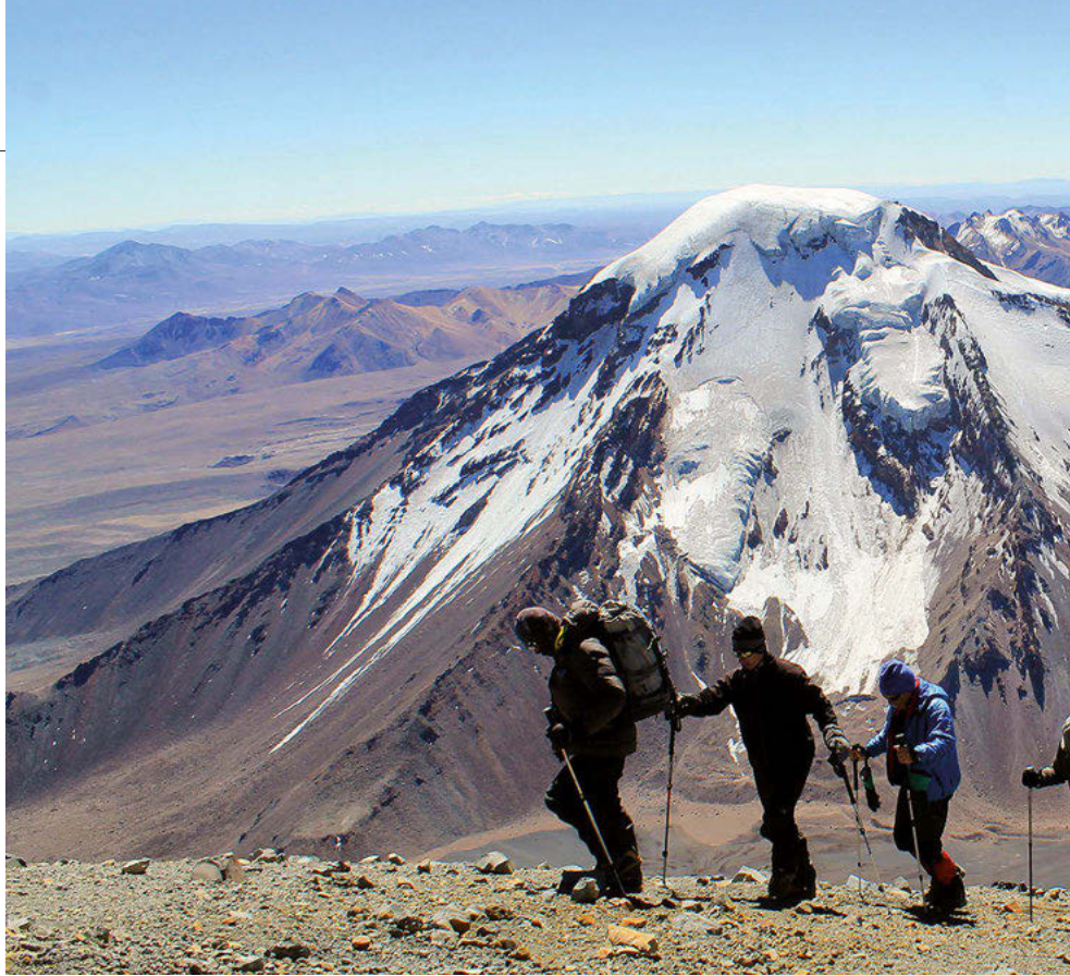
Ascensión al Parinacota

22-07-2014 Amanece un día radiante y frío, desmontamos el campamento y descendemos rodeando el Lago Chiarkhota. Las paradas son inevitables para fotografiar el majestuoso Condoriri que se refleja en el lago con su nueva capa de nieve. En una hora llegamos a la Rinconada, donde ya nos espera la furgoneta que nos llevará de vuelta a La Paz.