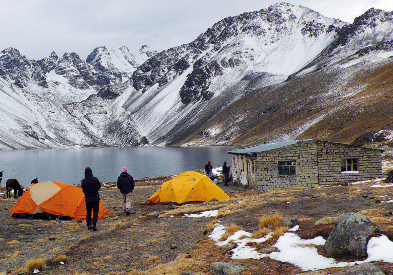
Laguna Jurikhota con el Macizo del Condoriri al fondo, a la derecha el Cerro Austria 5.300 m.

altiplano donde se unen Bolivia y Chile. El tiempo es perfecto, hace sol y no hay viento, por lo que estaremos un buen rato en la cumbre sacando fotos y disfrutando del grandioso panorama que se extiende a nuestros pies.