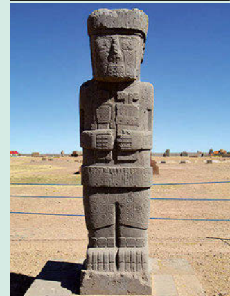
Tiwanaku. Monolito Ponce.

25-07-2014 Nos levantamos a las dos. Los guías han preferido salir más tarde para no llegar todavía de noche a la fina arista de nieve y hielo que da acceso a la cumbre. Además hace viento y el frío es intenso. A las 3:45, salimos los últimos. Ataviados con piolet y crampones, atacamos las primeras rampas duras del glaciar. Por arriba se ven tintinear las luces de las cordadas que nos preceden. A medida que subimos las rachas de viento se vuelven más fuertes, levantando grandes remolinos de nieve en polvo. Continuamos progresando por el glaciar alternando empinados repechos con zonas más tendidas, dando lugar estos cambios de pendiente a siniestras grietas de fondo negro que debemos cruzar, donde acentuamos la seguridad. Llevamos varias horas andando cuando comenzamos a cruzarnos con las primeras cordadas que bajan sin