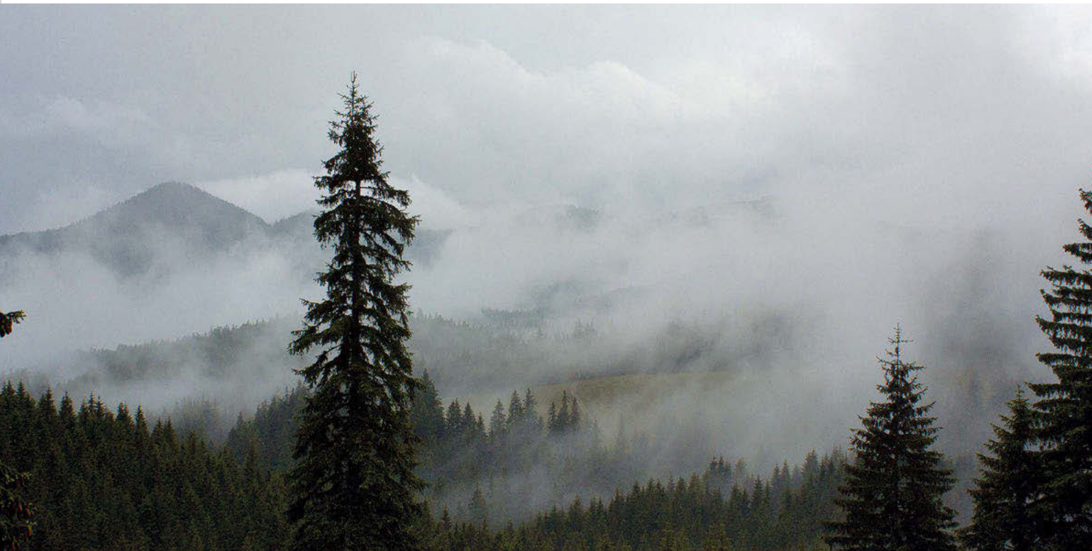
Piatra Craiului parkea

arduradunari agur esanda, Zarnestirantz doan bidezidorrari ekiten diogu. Oraingoan, igotzeko erabili genuen xendra baztertu eta bide berriak eskaintzen digun beste bat hobesten dugu. Hasierako zatia, beti gorantz 200 bat metroko desnibela gainditzen duena, Săua Crepatuni lepotik pasatu eta Turnuraino ailegatzen da. Hiruki gorriez adierazita dago. Puntu honetan, modu bizian egiten dugu beheara aldats pikoan. Aldatsa malkartu samarra denez, tentuz eta astiro ibili behar da. Izan ere, bi kilometro baino ez duen tarte batean 1000 metroko desnibela egiten da. Haranera heltzearekin batera, orain arte karstikoa izan den paisaia goxatu eta berdetu egiten da. Gure begien aurrean Zarnesti bustitzen duen ibaiaren ibilbide zehatza agertzen da, baita Zarnesti hiriaren ikuspegi ederra ere. Azkenean bi orduko ibilbidea lorez, zomorroz eta landarez hornitutako larreen artean egiten dugu, umoretsu eta kalakari. Hirian sartzen gara eta autoa utzitako tokian dagoela ikustean lasaitua hartzen dugu.