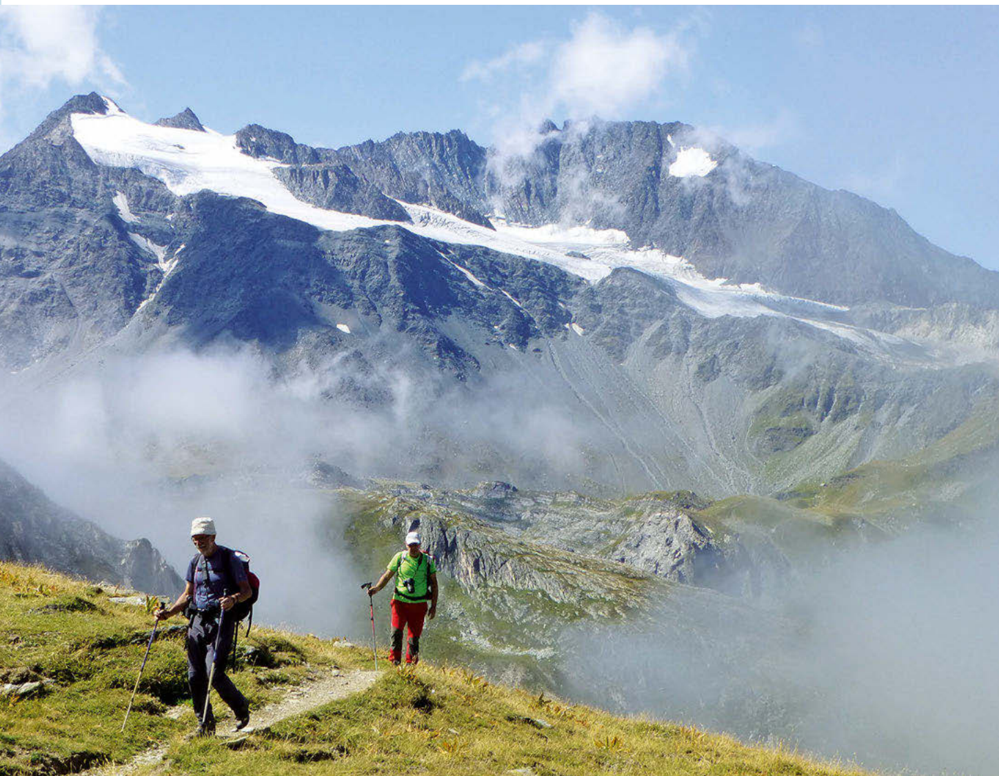
Marchando por el Circo de Génepy

Comenzamos a caminar cerca de las 11:30, bajo un sol de justicia, para afrontar los 1100 metros de desnivel que nos separaban del refugio de Col de la Vanoise o Félix Faure. La subida, cansina,