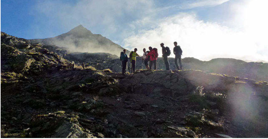
Llegando al Col d'Aussois

do pasamos por el Lac Long tenemos ya la Grande Casse (3860 m) encima de nosotros. El paisaje de cimas es precioso. El glaciar, en retroceso como el resto de los que vimos durante toda la travesía, dejaba ver múltiples grietas. Es muy peligroso ascender a la cumbre. Poco a poco nos vamos acercando al refugio. Nos ha llevado cerca de 4 horas la ascensión y vamos a disfrutar de una preciosa tarde bajo el sol hasta la hora de la cena, a las 19:00. El refugio está casi lleno y tenemos una habitación para nosotros diez. El atardecer se presenta limpio. La luna llena asoma detrás de una montaña. Nos dirigimos a nuestras literas a las 21:30 después de la consabida sesión de fotos. No duermo bien, lo de siempre, esos ruidos de la noche.