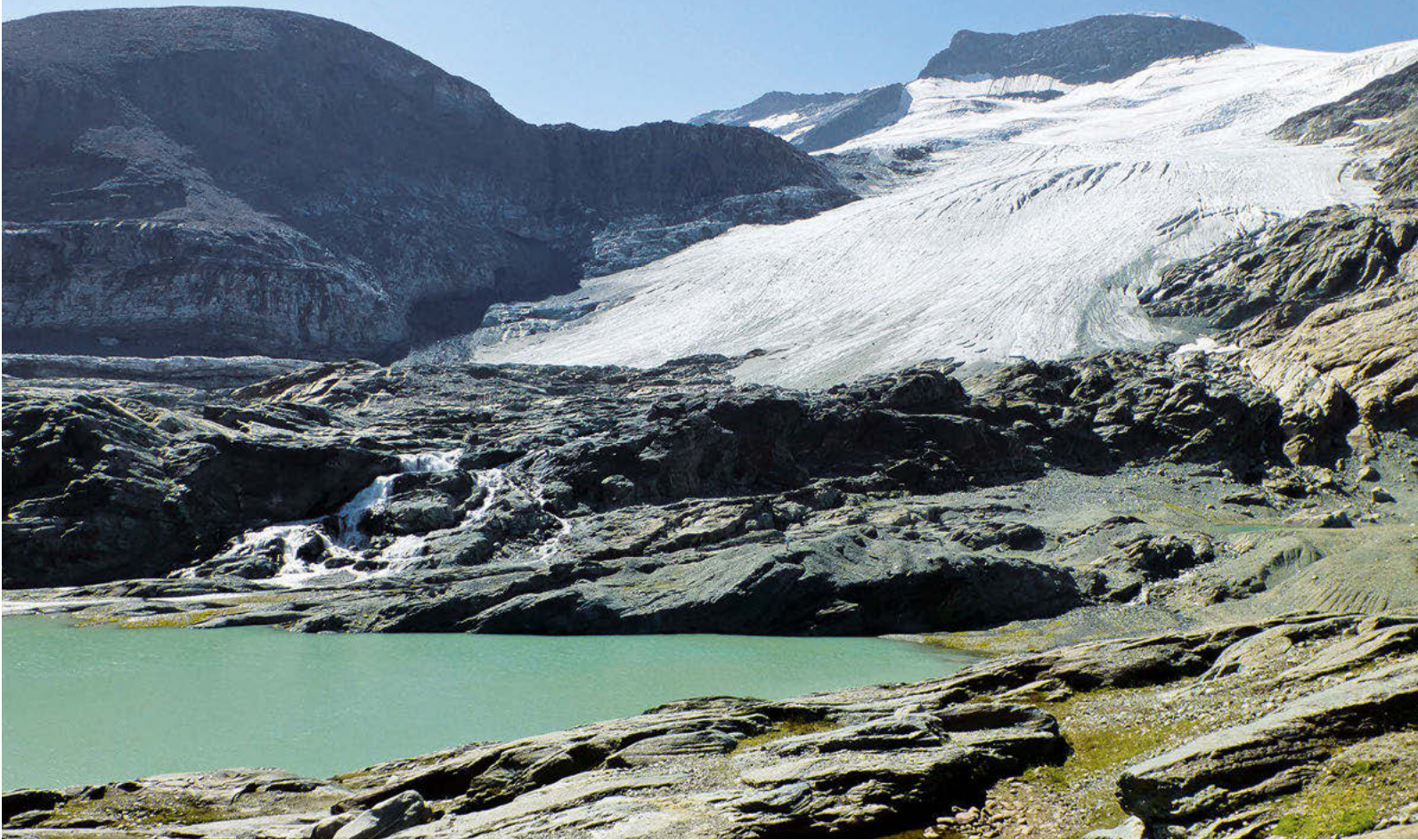
Glaciar y Lac de l'Arpon

llado. Vemos muchas marmotas, que con sus silbidos nos van despertando, e incluso un quebrantahuesos que vuela cerca y se posa en una roca, manteniendo la distancia, impasible. El paisaje se va abriendo y el sol se va colando suavemente a través de las nubes bajas. Llegamos a la cruz del collado y enfrente tenemos la cima de la Pointe de l'Observatoire, que alcanzamos tras ascender tan sólo 100 metros más. Vistas espectaculares a 360 grados. A lo lejos, el gran Mont Blanc dominando tantas y tantas cumbres. Descendemos por pendiente bastante fuerte hasta una pradera, sin perder de vista el glaciar allá arriba, entre nubes que lo cubren y se disipan. El deshielo forma torrenteras y hay agua por todas partes.