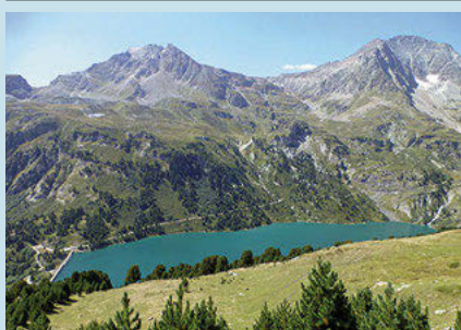
Lago Plan d'Amont, al fondo el Col de la Masse.