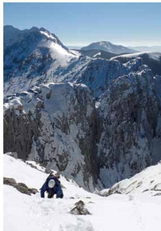
■ Llegando al vértice geodésico del Alluitz.

Las vistas de las que disfrutamos se repiten en pocas ocasiones