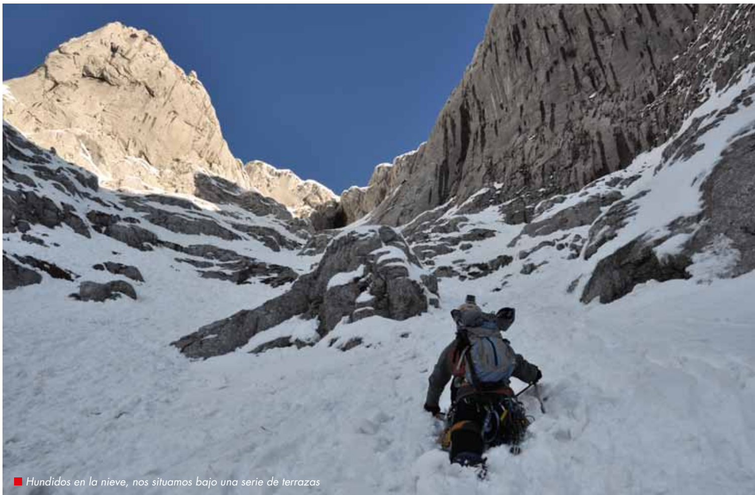
■ Hundidos en la nieve, nos situamos bajo una serie de terrazas

resto del camino, hemos traído material de escalada; así que nos acomodamos junto a la pared y nos equipamos con arnés, piolets y crampones, antes de que sea tarde. Pegados a la pared, realizamos la travesía y no tardamos en ver a lo lejos sobre nuestras cabezas, en lo alto de la canal de Kokuzkulu, la cueva del Eco.