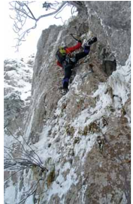
■ En el cuarto resalte de la canal de Urkulu

Desde aquí tenemos dos opciones: la primera, irnos por una canal nevada algo más inclinada, unos 55-60° dependiendo de cómo se haya metido la nieve, que sale hacia la izquierda y que nos llevaría a la cima de Larrano Urkulu Puntie; o la segunda alternativa, afrontar el último resalte para salir a la brecha de Larrano Urkulu o Urkulandije. Nosotros optamos por esto último, aunque el resalte parece durillo pero la subida por la canal con la cantidad de nieve que tiene y con el sol pegando ya en la parte alta no nos convence.