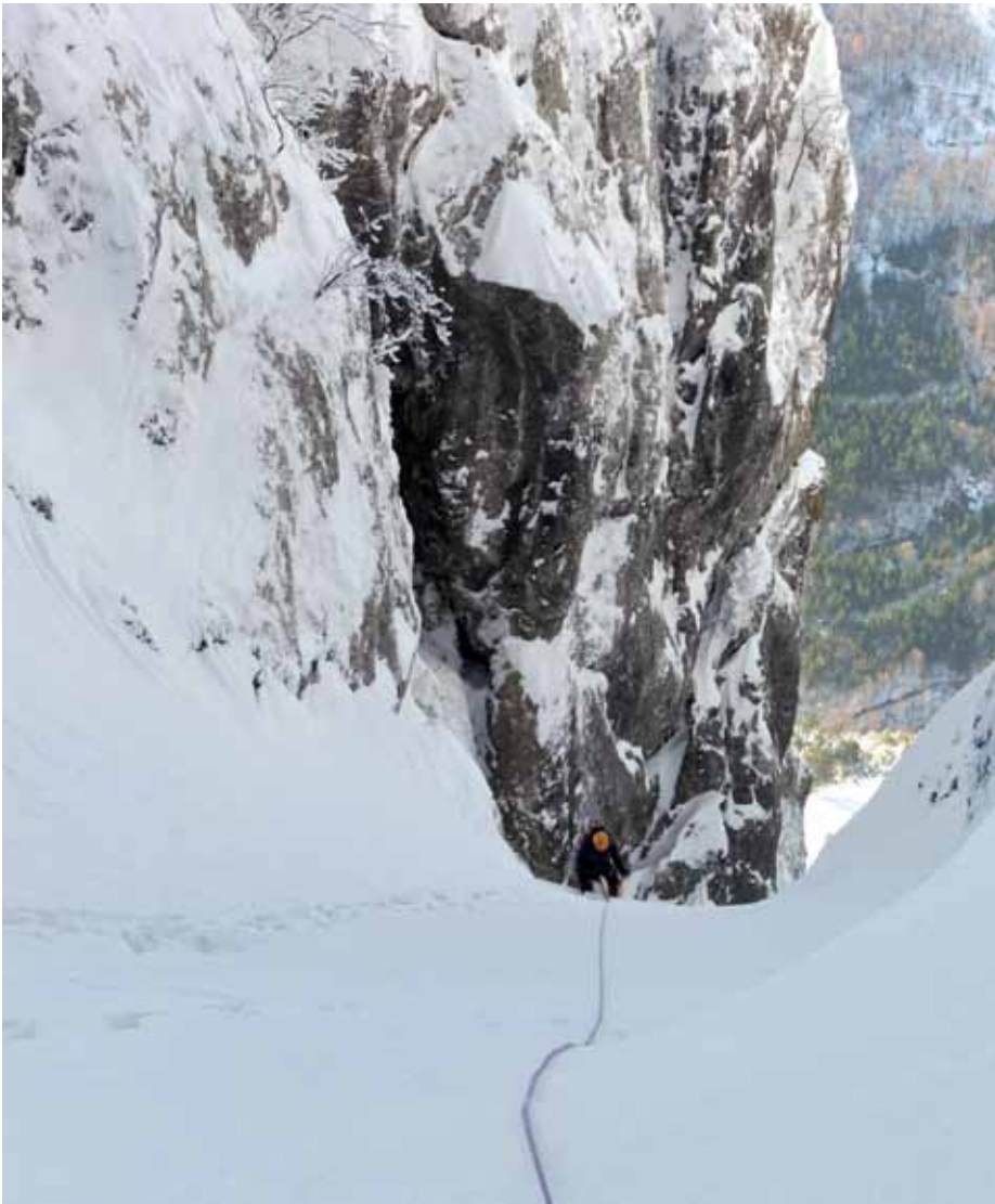
■ Parte intermedia del corredor