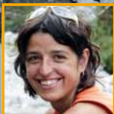
Texto y fotos Isa Casado Gallego