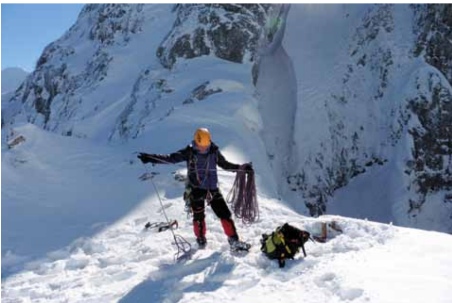
■ En la brecha de Urkulandije, justo a la salida de la canal