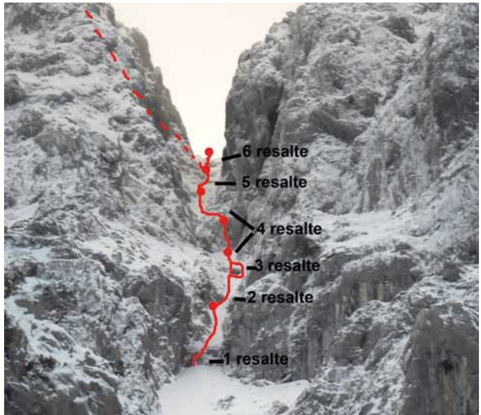
■ Croquis de la canal de Urkulu ( www.todoescalada.net )

Vemos un primer clavo que cuenta con más de 25 años, que curiosamente fue fabricado