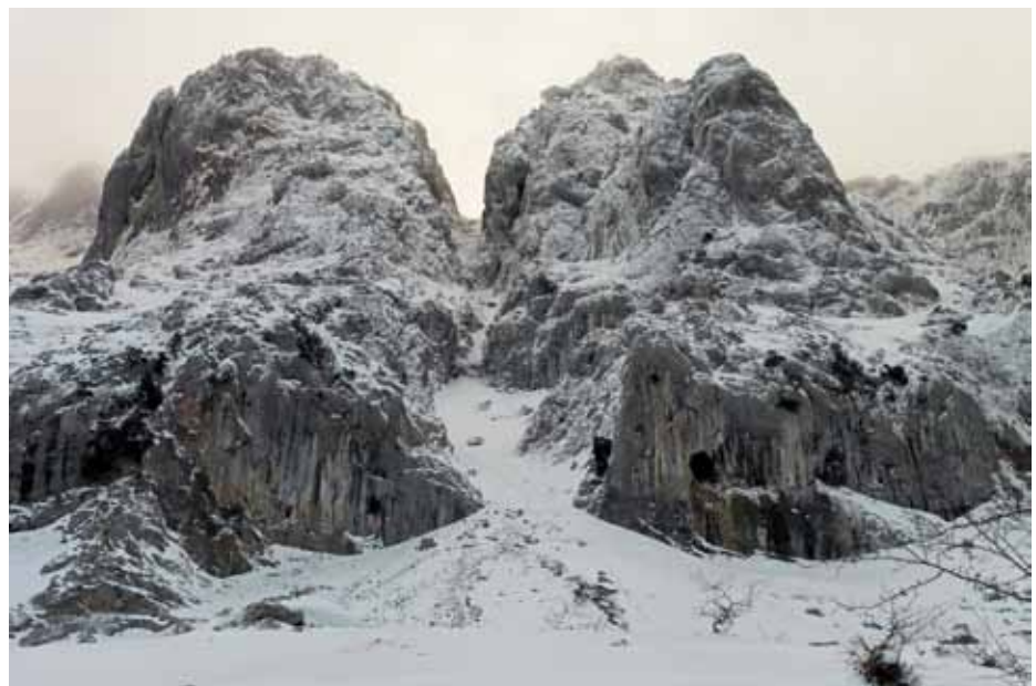
■ Canal de Urkulu