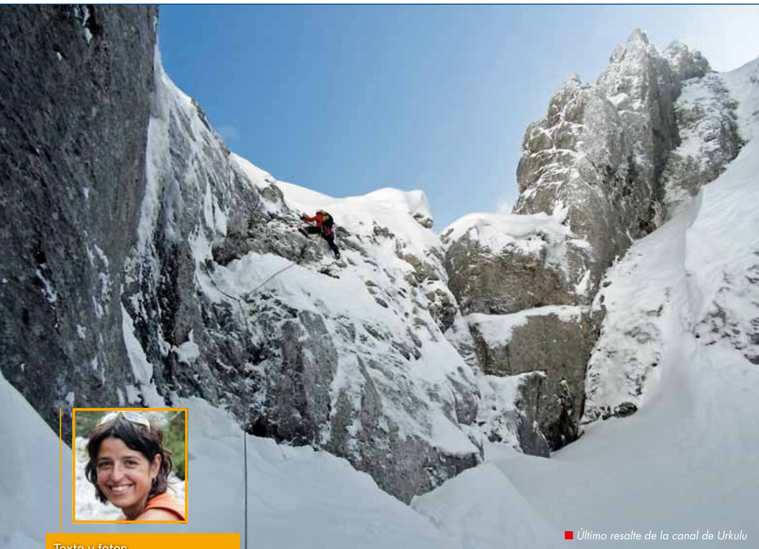
■ Último resalte de la canal de Urkulu