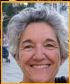
Texto y fotos Miren Garmendia Etxenike

Hace unos cinco millones de años, un pequeño volcán empezó a formarse a 4000 m de profundidad en el océano. El crecimiento fue muy rápido debido a su intensa actividad, lo que le llevó a surgir a la superficie hace tres millones de años. Hoy en día, este edificio de 7000 m de altitud (comprendida la parte inmersa) sobresale 3070 m. El Piton des Neiges, origen de la isla, se ha apagado hace unos 20.000 años. La erosión y los colapsos han formado a su alrededor tres circos: Cilaos, Mafate y Salazie, circos atravesados por profundos valles llamados "ravines". Otro macizo volcánico es el Piton de la Fournaise, muy activo desde hace 350.000 años. Entre los dos, encontramos una sorprendente meseta a 1600 m de altitud: la Plaine des Palmistes y la Plaine des Cafres.