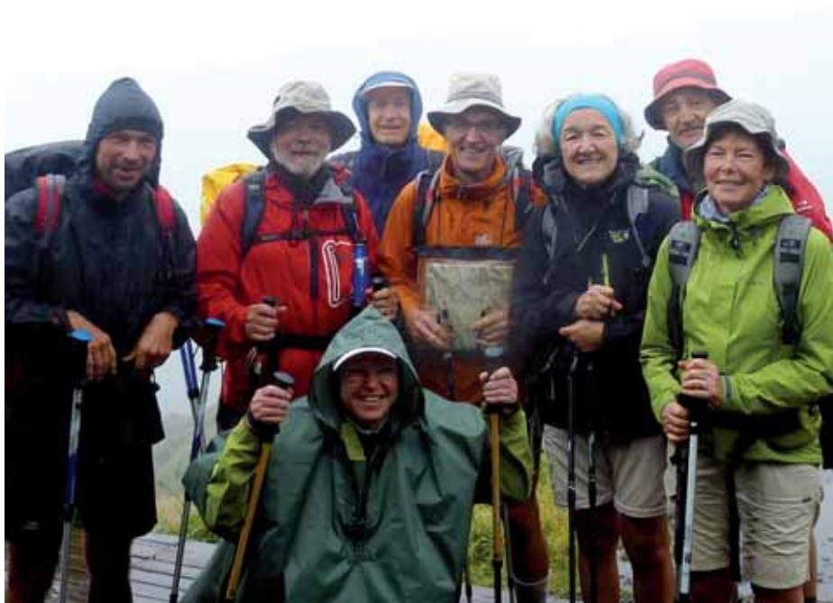
■ Etapa 8. Caverne Dufour – Bourg Murat. Nos esperan siete horas de bajada en un torrente

Nos quedan dos días para bajar de nuevo al nivel del mar. El penúltimo día es una etapa