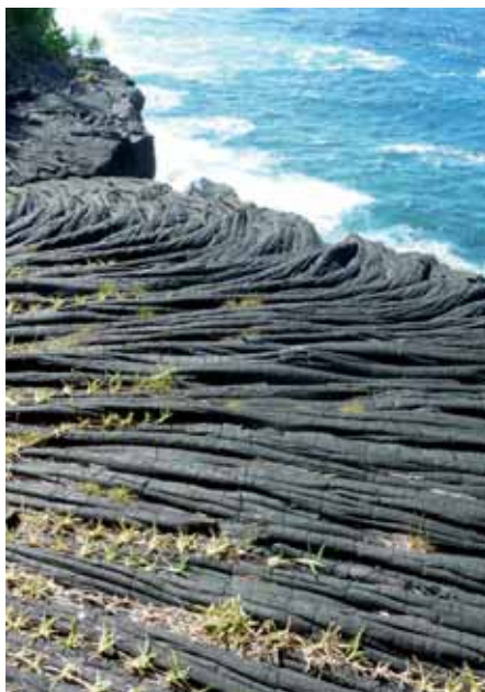
■ La lava en el litoral

El objetivo del trekking era andar por los tres circos, Cilaos, Mafate y finalmente Salazie, de donde se sube al Piton des Neiges, punto culminante de la isla.