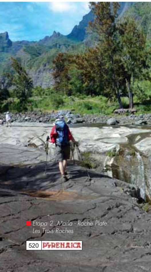
■ Etapa 2. Marla - Roche Plate. Les Trois Roches

frustración de no haber hecho cima. Pero nos quedan todavía muchas maravillas.