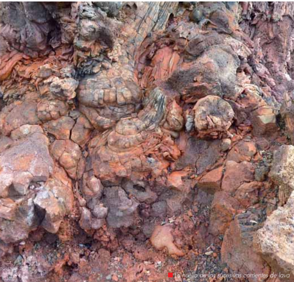
■ La huella de las sucesivas corrientes de lava