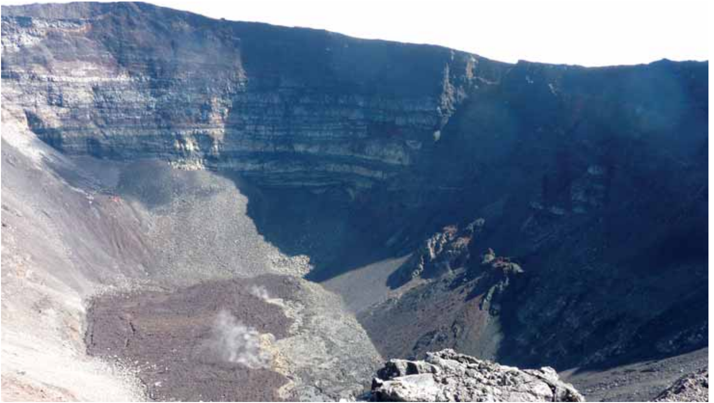
■ Etapa 10. Volcán de la Fournaise. Cráter Dolomieu