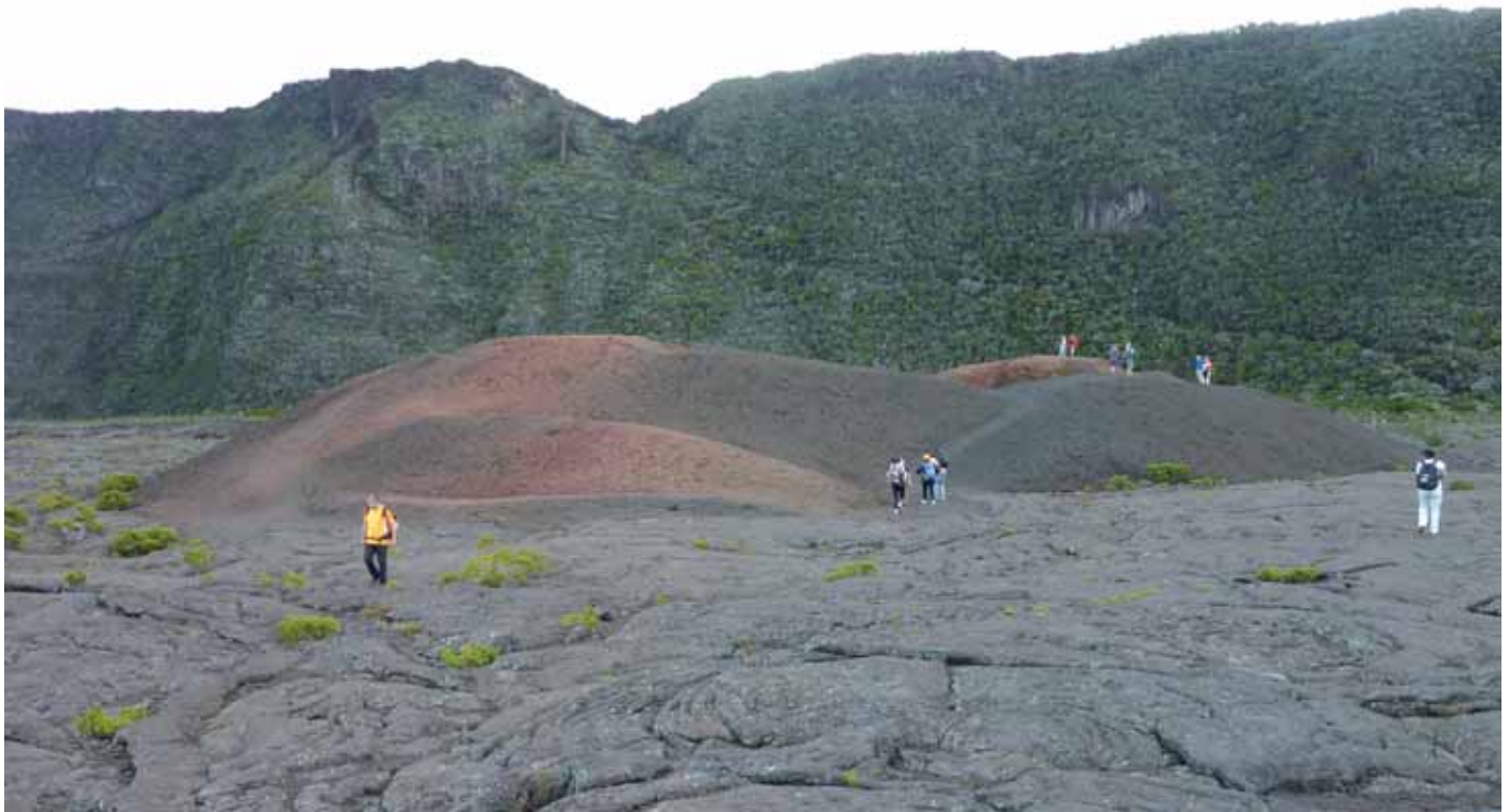
■ Etapa 10. Caminando sobre el volcán