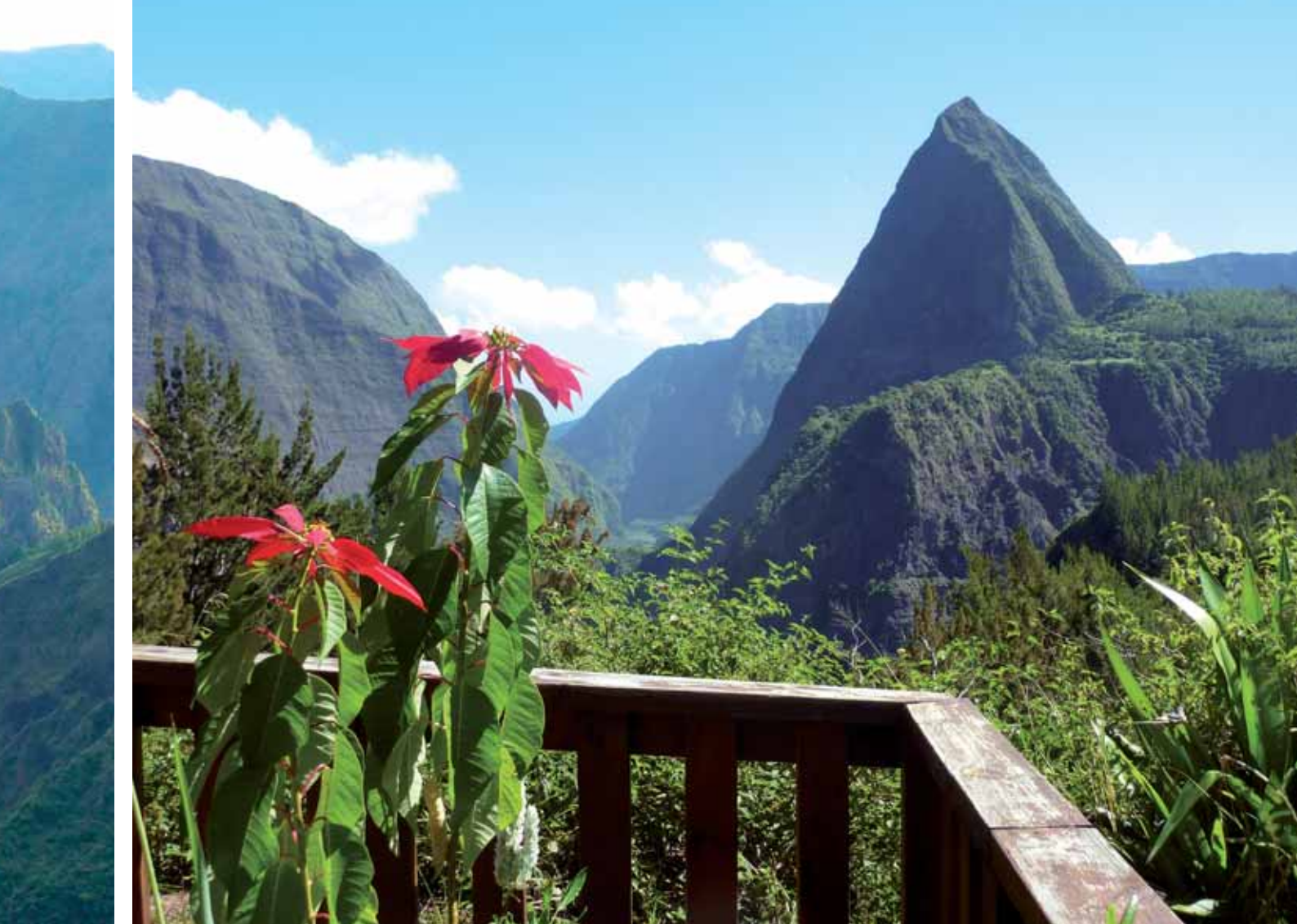
■ Etapa 4. Cayenne – Ilet à Malheur. Piton Cabri y poinsettias

esperaba al día siguiente. Cuando se vaticina una nueva erupción el acceso a esta puerta queda prohibido. Una noche totalmente estrellada nos anunciaba un buen día encima del volcán.