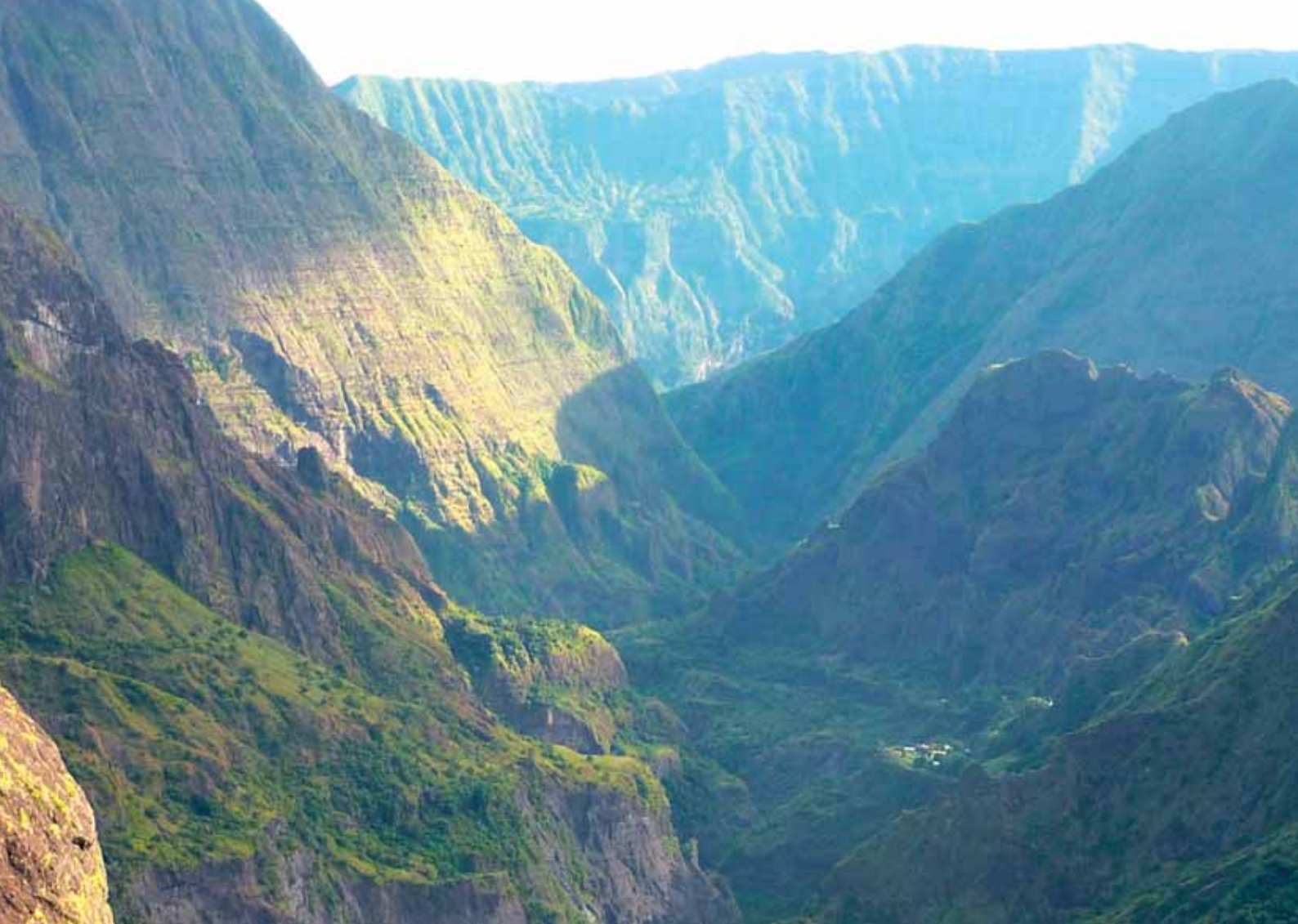
■ Etapa 3. Roche Plate - Cayenne