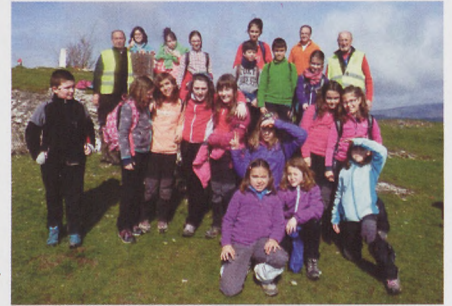
■ D.E. Arrayuelas y D.E. San Cristobal (Oteo)

A punto de acabar la campaña, se puede decir que ha transcurrido con normalidad. Entre los meses de enero y mayo, la asistencia de escolares ha experimentado un ligero descenso. Ciertamente es que, el invierno, ha provocado algún problema, e incluso, hubo que suspender una salida por nieve. Dicha salida se añadirá al final de la campaña.