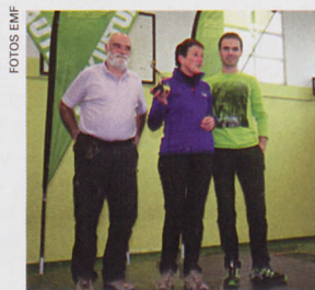
■ Premio a la marxta mejor valorada