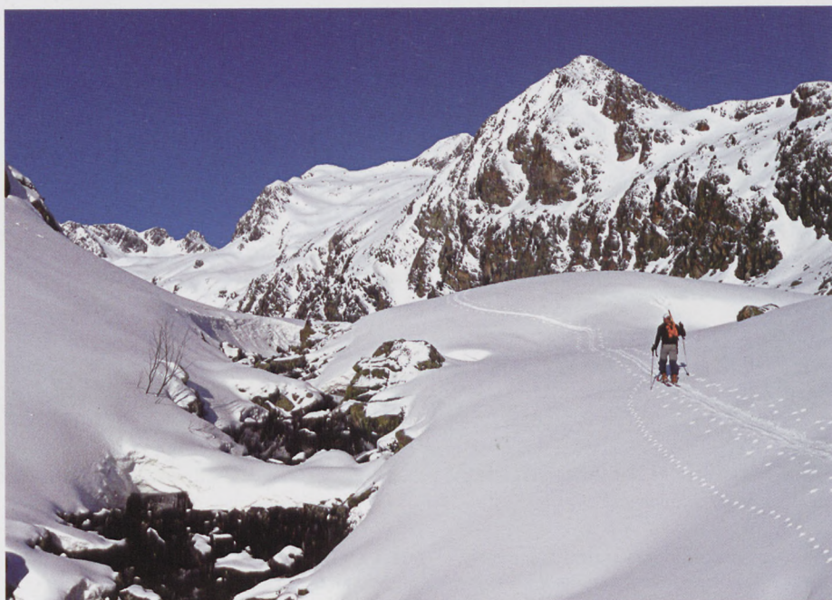
■ Llegando al lago de Cèstrède, en el centro al fondo la cima de Cèstrède

Cèstrède, desde donde podemos divisar al fondo nuestro objetivo. Atravesamos todo el lago y seguimos por el fondo del valle ganando altura de forma suave.