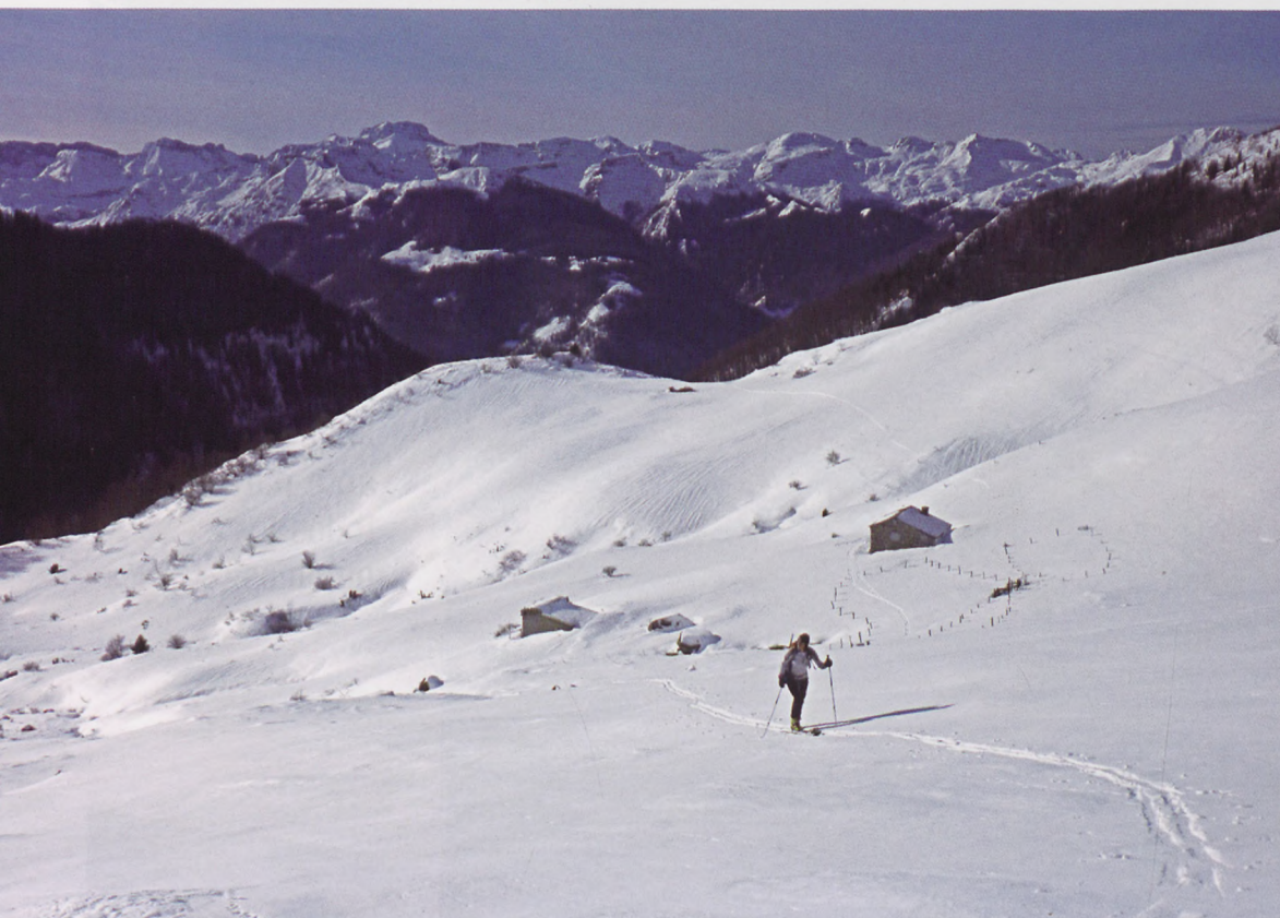
■ En la cima del Sesques