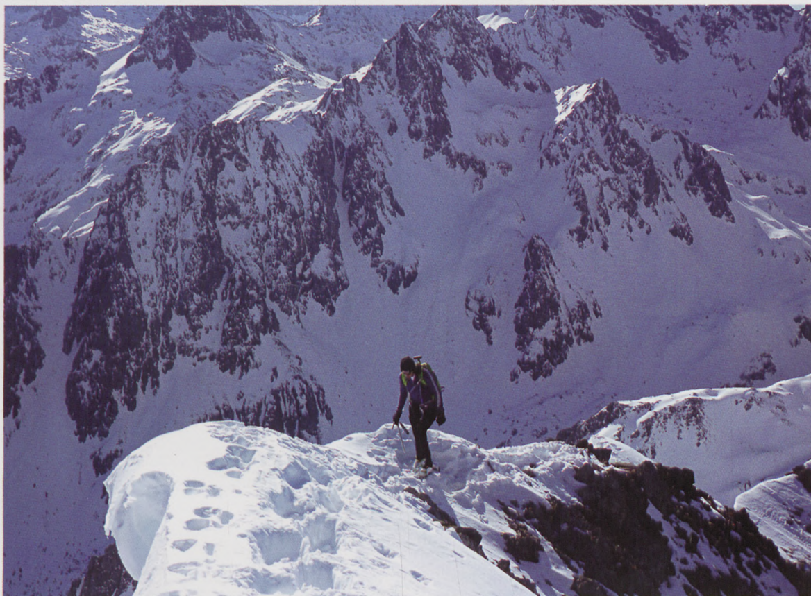
■ En la cresta del Grand Gabizos

Salimos de la barrera (1080 m) y seguimos por la carretera hasta el Lago de Tech. Dependiendo de la cantidad de nieve que haya, se nos ofrecen dos posibilidades para adentrarnos en el valle de Labas. En caso de que no haya nieve suficiente en cotas bajas como para subir foqueando, es mejor tomar hacia la derecha, al inicio del lago, el sendero de verano indicado hacia el collado de Uzious y la cabaña de Bouleste, por la margen izquierda del río. En cambio, si vemos que hay continuidad de nieve, será mejor seguir hasta el final del lago de Tech y tomar allí el sendero que sube por la margen derecha del río, ya que en esta margen aguanta mucho más tiempo la nieve. En cualquier caso, ascenderemos sin problemas por el valle hasta llegar a la cabaña de Bouleste (1720 m).