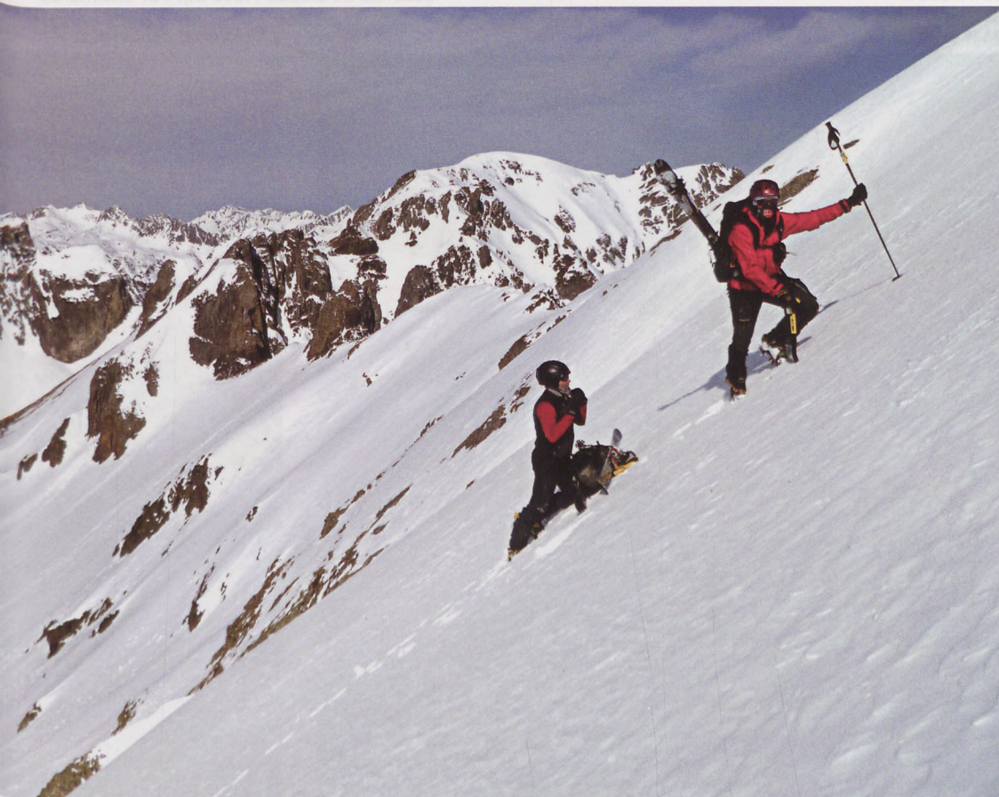
■ Arbizon. Últimos metros antes de la brecha Aurey

El Arbizon guarda una cara sur muy interesante, aunque no apta para todos los públicos