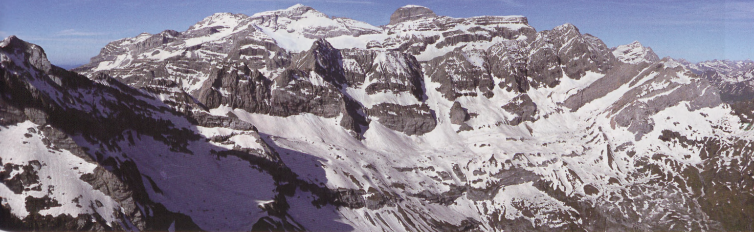
■ Panorámica Tucarroya, Monte Perdido, Cilindro desde la cima del Estaube

Desnivel: 1370 m (dos cimas), 1000 m si hacemos sólo una de ellas. Duración: 2-3 h (subida), 1 h (bajada). Dificultad: PD (asc) 3.3/E2 (desc). Orientación principal: NE, NO