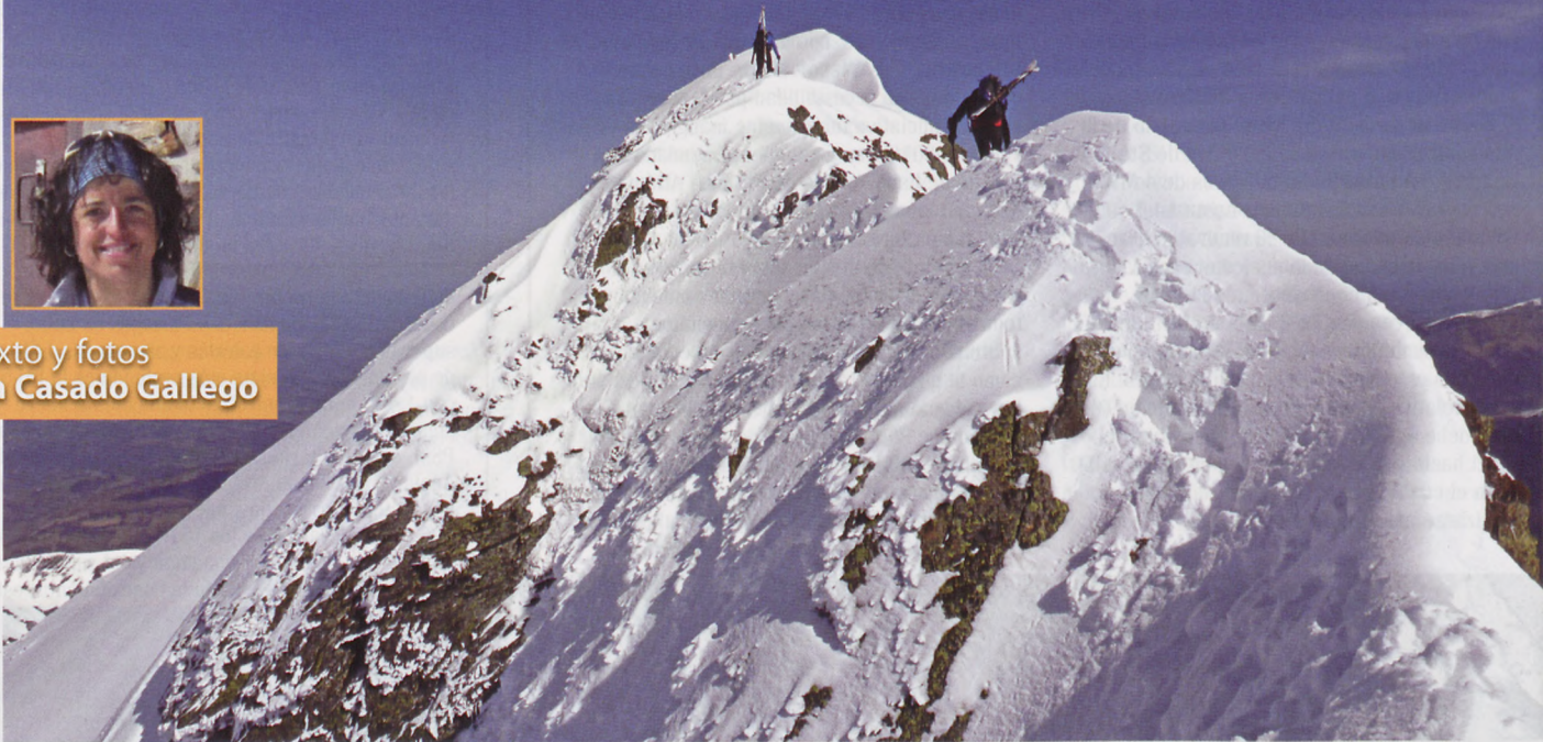
■ En la cresta cimera al Montaigu

D ECIDIRME por esta pequeña selección de recorridos de esquí de travesía no ha sido fácil, ya que las opciones son muchas. Aquí van ocho rutas por montañas poco concurridas y fuera de los recorridos más habituales y clásicos. Son itinerarios que, probablemente, podremos disfrutar en soledad, abriendo nuestra propia huella. Aunque no es lo más recomendable en el esquí de travesía, varias de ellas las he realizado sola. La sensación de ir abriendo traza en un immaculado manto blanco, con las únicas huellas de algún que otro animal, es indescriptible y adictiva a la vez.