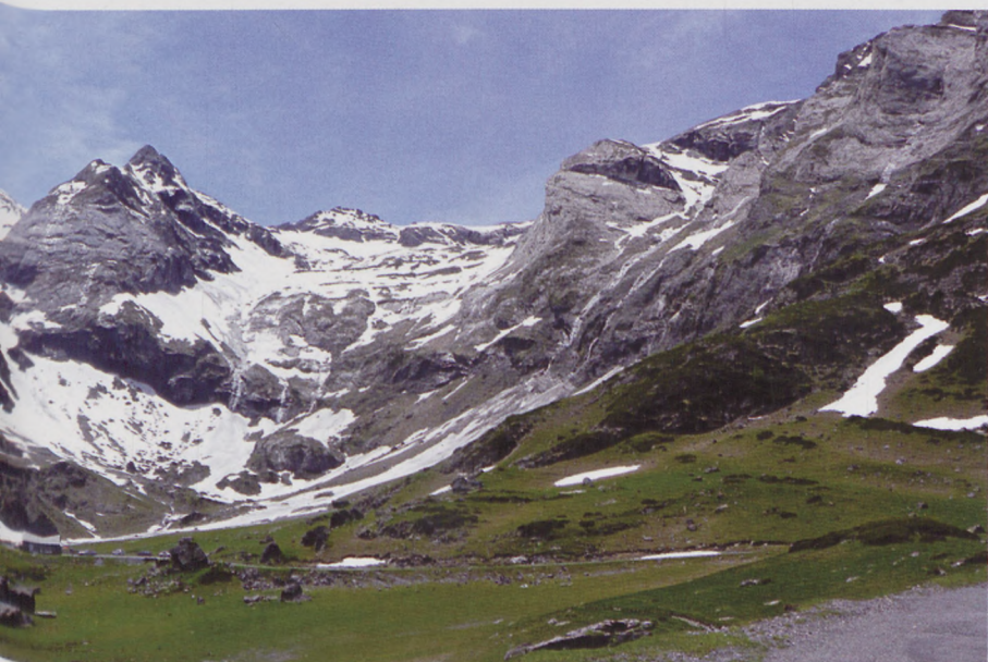
■ Panorámica circo Estaube-Gabiedou

El descenso se puede hacer por el mismo itinerario. Alternativamente, si la nieve está en buenas condiciones, podemos descender por la canal que hay entre la cumbre del Gabiedou y el Pico Bouneu. (Conviene fijarse desde abajo si la canal no está barrida por las avalanchas)