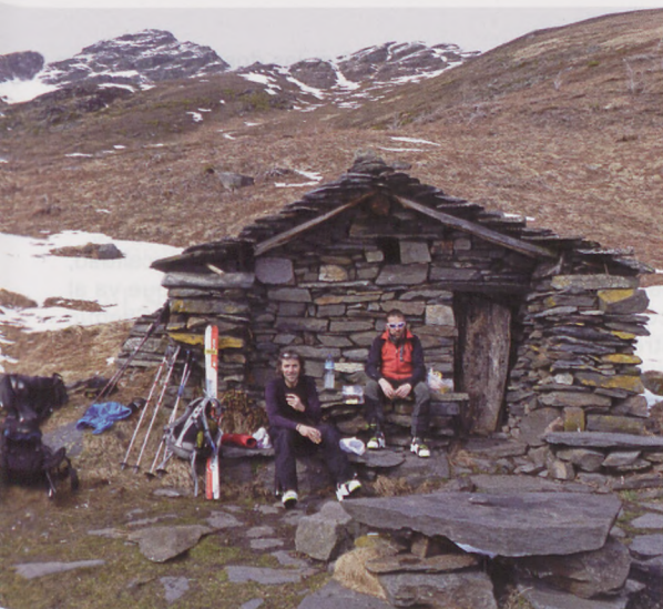
■ Cabañas del Courtau de la Lit