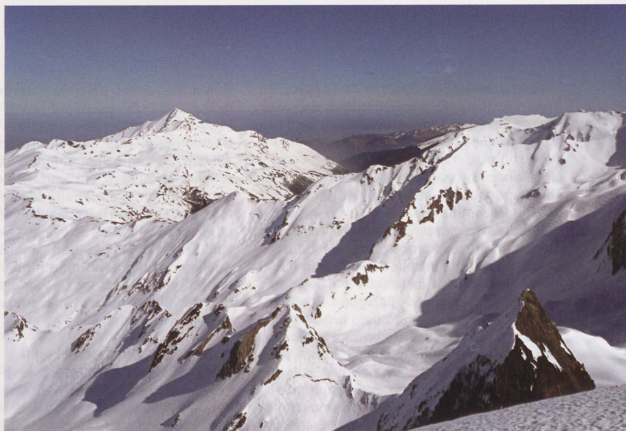
■ Montaigu al fondo, visto desde el Pico Leviste

cha, bajando unos metros por la cara este (40°-45°), para cruzar un hombro por el que accederemos al corredor sur (35-40°). Dada su orientación, es importante tener en cuenta la hora a la que entramos, para no encontrarnos con una nieve demasiado transformada.