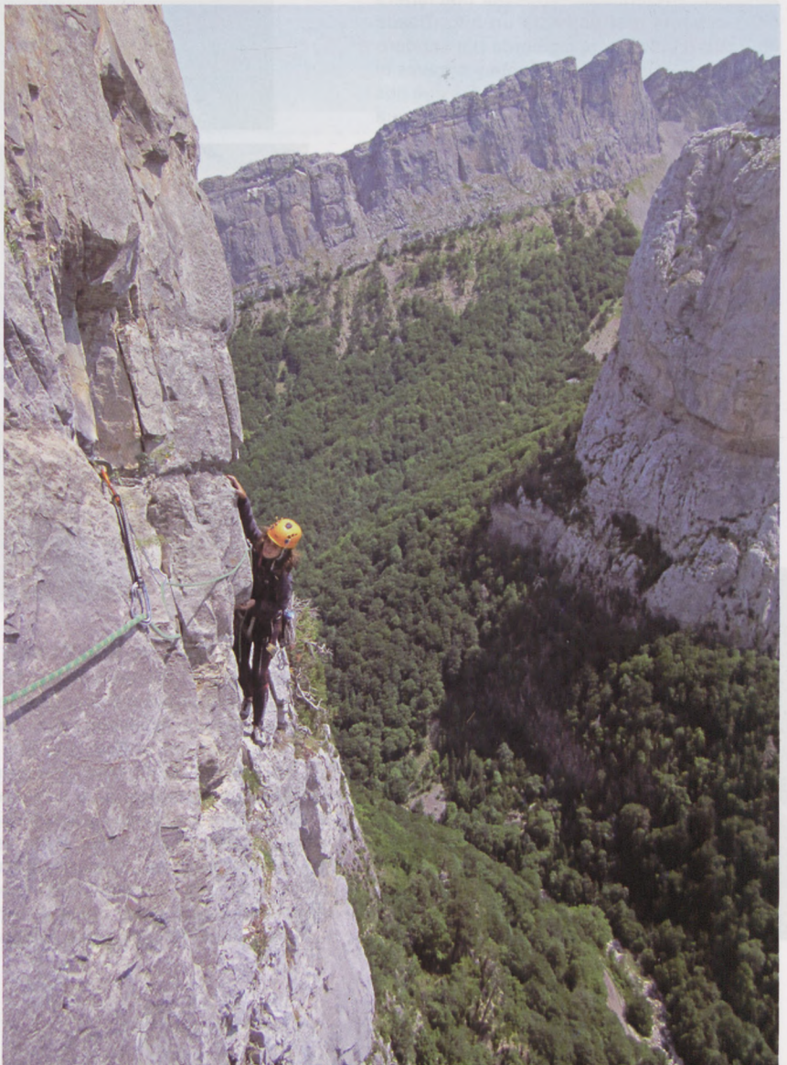
■ Camille trido

Con este periplo de vías en los Pirineos habremos ocupado parte de la primavera-verano de este año 2015 y servirá para ir calentando motores para las vacaciones de verano. □