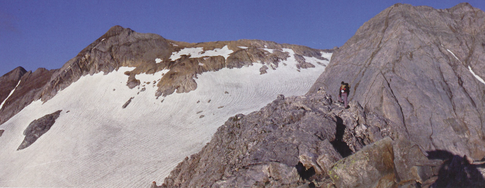
■ Vignemale. Buscando el inicio de la arista