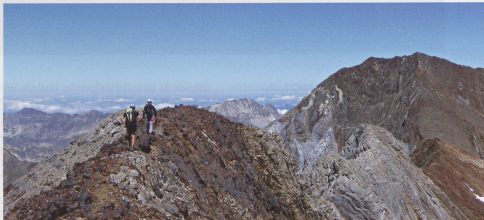
■ Arista Espadas-Posets. Los últimos metros de la arista

expuestos y bajar con muchísimo cuidado. El mejor camino será una chimenea fácil (II), también muy descompuesta, es la tónica de esa parte de la cresta. Salimos al filo, aéreo y muy roto. Desde ahí divisamos un gran espolón que aparentemente parece infranqueable; lo salvaremos por el lado izquierdo, por unas repisas que lo rodean, para luego trepar por el peor sitio que jamás haya trepado en mi vida (II). Un terreno muy vertical, aéreo y muy, muy roto. Una vez superado el trago, la roca se transforma en algo muchísimo más sólido y adherente.