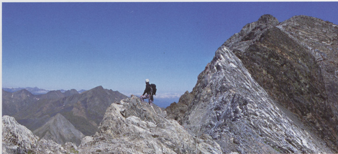
■ Arista Espadas-Posets. Paradas para admirar el paisaje