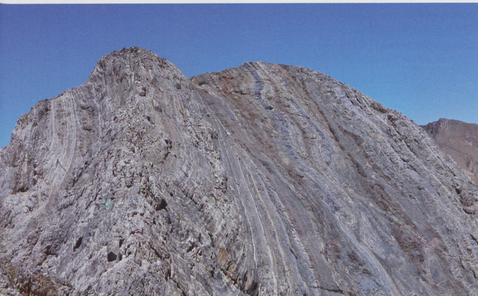
■ Arista Espadas-Posets. Estudiando la mejor posibilidad

Llegamos al Pico Espadas, otro pequeño muro (II+) se interpone en nuestro camino. Enfrente se ve el Posets, cada vez más cerca