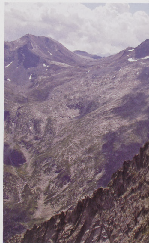
■ Trois Conseillers. Filo de la arista

La chimenea (II+/III) por la que hay que descender del Petit Vignemale es extremadamente aérea y descompuesta