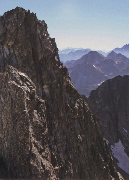
TOKIA: COSTERILLO ERTZA

irten eta abiapuntua normalean Pla d'Asta-n (1480 m) izaten da, bertan 40 autotarako aparkalekua dago. Baina elur-jausi arriskua dagoenean, errepidea Tec-eko presara heldu baino lehen dagoen hesiaz itxita egoten da. Txango hau burutzeko garairik egokiena udaberria da, langa zabaltzen dutenean. Eta proposena mendi eskiekin egitea da.