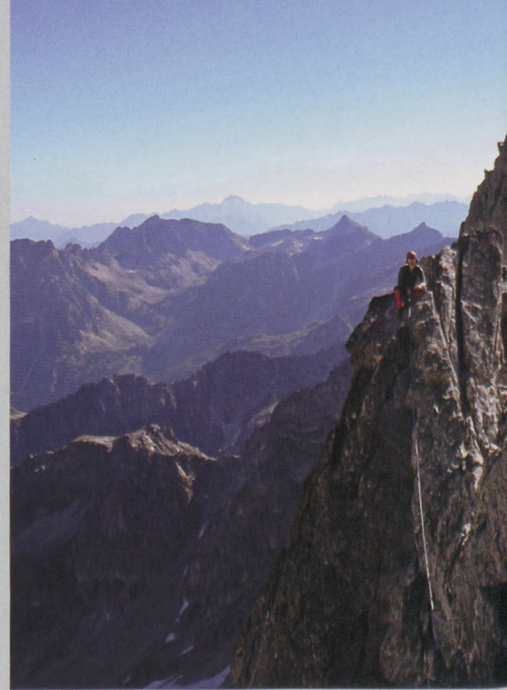
■ Bistadun eserlekua, atzean Ussel orratza

Dorrea Cadier igobidetik erasoko dugu. Elkargunetik irten eta jarraian IV. graduko igarobide desplomatu bat gainditu ondoren, III. mailako eskalada geratzen zaigu Costerillo dorrera (3049 m, 07:40 h) heltzeko. Oso gailur zorrotza da eta beste