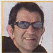
Texto y fotos Esteban Diego Iraeta

E N este artículo queremos ofrecer dos recorridos no muy frecuentes, pero de alto interés montaño. Al lado de Bisaurín, en Lizara, se levanta la sierra de Bernera, constituida por Olibón, los cinco picos de Bernera y la Punta Alta de Napazal. En los Banyos de Pandicosa, enfrente de tres milas como Garmo Negro, Algas o Argualas encontramos un reguero de dos milas que ofrecen multitud de posibilidades, como los Dients de Batans y las cuencas lacustres que los rodean.