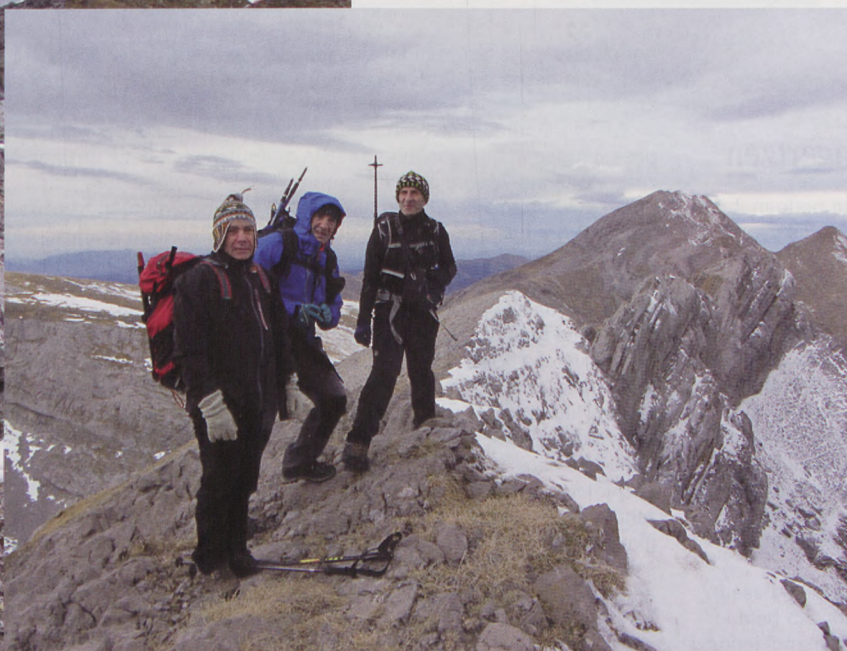
■ Cresta desde la Ruabe de Bernera