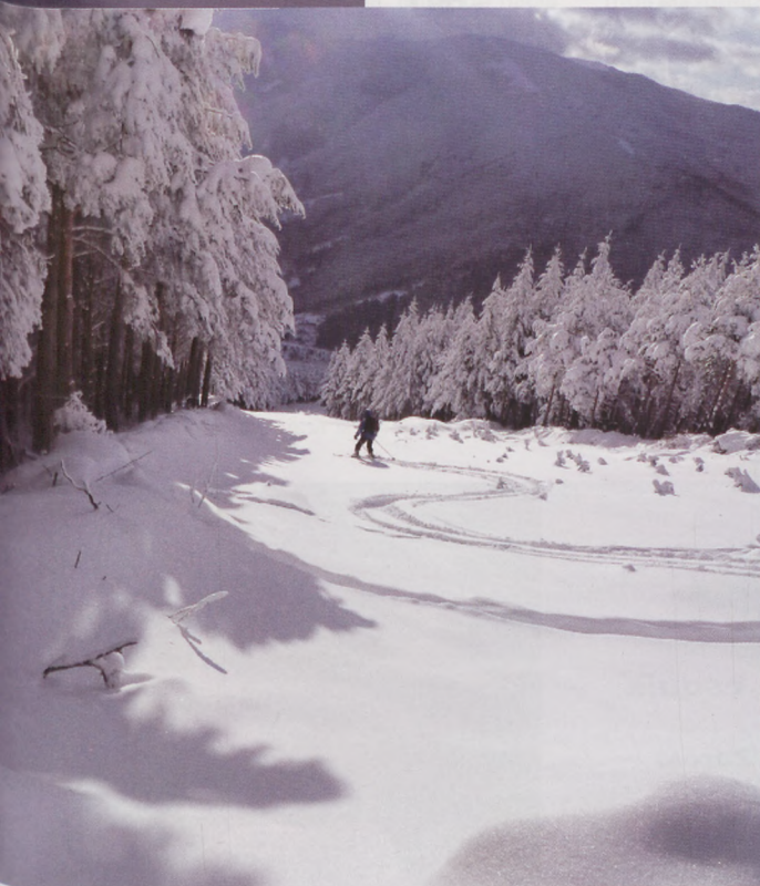
■ Esquiando sobre el cortafuegos del monte Valhondo