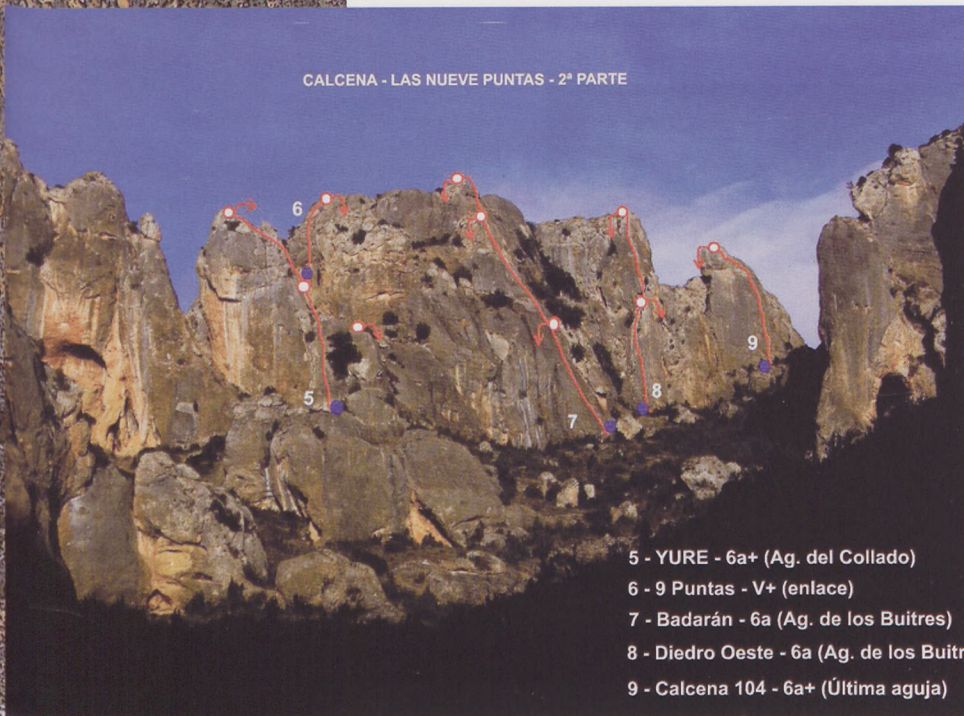
CALCENA - LAS NUEVE PUNTAS - 2ª PARTE