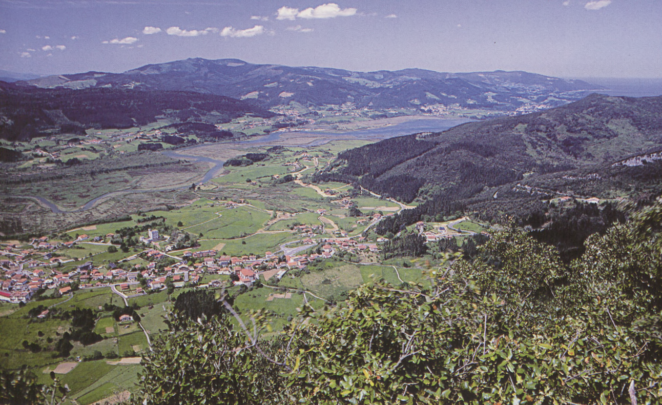
■ Paisaje de Urdaibai desde la cumbre de Ereñozar