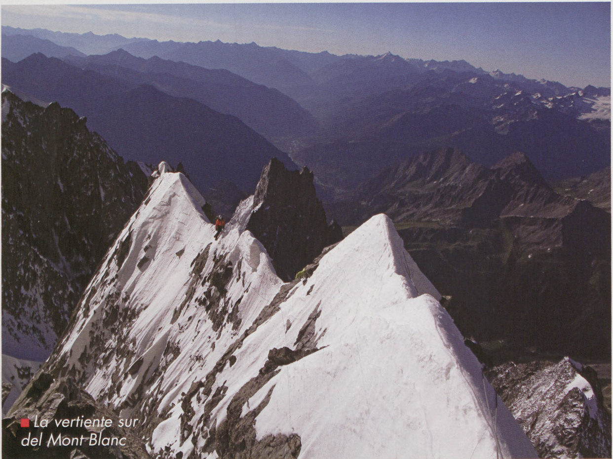
■ La vertiente sur del Mont-Blanc