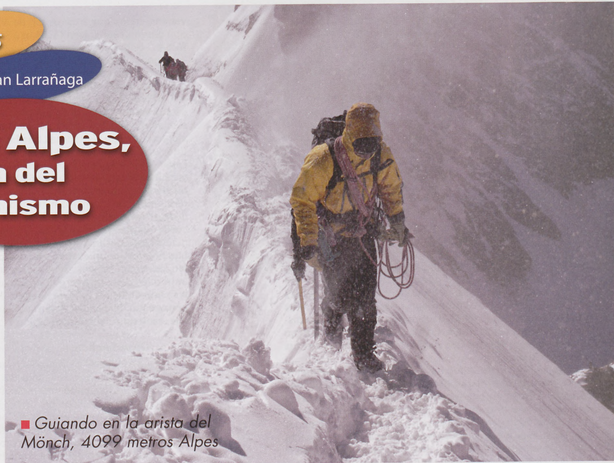
■ Guiando en la arista del Mönch, 4099 metros Alpes