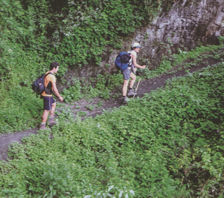
■ Waseremerako bidean dani bat izan genuen bidean lagun