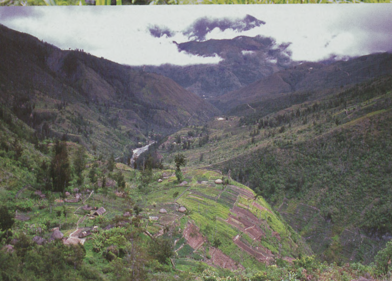
■ Herrixka dania mendiko paisaian

filmetakoa gisakoa: mendikate bertikal eta erraldoiak, arroila sakonak eta ur lasterreko ibaiak, guztia oihan basatiez jantzia eta langar iraunkorrez estalia. Horregatik, Papua azken muga da, oraina eta iraganaren arteko azken muga. Muga hori zeharkatu nahi izan dugu, Baliem haranaren hegoaldeko Dani etniakoan lurraldean trekking-a eginez.