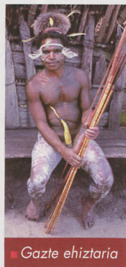
■ Gazte ehiztaria

Mugwi errearen ibarra estua da. Iparraldeko magal aldapatsuan soroak baino ez dira ikusten. Patata gozoa ( batata ) landatzen dute batez ere daniek, baita lekak, azak, tipulak, berakatzak... ere. Landaretza handiko lurralde malkartsu honetan soroak egiteko, zuhaitzak bota eta sua ematen diote lurrari. Etxe inguruan berriz banana zuhaitzak eta tabakoa landatzen dute. Lanabesak ere oso arkaikoak dituzte: harri arokoak, alajaina! Aizkorak, aitzoak eta aitzurak, zorrozitutako harriari zuntzez lotutako egurrezko kirtendunak, etxean egindakoak noski. Oso okela gutxi jaten duten arren, etxeko abere nagusia txerria da. Klanaren aberastasunaren adierazgarri da txerri kopurua. Zeremonietan eta horrelakoetan akabatzen dituzte hazitako urdeak.