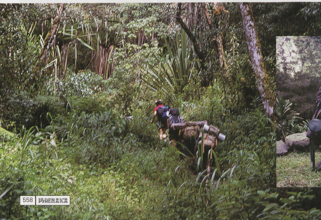
■ Danien eta gure janzeraren artean desberdintasuna, XXI. mendearren eta neolitikoaren artekoa bezain handia da