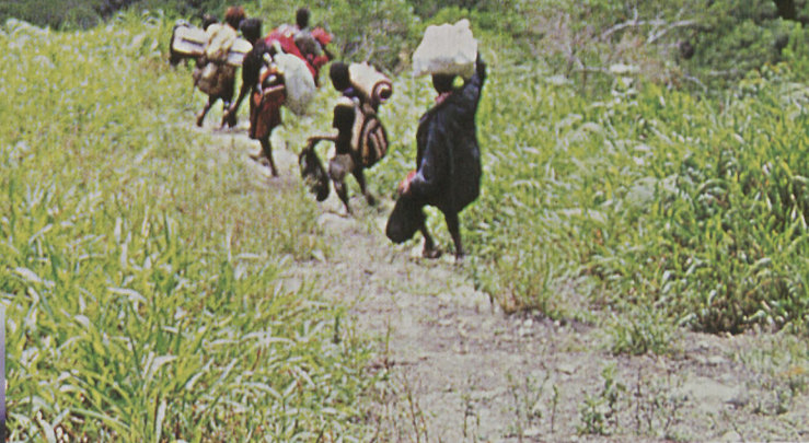
■ Belaunak eta izterrak mindu zaizkigu Wasegalep herritik Baliem ibairaino 900 metroko desnibela jaistean

G INEA BERRIA munduko bigarren uharterik handiena da, Groenlandiaren ondoren. Asiako hego-ekialdearen muturrean dago, Australiaren iparraldean. Mapa politikoaren arabera, lerro zuzen batek bi naziotan banatzen du uhartea: mendebaldea (Papua) Indonesiak okupatzen eta kolonizatzen du egun; ekialdea (Papua Ginea Berria) herrialde independentea da 1975az geroztik. Mapa fisikoaren arabera, uharteak txori baten itxura du eta beronen bizkarrezurra balitz bezala, 1600 kilometroko mendilerro batek zeharkatzen du mendebaldetik (burutik) ekialdera (isatsera), zenbait lekutan ia 5000 metroko garaiera hartzen duelarik. Mendilerro honi esker uhartearen iparraldeak eta hegoaldeak barra-barra jasotzen dute euria hego-ekialdeko eta ipar-mendebaldeko monzoi garaietan. Beraz, mendi gailurretako glaziarretan izan ezik, klima oso beroa eta hezea da ia lurralde osoan.