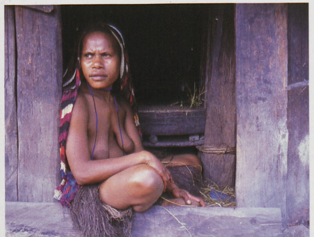
■ Emakume dani gaztea