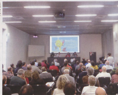
Charla sobre Responsabilidad Civil

Así mismo, hemos creado un nuevo apartado en nuestra web donde colgar recursos y herramientas útiles para mejorar la seguridad. De igual modo, hemos puesto en marcha otras iniciativas específicas para los clubes (Asesoría Técnica y nuevos cursos de formación).