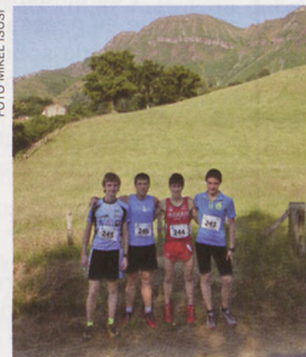
■ Los "cachorros" del equipo de carreras por montaña