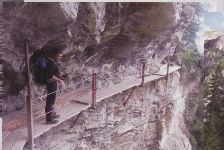
■ Bisse du ro ibilbideko pasabidea

ezkerretik gaudituz ondoren, berriro ibaiaren ondora itzuli ginen. Iffigen bailaran geunden. Bidean aurrera, bailara ixten duten harresi batzuetatik erortzen den Iffigfall ur-jauziaren azpira heldu (1319 m) ginen, euritan hasten zen bitartean. Kapa jantzi, ur-jauziaren argazkiak atera eta eskuineko basotik gorantz ur-jauziaren gainera ailegatu ginen. Oraindik zuhaitz artean ibaiaren ondotik jarraitu genuen eta basoa amaitzean Iffigen bailara berriro gure aurrean ireki zen. Handik lasterrera Iffigenalp aterpera iritsi ginen (1.584 m). Eguna luzea izaten ari zen eta azken igoeraren ondoren, atsedena gustura hartu genuen. Eraikin nagusian jatetxea eta logelak zeuden eta 50 metrora eraikin xumeago batean aterpea. Garbiketak kanpoko aska batean egin genituen metro gutxira zeuden behien begiradapean. Gure eraikineko beheko solairuan ukulua zegoen, baina zorionez ondoko behiak urrutia goero eraikin batean gordetzen zituzten. Handik gertu Suitzako militarrek bakarrik erabili dezaketen teleferiko bat dago eta ilundu aurretik bisitatu genuen. Gau hartan ere aterpean ia bakarrik egon ginen.