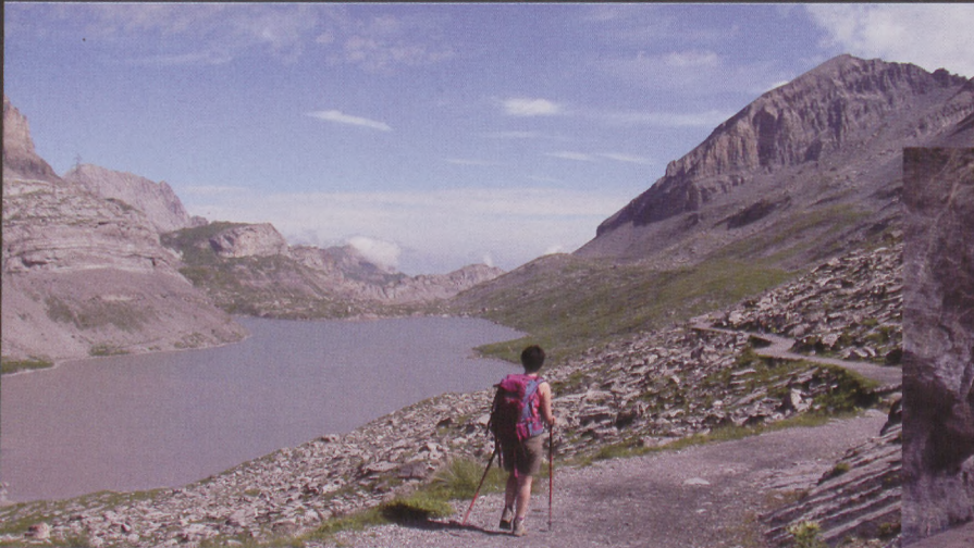
■ Daubensee lakuaren ondotik doan bidea