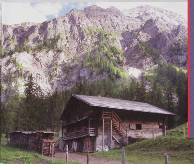
■ Iffigenalpeko aterpea eta Rawillpasserako bidea