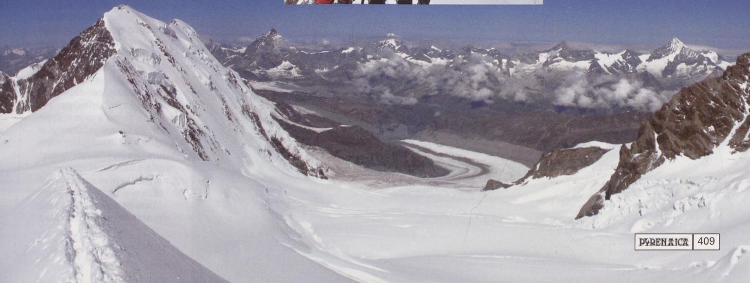
■ Un pequeño momento de descanso en el descenso por la estrecha arista del Parrotspitze