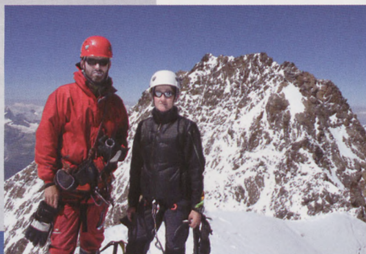
■ Un sueño conseguido... en la cima de la Zumsteinspitze (4.563 m)