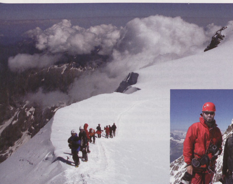
■ Esperando su turno para acceder a la cima de la Zumsteinspitze

Iniciamos el descenso por la arista, de nuevo extremando la precaución durante todo el recorrido. Nos llama la atención el extenso Glaciar Grenz, a los pies de la cara norte de los Lyskamm, y el abrupto perfil del Dent Blanche. Al final de la arista recuperamos la empinada huella que desciende por la cara SW de la Punta Parrot, hasta llegar al pequeño plateau entre ésta y el Ludwigshöhe, para volver sobre nuestros pasos hacia el Coll del Lys. Desde este punto, continuamos por la huella que se dirige hacia la Zumsteinspitze y la Signalkuppe, bordeando la cara oeste del Parrotspitze, sin apenas desnivel. La jornada está algo avanzada y la nieve comienza a estar muy blanda. Los amenazantes seracs de la Punta Gnifetti se sitúan sobre la huella trazada, por lo que ascendemos lo más rápido que nuestras piernas y la altitud nos