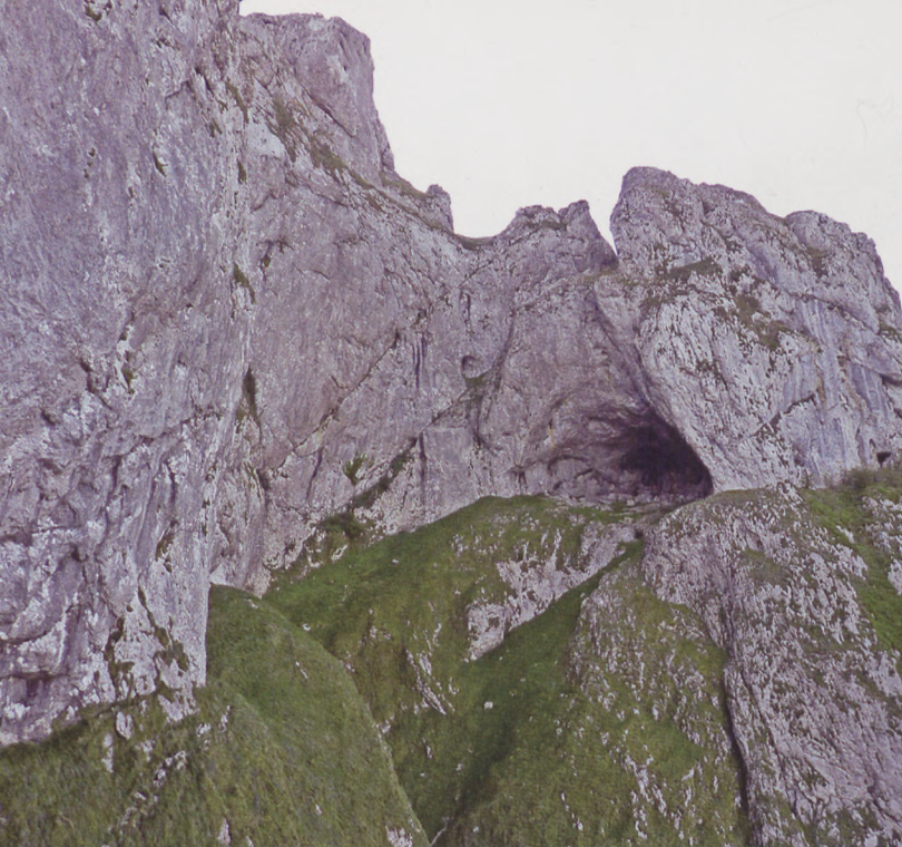
■ Anfiteatro NE