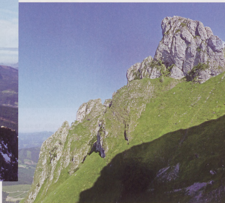
■ Arista norte de Udalatx

inaccesible. A su izquierda se alza una cima reseñable, un mirador perfecto sobre el Anfiteatro NE y la Gran Terraza. Se puede acceder a su cima sin complicaciones reseñables (I). A la derecha se halla la gran Vira Norte, sin duda la cara más alpina de Udalatx, donde el corredor toma su condición menos amable.