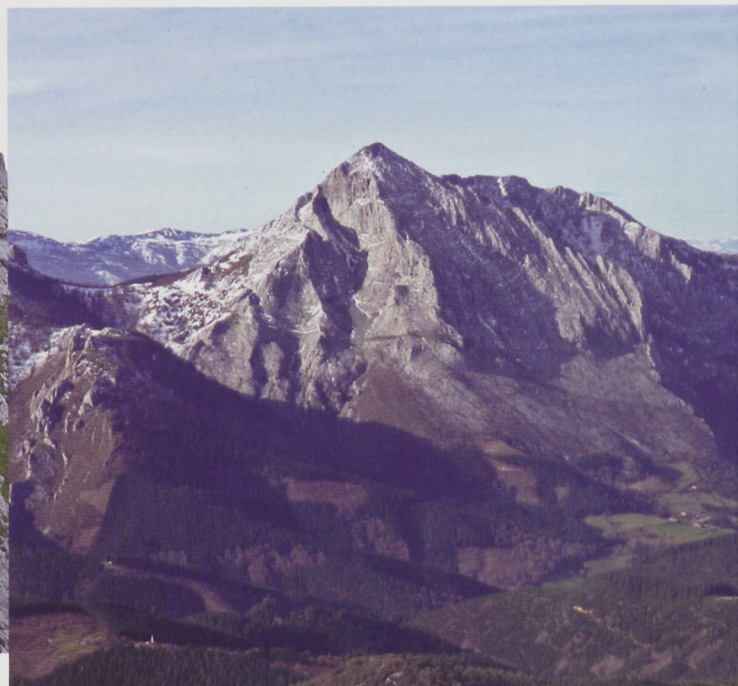
■ Cresta de Erdikoatxa