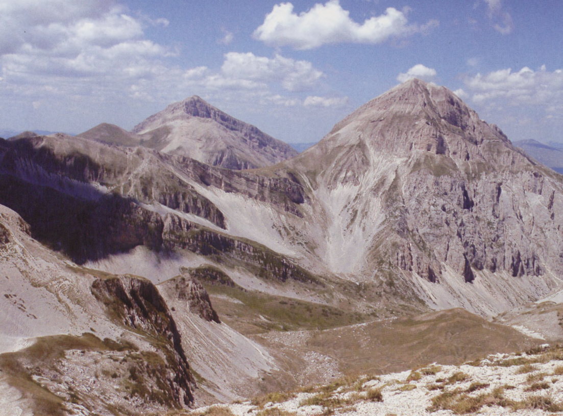
■ Monte Corvo y Pizzo Intermésoli, sobre Campo Pericoli