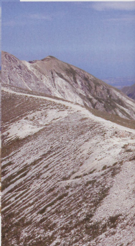
■ Refugio Duca dei Abruzzi