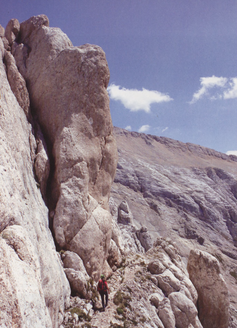
■ La ruta normal al Corno Piccolo