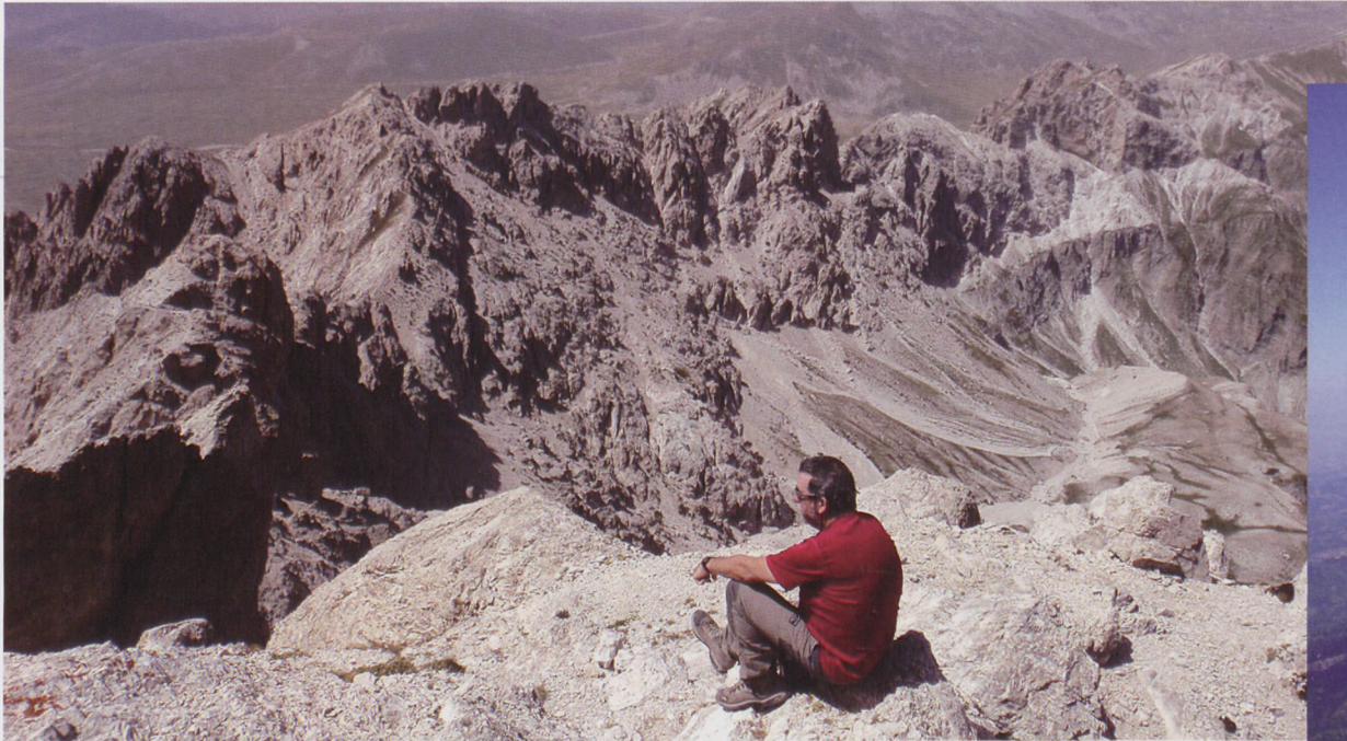
■ Sentiero del Centenario, desde Monte Prena

trazas que se desvían hacia el collado o Sella dei Grilli. Ascendemos por gradas de hierba que alternan con la glera hasta llegar a un collado herboso (2220 m, 2.50 h). Girando en dirección norte, empezamos a ascender el pedregal que remata la parte superior del Pizzo Intermésoli. Franqueamos el muro que se levanta antes de entrar en el circo superior, por una entrada evidente y señalada. El terreno es agotador, a ratos los incontables cantos aumentan de tamaño o surge una roca más sólida, lo que permite descansar del cascajar. La senda va en zig-zag ascendente superando las últimas pendientes de ripio. De esta manera alcanzamos la cima (2635 m, 3.40 h), coronada por una imagen de la virgen y una placa. Las nubes cubren las cumbres vecinas y el aire huele a tormenta. Sin perder tiempo volvemos por la misma ruta al punto de inicio.