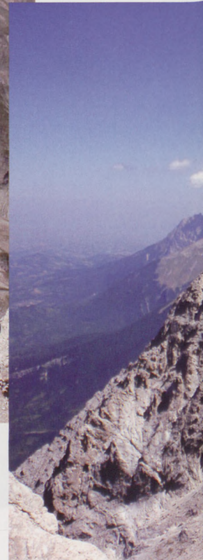
■ Refugio Franchetti, bajo el Corno Grande

Del lago di Providenza sale una carretera que cruza la presa, para transformarse en pista. Se puede continuar en coche a través del bosque hasta llegar a la presa del Acueducto del Chiarino, donde hay una barrera (1330 m). Empezamos a caminar por la pista oculta en el bosque, en suave ascenso. Pronto los árboles se apartan y el camino atraviesa una zona de merenderos rodeados de una cerca (1475 m, 20 min). Salimos del bosque y entramos en el valle del Chiarino, una amplia pradera acotada al norte por las estribaciones del Monte Corvo y al sur por la cadena del Morrone (2067 m). Alcanzamos la fuente de la Vacca-reccia, próxima a la granja del mismo nombre. A partir de ella se llanea, siguiendo la senda que va paralela al torrente del Chiarino. Se coge altura hasta una segunda llanada que acaba en una nueva borda (1680 m, 1h), apoyada en una pared rocosa. Con el cresterío del Monte Corvo a la vista, subimos la pendiente herbosa bordeando la torrentera seca, hasta llegar a la bifurcación que conduce a los collados Venacquaro y Corvo (1895 m, 1.45 h). Tomamos esta última dirección, hacia el norte. El arroyo recu-