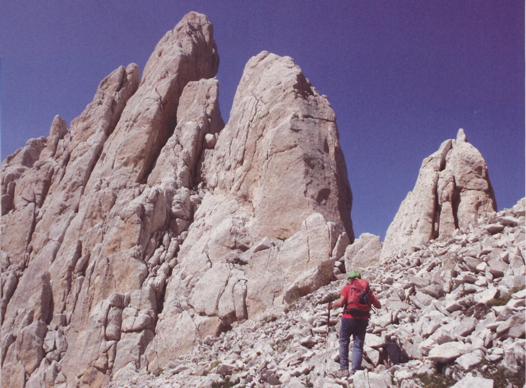
■ Via Danesi al Corno Piccolo