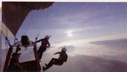
■ One step beyond

kutxabank mendifilm festival bilbao International Mountain Film Festival 14-23 abendua diciembre december 2012