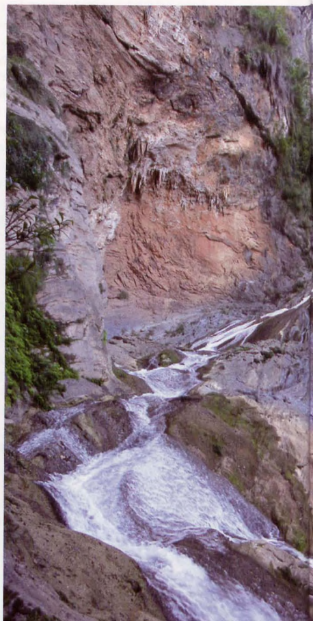
■ Salto del Caburni