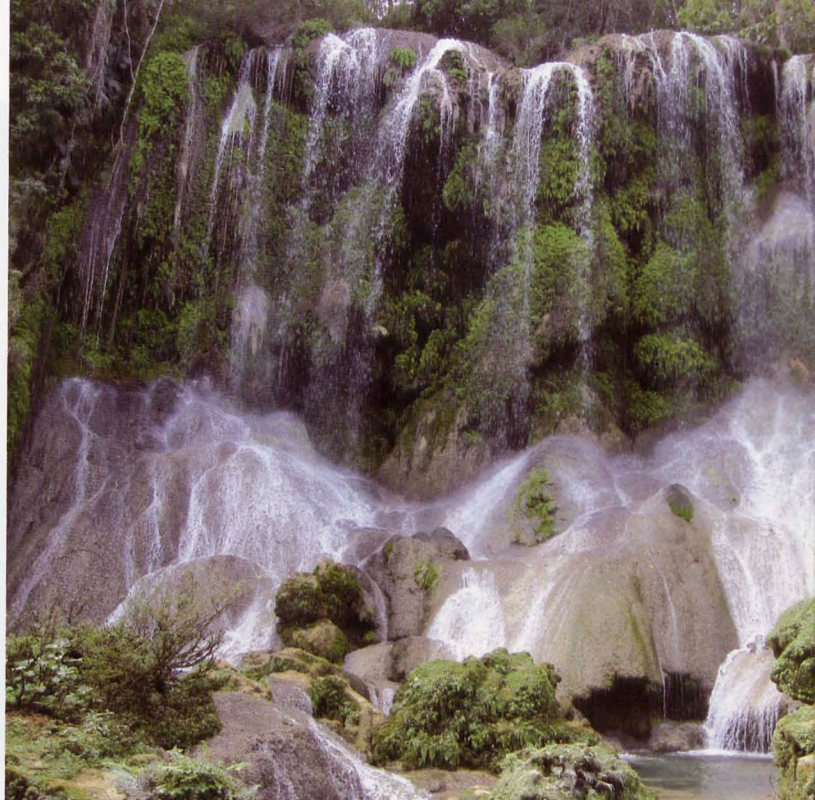
■ El Desparramadero de El Nicho