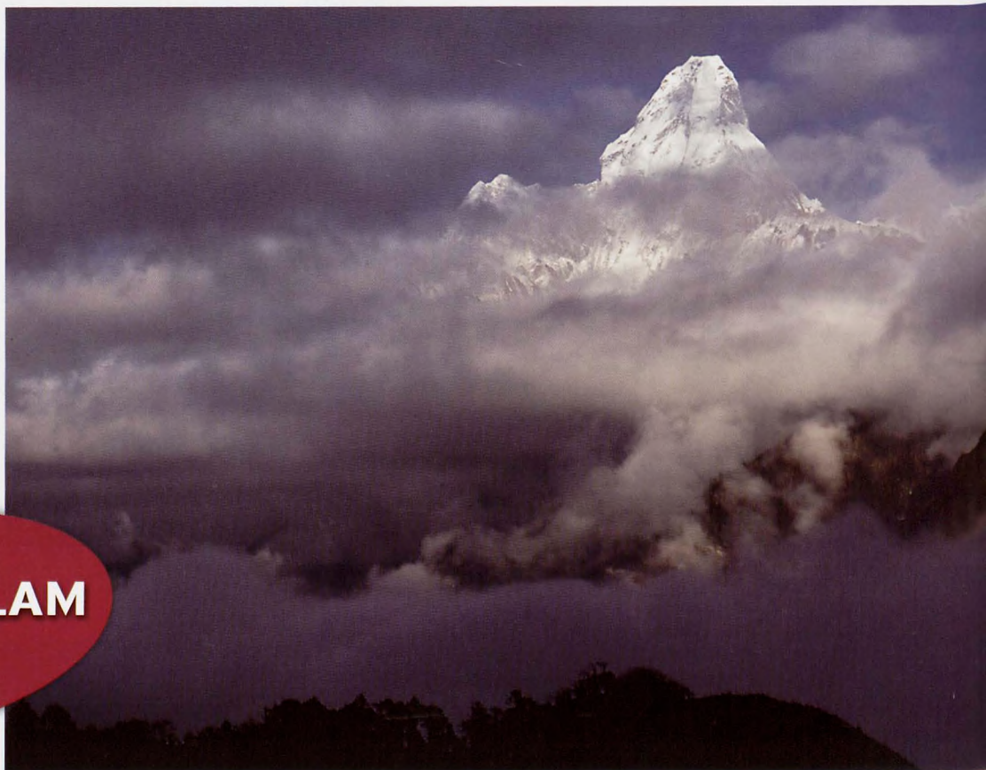
■ Cara sur desde la zona de Khumjung