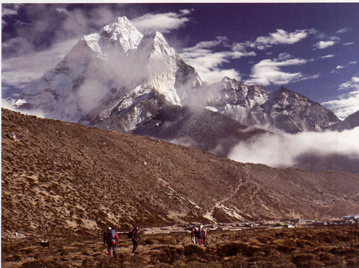
■ Cara norte y camino al Campo Base del Everest