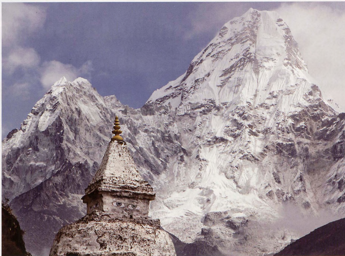
■ Uno de los numerosos templos budistas del Parque Nacional de Sagarmatha