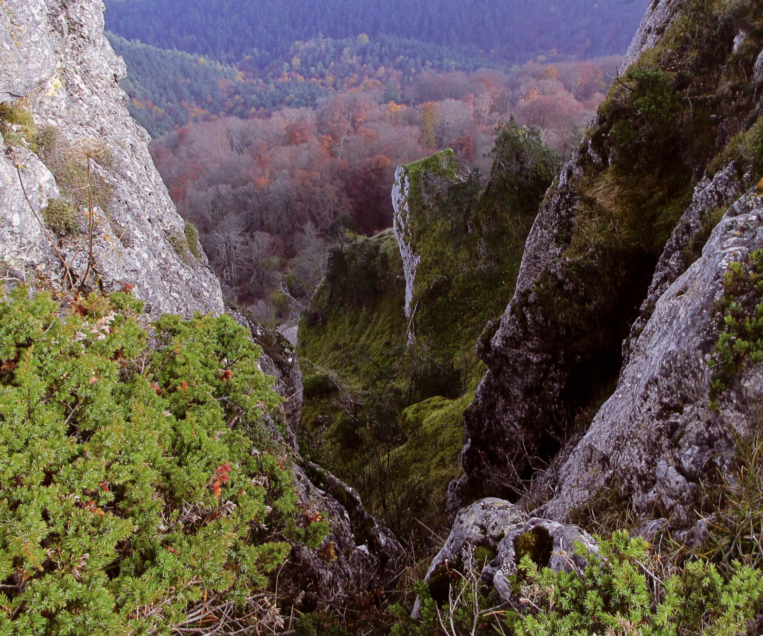
■ Portillo y colores del otoño

B ARRIO (701 m); Valdegovía, bucólico enclave cercado completamente por los ramales que se precipitan desde la Sierra de Árcena. Un bando colgado en una de las paredes del pueblo advierte de la aparición en el mismo de un chivo sin identificación... Tras aprovisionarnos de abundante líquido en la fuente de la plaza, subimos a la iglesia continuando por la pista que se dirige al monte. Sorteando la puerta metálica, el camino se introduce en el bosque para ganar altura progresivamente. Pronto, nace a mano izquierda (0h 25), señalado por un cairn , el sendero que permite atajar y remontar un duro repecho a través del túnel que configura el arbolado. Conectamos así de nuevo con la pista casi a la altura ya del portillo de La Hoz (993 m/0h 35). A nuestra izquierda, el cercano peñasco de Los Castros, a la derecha la visible cruz del Bachicabo con su ladera cubierta enteramente por el bosque y el boj. En el horizonte, el paisaje amarillea en búsqueda de la cercana Castilla. Remontamos la pendiente, por el serpenteante sendero. Llegados a la zona alta, el avance se complica aunque la línea del cortado nos sirve de referencia para alcanzar la cruz del Bachicabo (1199 m/1h 2). La panorámica resulta exagerada sobre las tierras valdegovinas. Con la mirada, recorreremos también el roto cordal hacia La Mota y el Cueto, punto culminante de la sierra.